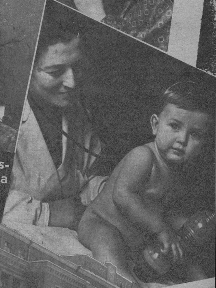
La consulta médi- ca a los niños en un Dispensar de Kiev