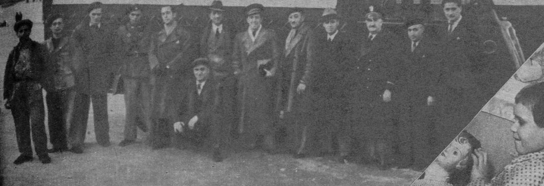
Los hijos de los mineros de Tkoartchel (Georgia), en los jar- dines de niños

PARTI SOCIALISTE S.F.I.O. SECOURS SOCIALISTE D'ESPAGNE REPUBLICAINE