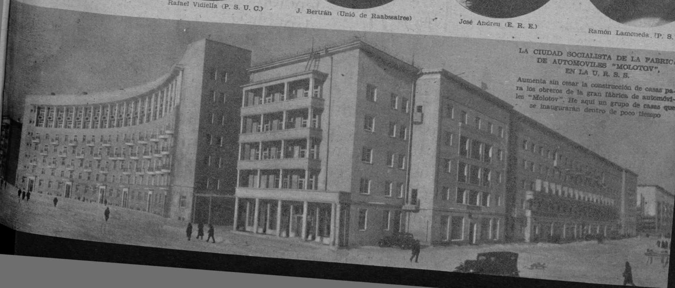
LA CIUDAD SOCIALISTA DE LA FABRICA DE AUTOMOVILES "MOLOTOV", EN LA U. R. S. S.

Aumenta sin cesar la construcción de casas para los obreros de la gran fábrica de automóviles "Molotov". He aquí un grupo de casas que se inaugurarán dentro de poco tiempo