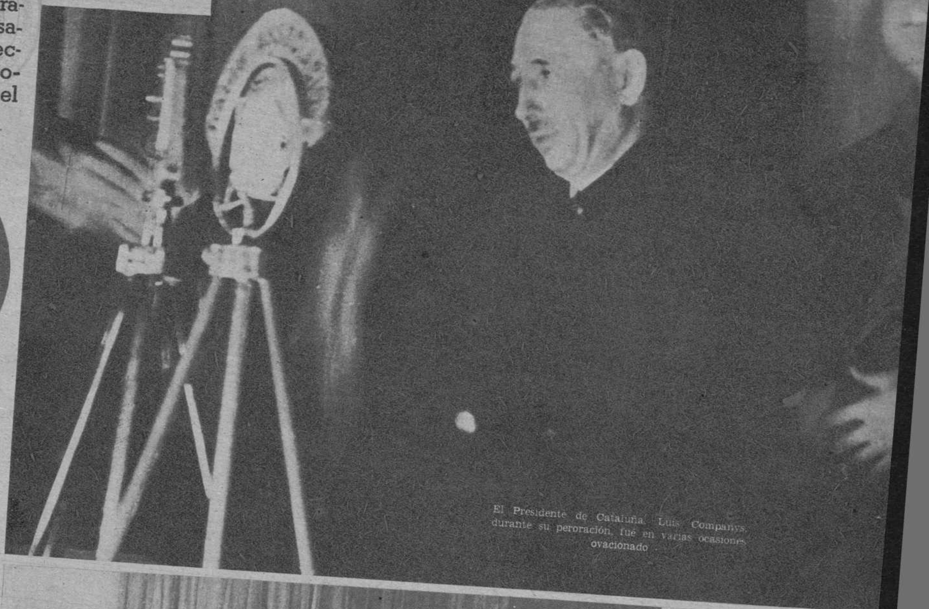
El Presidente de Cataluña, Lluís Companys, durante su peroración, fue en varias ocasiones ovacionado.