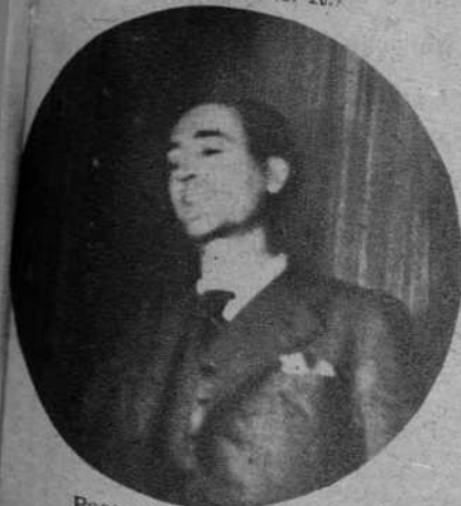
Pascual Leone (U. R.)