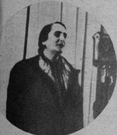
Dolores Ibarruri (Partido Comunista)