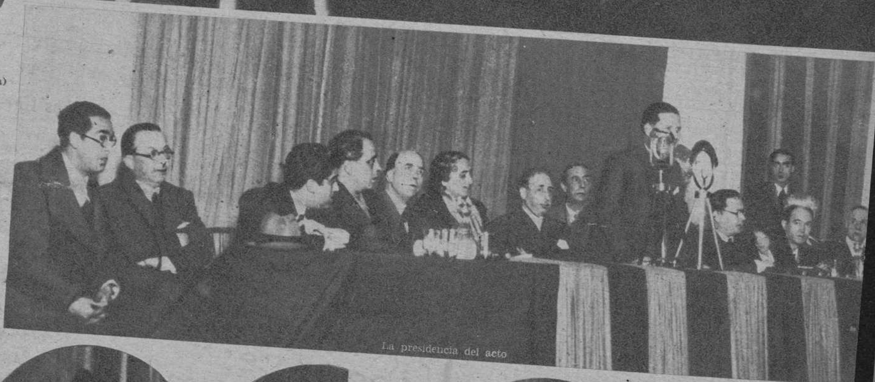
La presidencia del acto