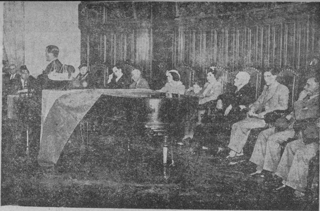
LA SOLIDARIDAD DE LA REPUBLICA URUGUAYA CON LA ESPAÑOLA

La presidencia de la reunión pro España republicana celebrada en el Ateneo de Montevideo