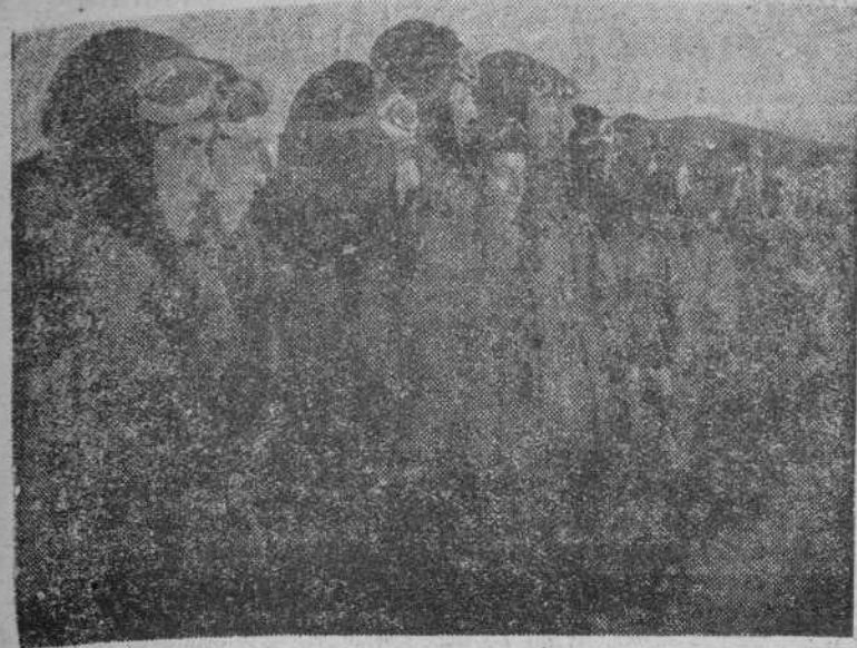
LA CONQUISTA DE TERUEL

Asiadores republicanos que tan brillantemente han participado en las operaciones que han dado por resultado la victoria del Ejército de la República