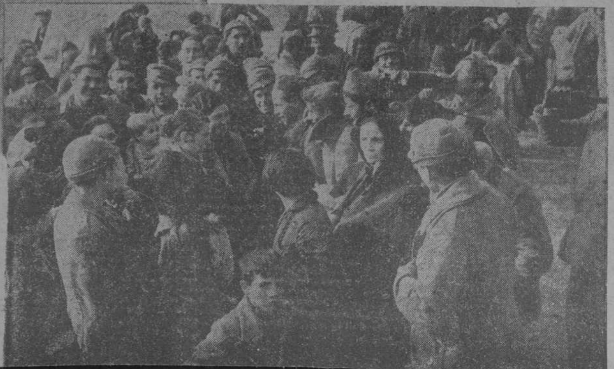
La población civil, conversando con los soldados de la República