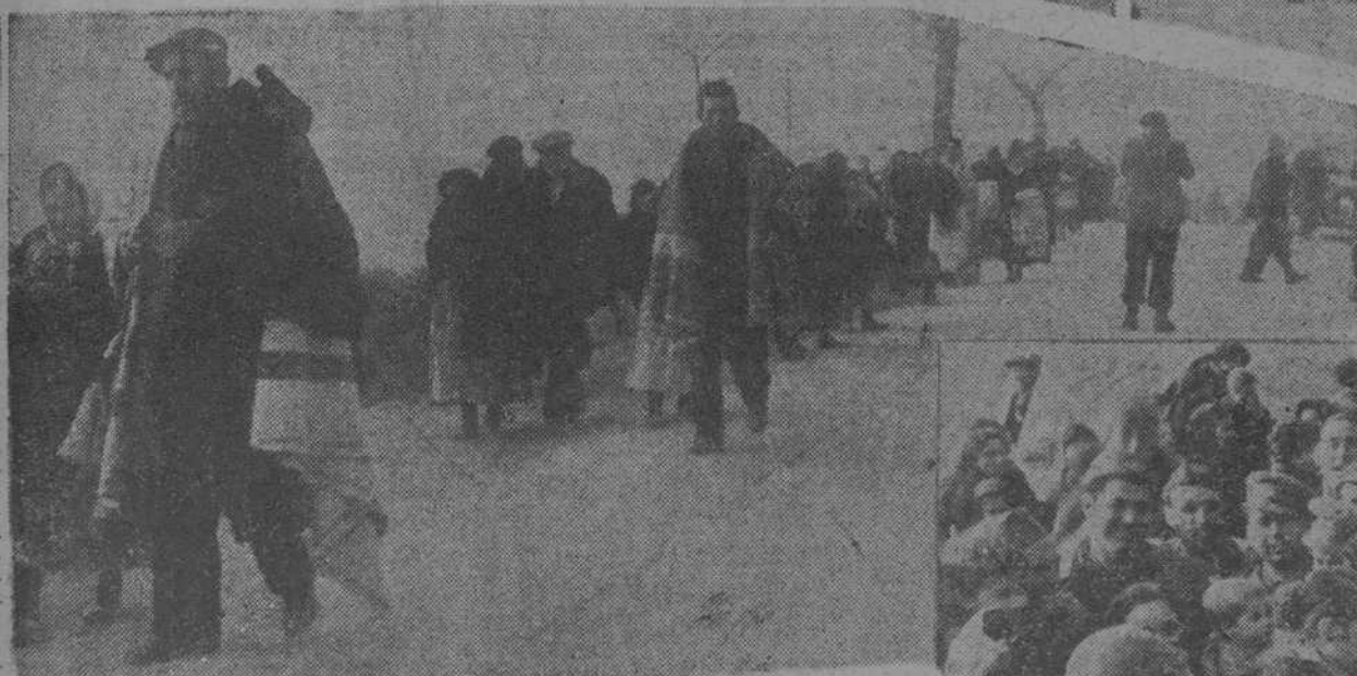
Una escena de la evacuación