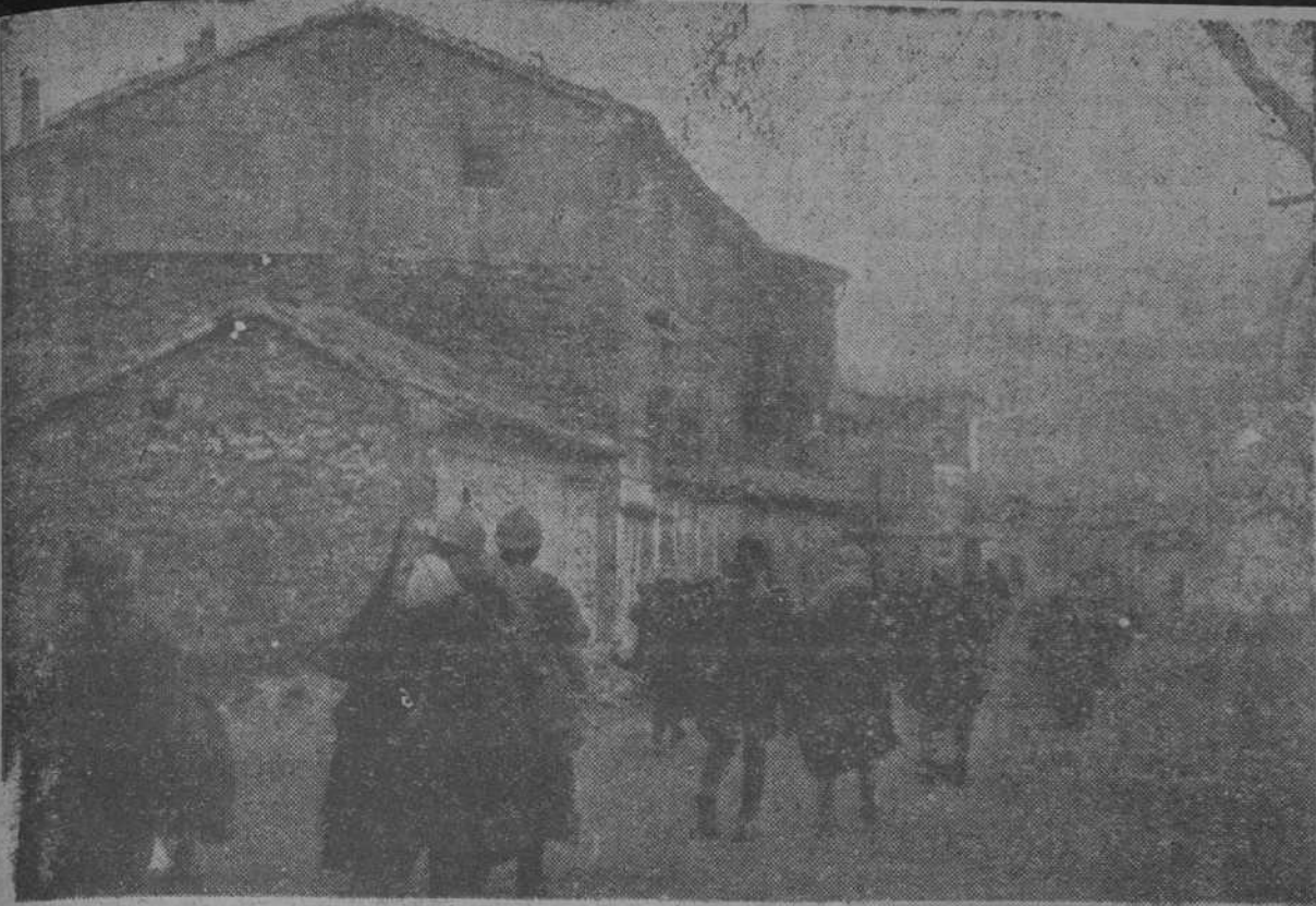
Soldados de la República, recorriendo las calles