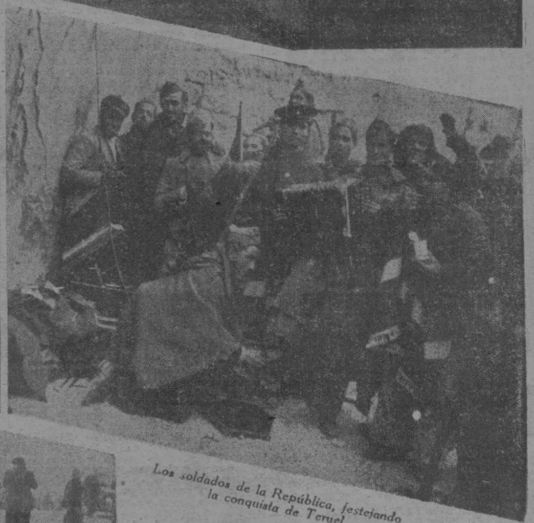
Los soldados de la República, festejando la conquista de Teruel