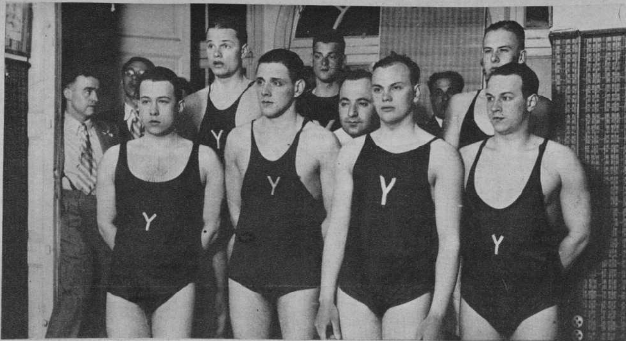
Los nadadores del equipo holandés 'Het Y.', de Amsterdam, que han participado en los festivales celebrados el martes y el miércoles en la piscina del C. N. B.