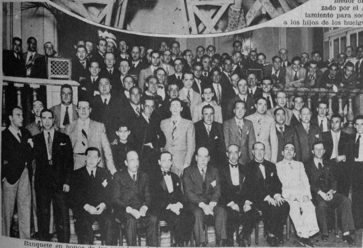
Banquete en honor de los jugadores de los equipos que jugaron en el Estadio de Montjuich la final de los Campeonatos amateur y profesional de fútbol.