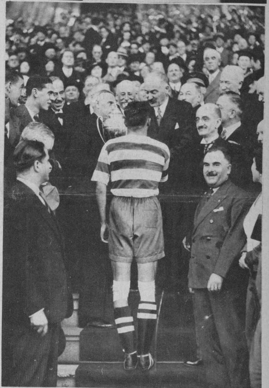
París.—El Presidente de la República, entregando la Copa de Francia al capitán del F. C. Sete, vencedor del Olimpique de Marsella en la final, por dos goals a uno.