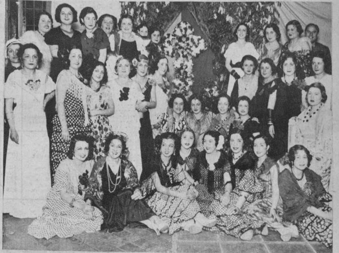
El baile de «La Cruz de Mayo», celebrado en el Centro Andaluz para festejar el IV aniversario de su fundación.