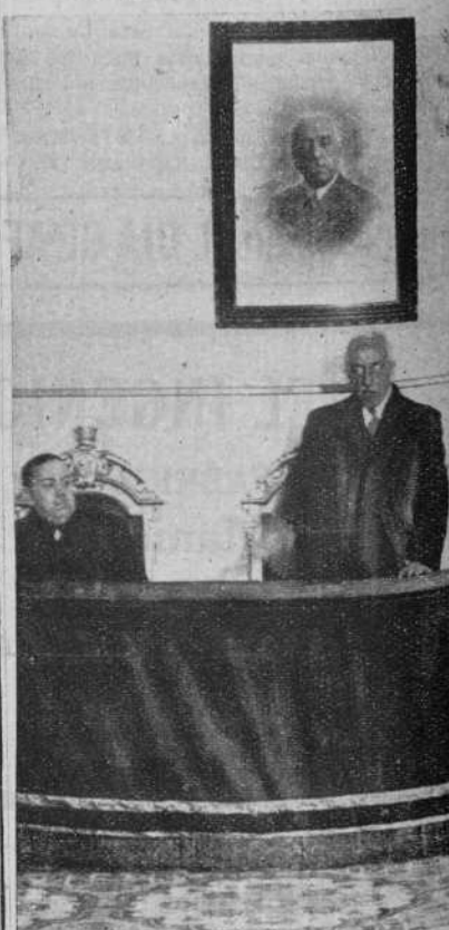
El Presidente de la República, presidiendo el acto en que han sido declarados inaugurados oficialmente los nuevos Grupos Escolares