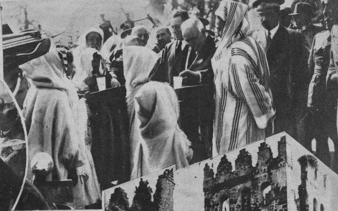
Bat-Tarzam.—Niñas del poblado moro, haciendo ofrenda de leche y dátiles al Presidente de la República