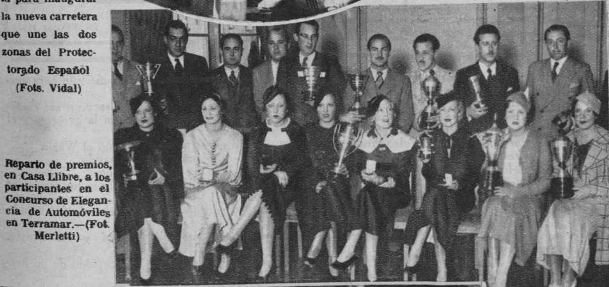
Reparto de premios, en Casa Libre, a los participantes en el Concurso de Elegancia de Automóviles en Terramar.