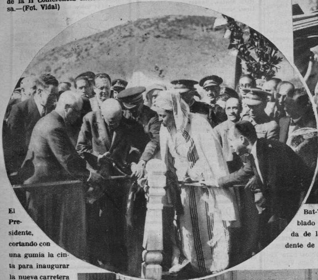
El Presidente, cortando con una guma la cinta para inaugurar la nueva carretera que une las dos zonas del Protectorado Español