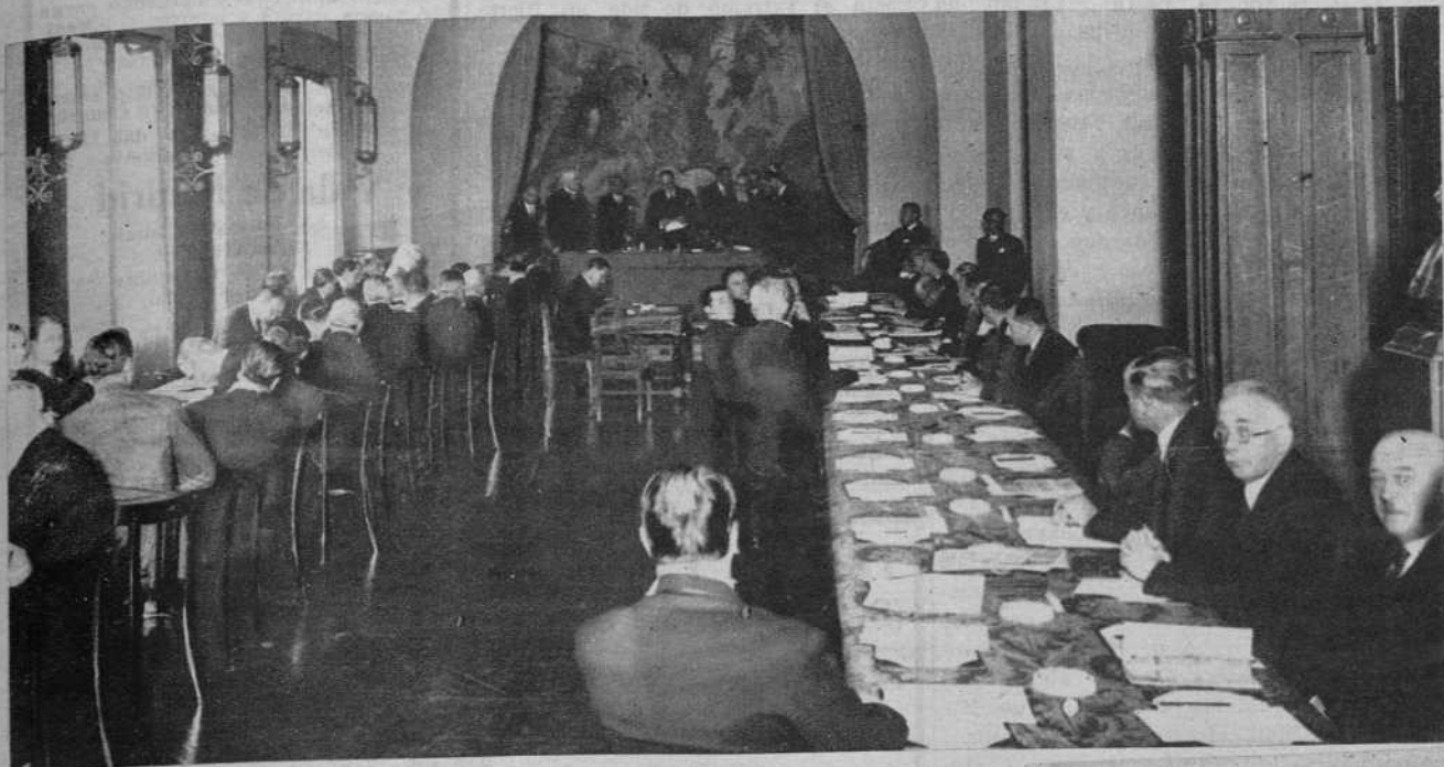
Madrid.—El salón de la Asociación de la Prensa, en la sesión inaugural de la II Conferencia Internacional de Oficinas Gubernamentales de Prensa.