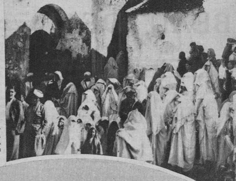
Xauen.—Mujeres y niñas, moras, esperando, frente a la Alcazaba, la llegada del Presidente de la República