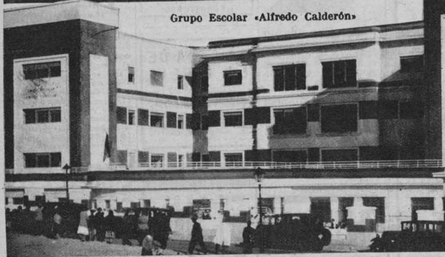
Grupo Escolar «Alfredo Calderón»