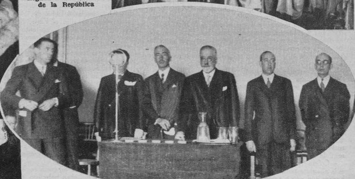
Presidencia del mitin de la Unión Nacional de Derechas, en el Salon Victoria.