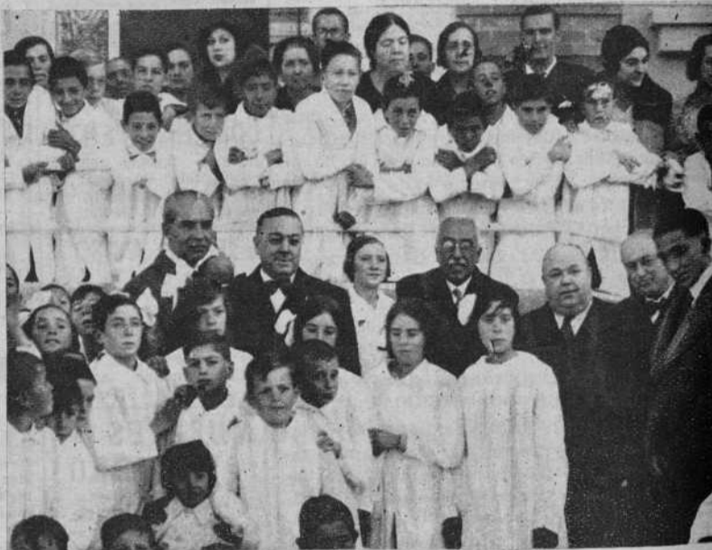
El Presidente de la República, con el jefe del Gobierno, ministros de Instrucción Pública y de la Gobernación y alcalde de Madrid, rodeados de niños concurrentes al Grupo Escolar «Nicolás Salmerón»