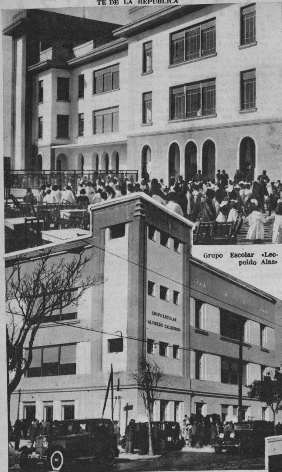
Grupo Escolar «Leopoldo Alas»

GRUPOS ESCOLARES DE MADRID, INAUGURADOS POR EL PRESIDENTE DE LA REPUBLICA