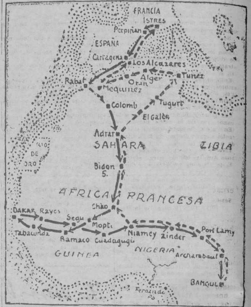
Gráfico del itinerario que emprende una escuadrilla de aviones del Ejército francés en Africa, bajo la dirección del general Vuillemin. El itinerario será cubierto en 33 etapas, de 700 a 900 kilómetros. La escuadrilla arrancará en Istres, tocará en Cartagena y continuará por el Africa occidental francesa y Nigeria hasta Bangui, zona ecuatorial, desde donde regresará por la misma línea hasta Advar, para llegar a Túnez, Algeria y Orán, bajar a Mequinez, subir a Los Alcázares y continuar a Istres.