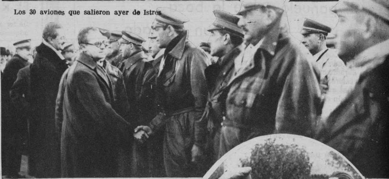
El ministro del Aire, M. Pierre Cot, pasando revista a los aviadores