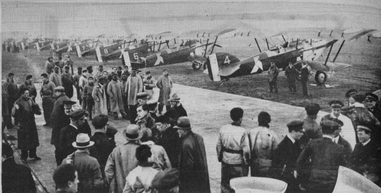
Los 30 aviones que salieron ayer de Istros

Ayer mañana salió de Istres para Perpignan, primera etapa del vuelo al Africa, la escuadrilla mandada por el general Vinlermin. Uno de los aviones.