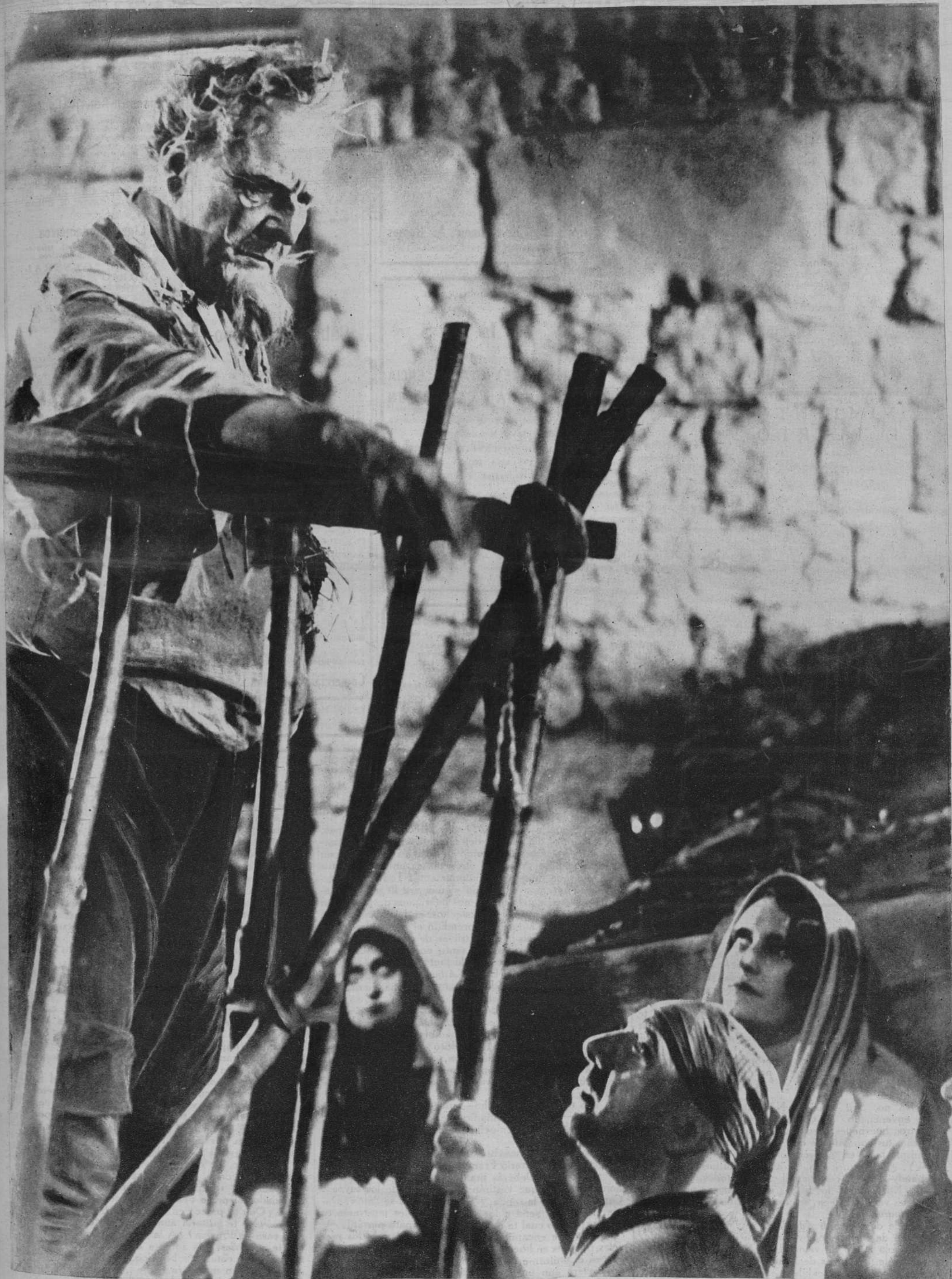
El Gran cantante ruso Chaliapine, intérprete genial del film «Don Quijote», obra cumbre de G. W. Pabst, con la que Exclusivas Febrer y Blay consiguieron anoche un triunfo definitivo y rotundo para su marca