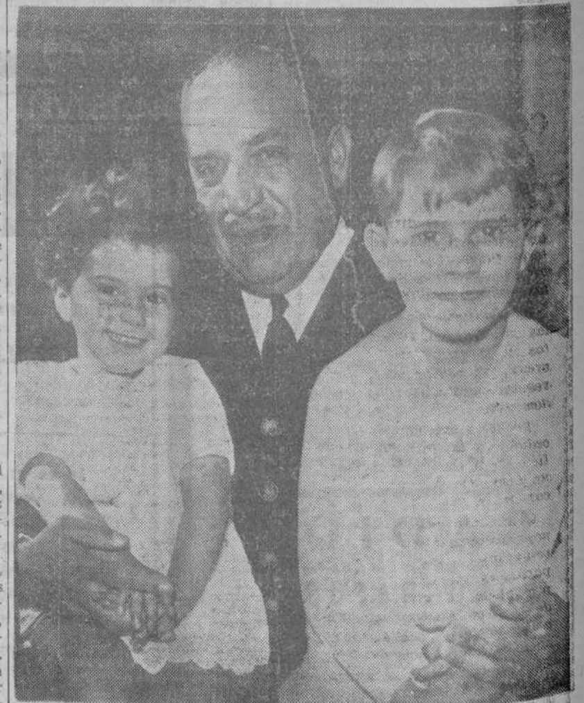
El general Vuillemin se despide de sus hijos al ir a iniciar el raid aéreo al Continente Africano