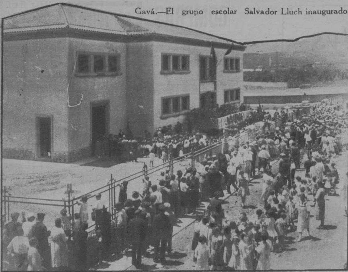
Gavá.—El grupo escolar Salvador Lluich inaugurado ayer