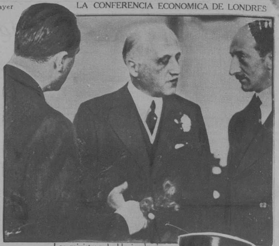
Los ministros de Hacienda de Italia y de Francia señor Guido Yung (en el centro) y M. Bonet, respectivamente.