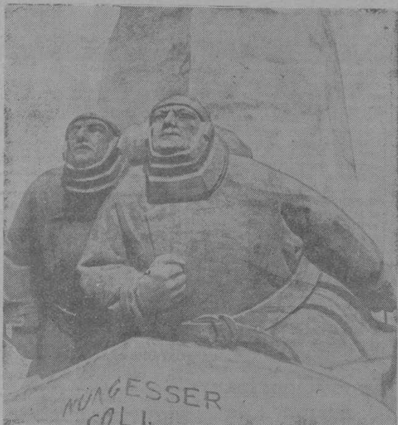
LAS FIGURAS DE NUNGESSER Y COLI, SIMBOLICA ESTILIZACION DE SU VUELO HACIA LA ETERNIDAD

Después, a los pocos días, ocurre el milagro de Lindberg. Quien esto escribe, lo vio llegar al Bourget. Esperaba una muchedumbre enorme. Los oficiales aviadores franceses oteaban el horizonte. «No llegará»—decían. El recuerdo de la catástrofe de Nungesser y Coli les volvía