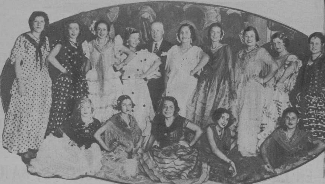
Sevilla.—Grupo de alumnos de la Escuela francesa que participaron en el festival organizado con motivo del reparto de premios.