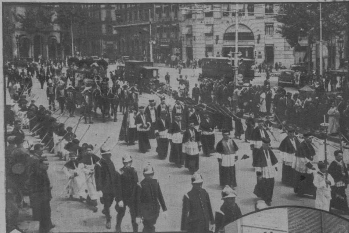
El entierro del cadáver del Marqués de Marianao

Aquellas campañas del Marqués en favor de la independencia de Cuba, merecen ahora ser recordadas y enaltecidas.