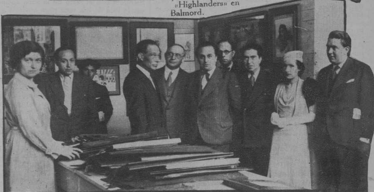
El Alcalde y el señor Gasol junto con el célebre escultor Clará en la marquesina de la II Feria del Dibujo.