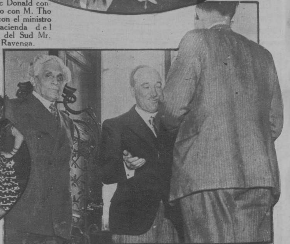
El ministro de Negocios Extranjeros de Checoslovaquia señor Beñes y el ministro de Negocios Extranjeros de Francia señor Boncour, conversando con los periodistas.