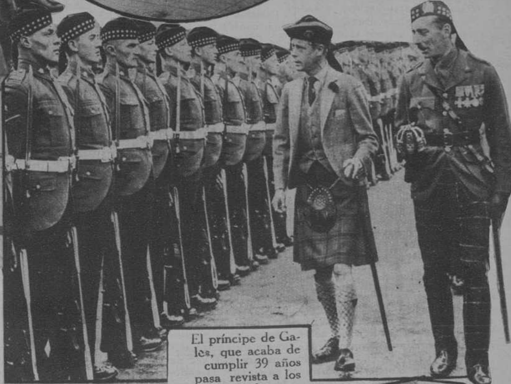
El príncipe de Gales, que acaba de cumplir 39 años pasa revista a los «Highlanders» en Balmord.