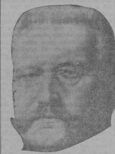
EL PRESIDENTE HINDEMBURG

Breslau, 29.—La Policía ha efectuado registros en los locales de doce organizaciones católicas, habiéndose incautado de numerosos documentos.—Fabra.