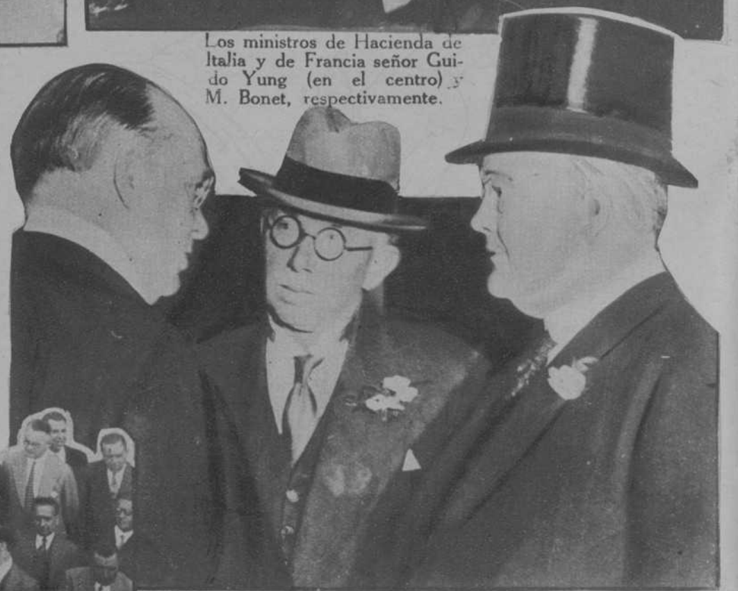
Mr. Bennet, jefe del Gobierno canadiense con el secretario de los Dominios Mr. Thomas (en el centro) y Mr. Hailsham ministro de la Guerra de Inglaterra.