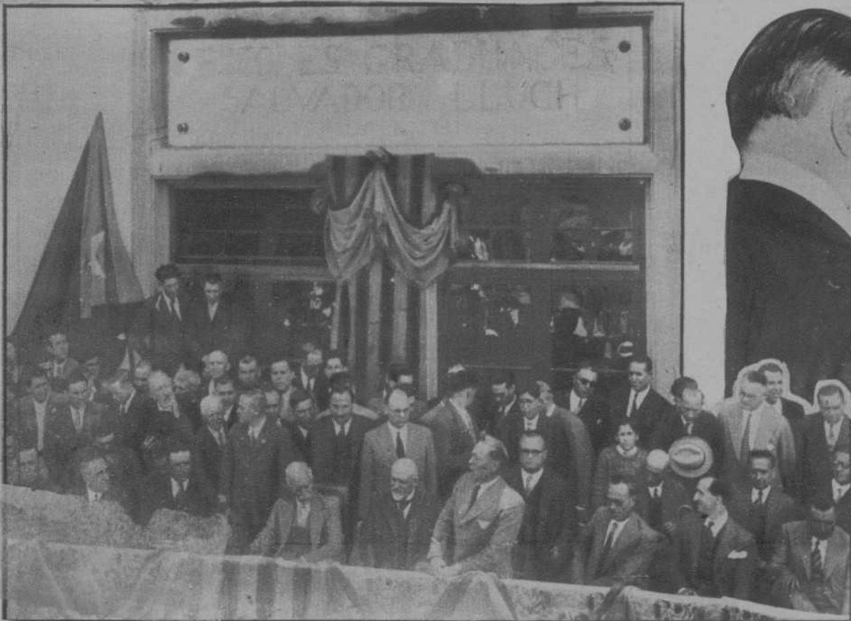
Gavá.—El Presidente de la Generalidad y las autoridades en el acto de inauguración del grupo escolar.