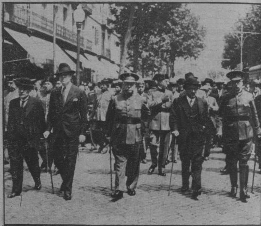
Entierro del guardia civil victima del extraño suceso de Hospitalet, y la presidencia de autoridades