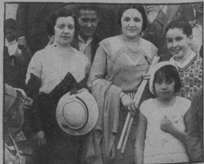
Madrid.—La artista Carmen Díaz, al salir de la ermita de San Isidro.