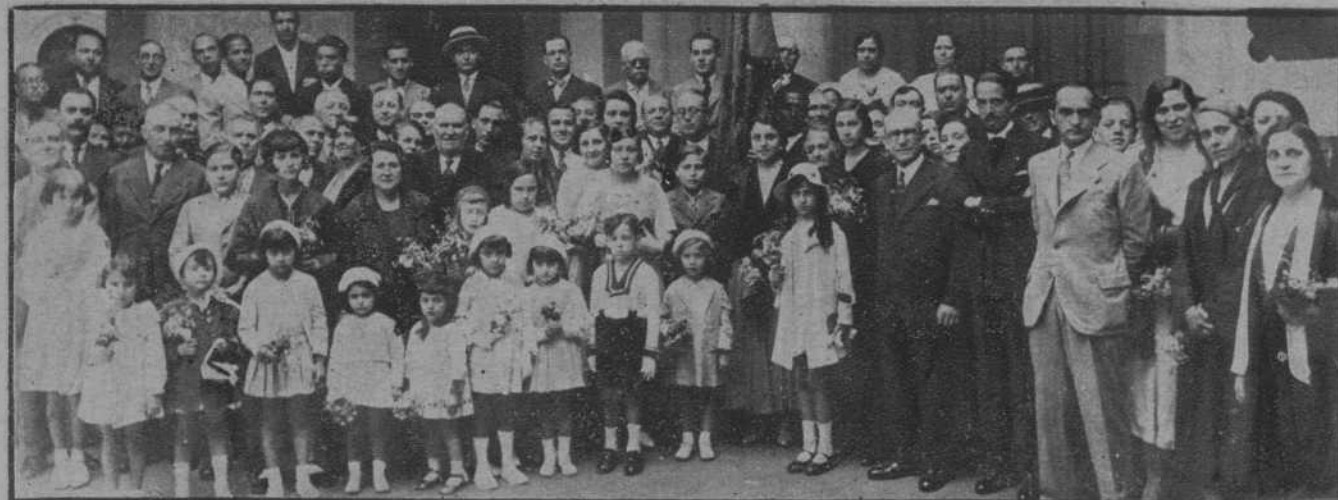
Los panaderos, al salir de la Casa de Caridad, después de celebrar la fiesta de su patrón, San Honorato