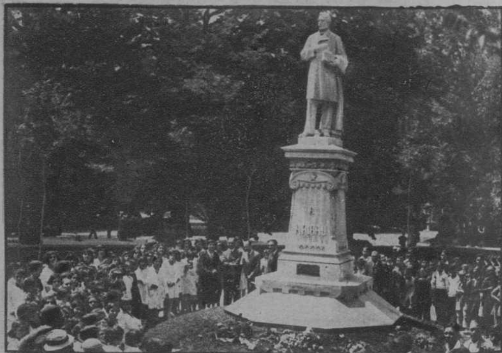
El homenaje a Aribau por los alumnos de las escuelas municipales.