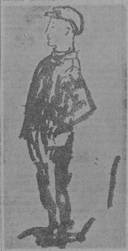
«Apunte de figura», por Manuel Humbert.

Hemos dicho de Manuel Humbert, a propósito de sus últimas manifestaciones, que su obra actual nos ponía en presencia de un artista que después de haber lacerado su sensibilidad con el sentido más tajante y agudo de las emociones, había conseguido llegar a una fórmula expresiva tan apta para traducirlas, que se había establecido, en sus telas, uno de los más felices equilibrios, una de las más perfectas armonías de la pintura catalana moderna. Su Exposición presente afirma aquella constatación. La personalidad del artista ha alcanzado el grado necesario de estabilidad para dar a una producción numerosa una íntima tónica general, y para sostener esta interior singularidad de concepto a través de una extensa variedad de temas: figura, paisaje, desnudo, natura muerta, etc.