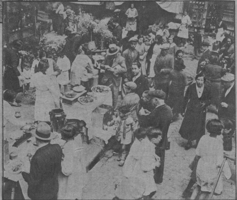
Puestos de venta de miel en la calle del Hospital, con motivo de la fiesta de San Pons.