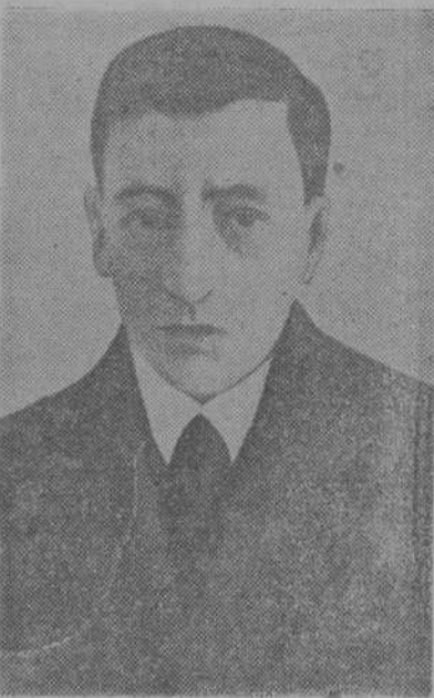
El Presidente de la República de Bolivia, doctor D. Daniel Salamanca.