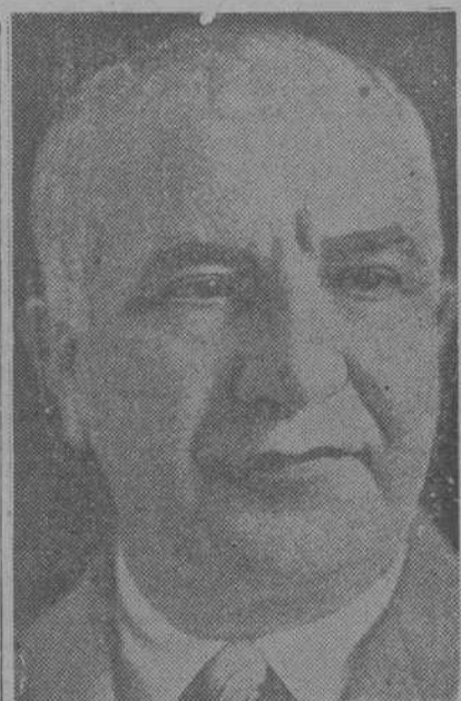
El Presidente de la República de Paraguay, doctor D. Eusebio Ayala.

LO DEL CHACO El conflicto se ha convertido en guerra, oficialmente declarada entre Paraguay y Bolivia