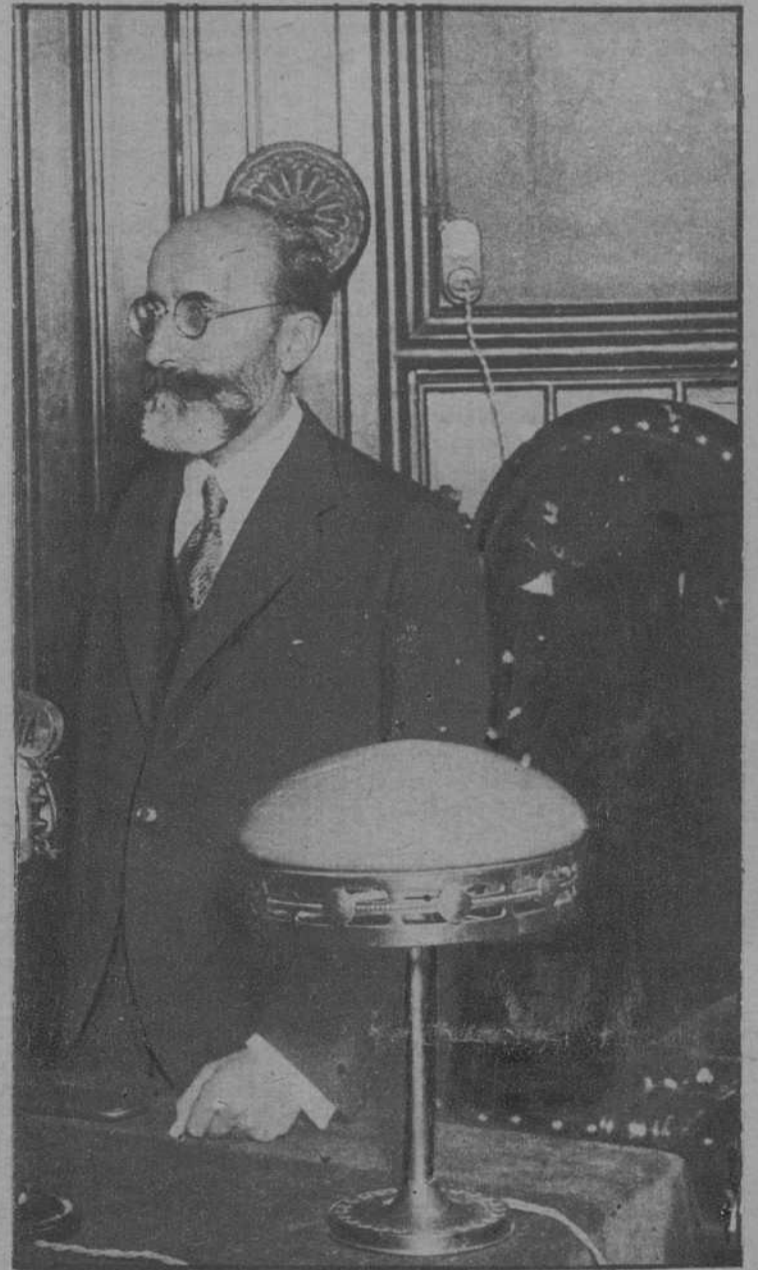
El ilustre Menéndez Pidal, en la Universidad, dando una conferencia.

Cerró el ciclo de conferencias de cultura española organizado por la Facultad de Filosofía y Letras de Barcelona, el ilustre don Ramón Menéndez Pidal, que en los salones del Rectorado habló de las concomitancias y puntos de contacto entre la poesía popular española y las baladas de otros países, trazando una paralela entre las diversas composiciones populares españolas con otras francesas y alemanas, siendo su magnífica conferencia una bella lección que supo a poco a cuantos le escucharon