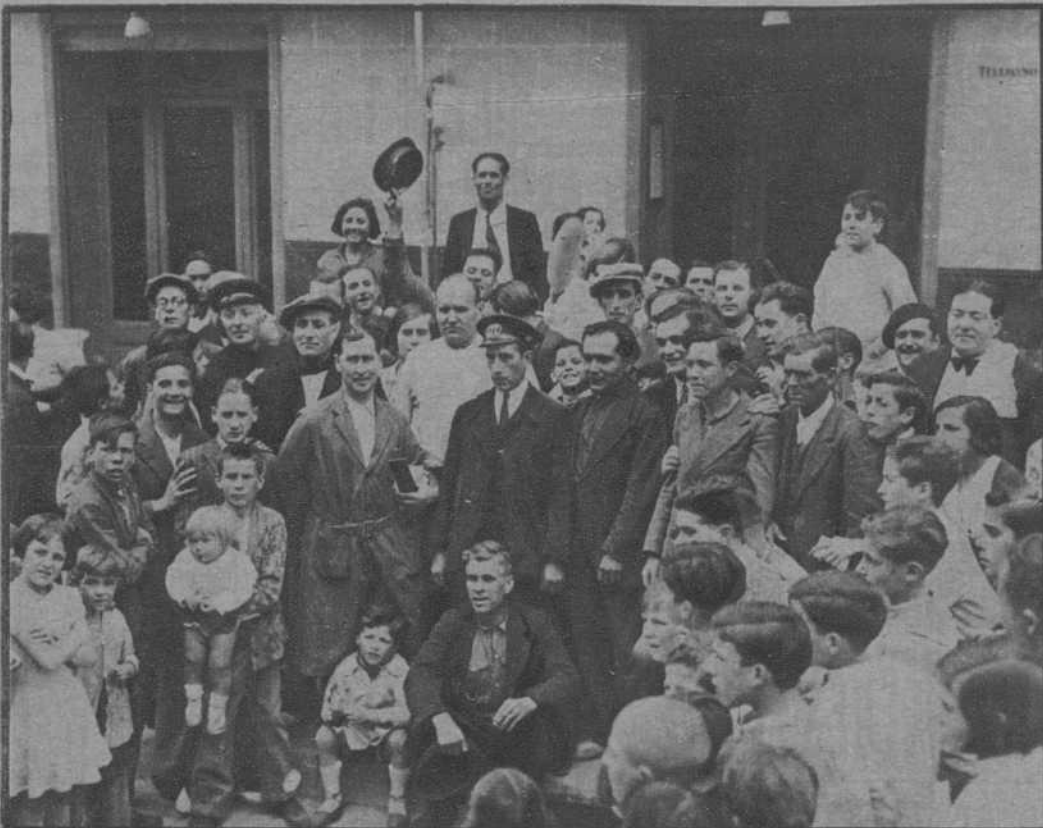
Los favorecidos con el gordo de la Lotería de la Ciudad Universitaria.—(Fot. Badosa)