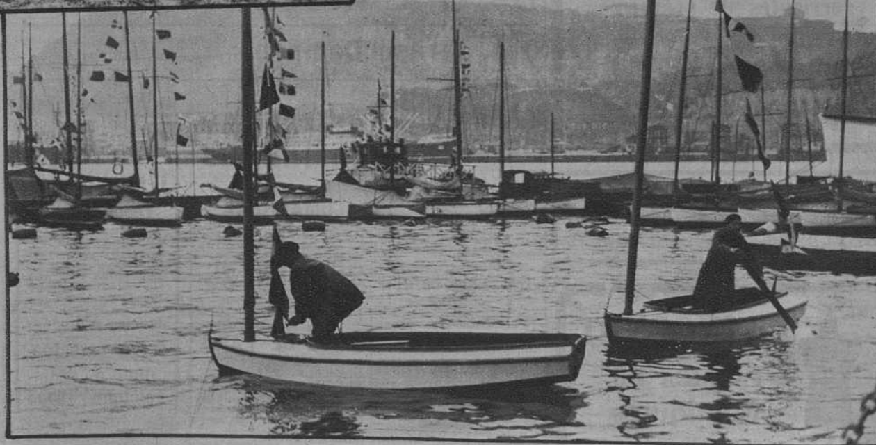
Los nuevos balandros construidos por socios del C. M.