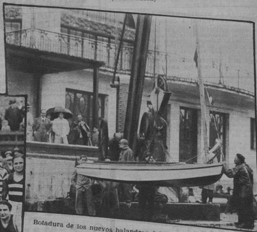
Botadura de los nuevos balandros del C. Marítimo.