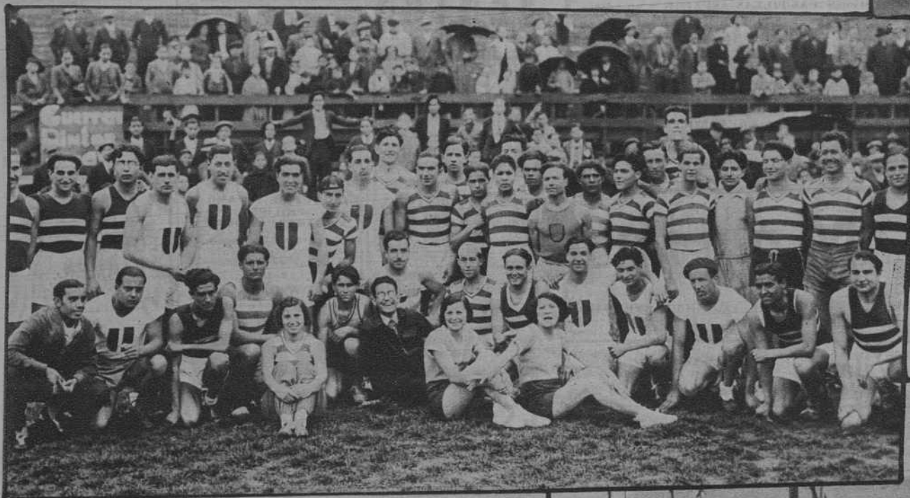
Atletas que participaron en el festival en honor del entrenador del Júpiter, señor Agulló.