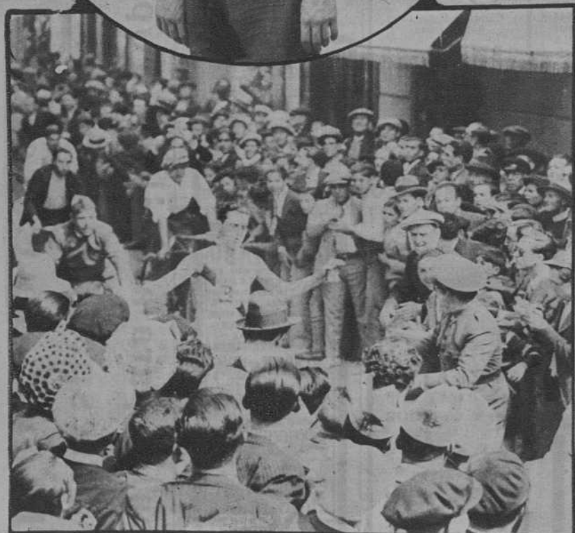
El vencedor de la III Vuelta a Castellón, al llegar a la meta