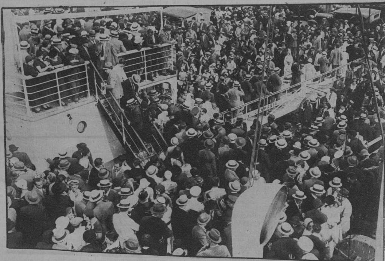
El embarco y despedida de los excursionistas argentinos que viajan a bordo del «Cabo Santo Tomás».