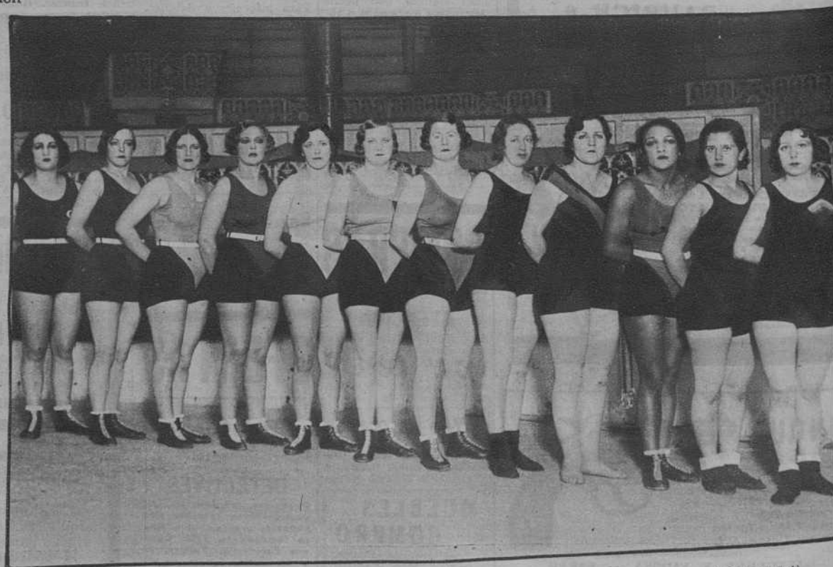
Madrid.—Grupo de participantes en el Campeonato femenino de lucha greco-romana.