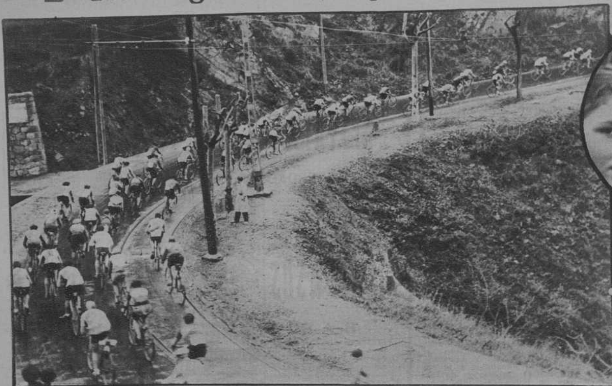
Los participantes en la carrera Trofeo Masferrer, subiendo la Rabassada.