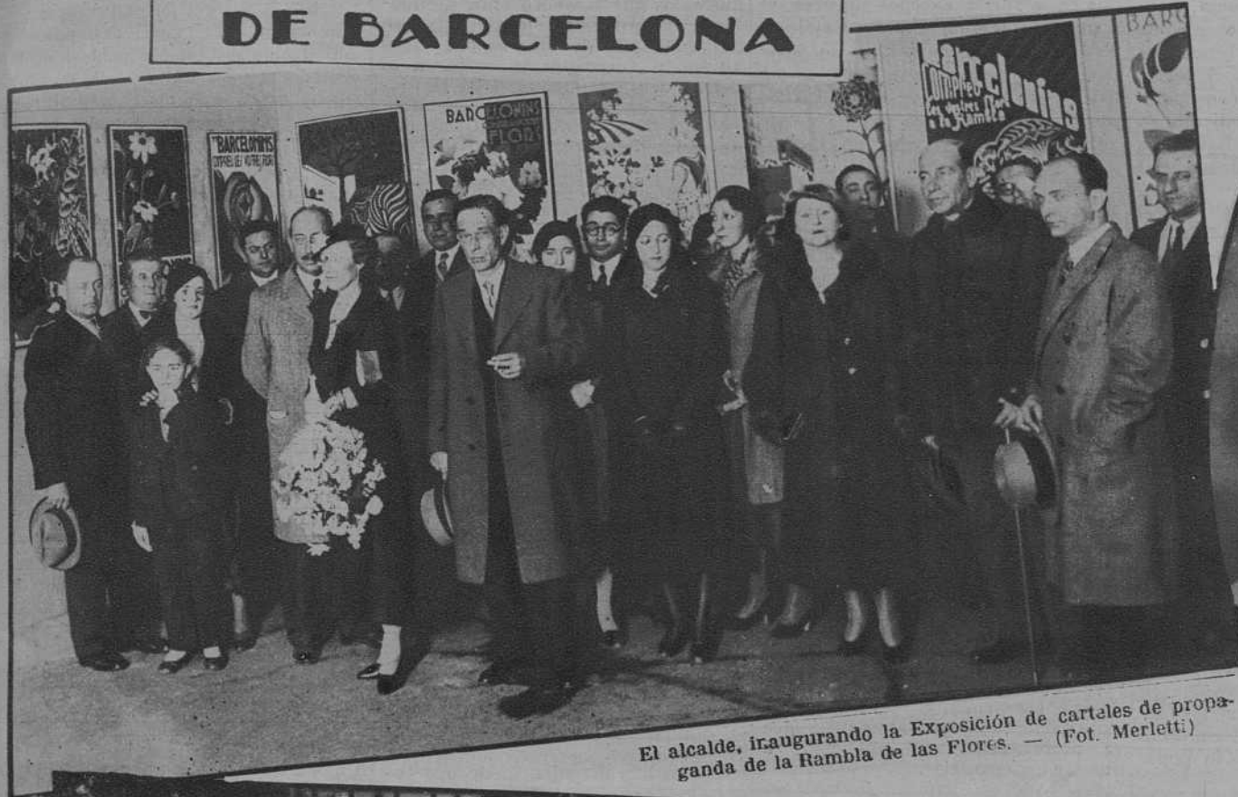
El alcalde, inaugurando la Exposición de carteles de propaganda de la Rambla de las Flores.