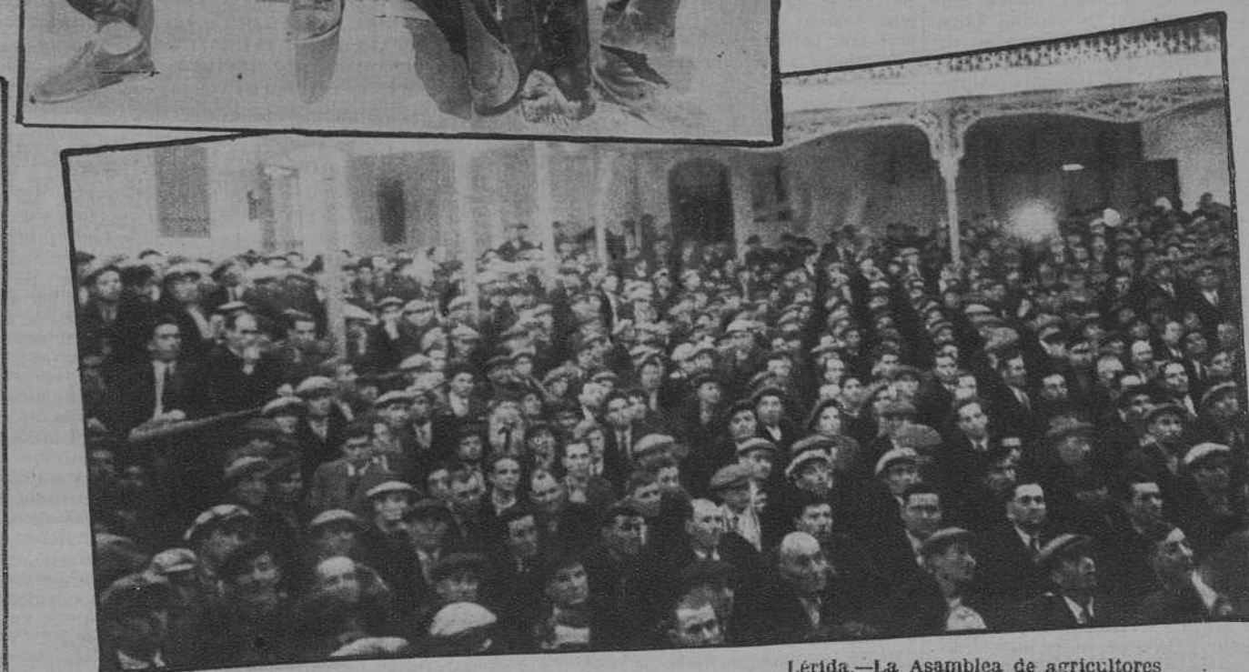
Lérida.—La Asamblea de agricultores