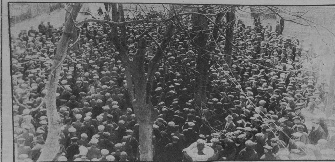
Agricultores, oyendo los discursos por los altavoces colocados al aire libre.