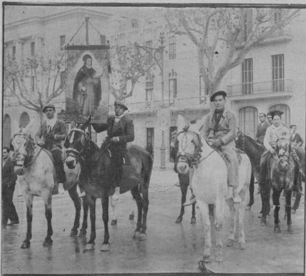
Tarragona.—Grupo de jinetes acompañando el estandarte del Santo, en «los tres toms».