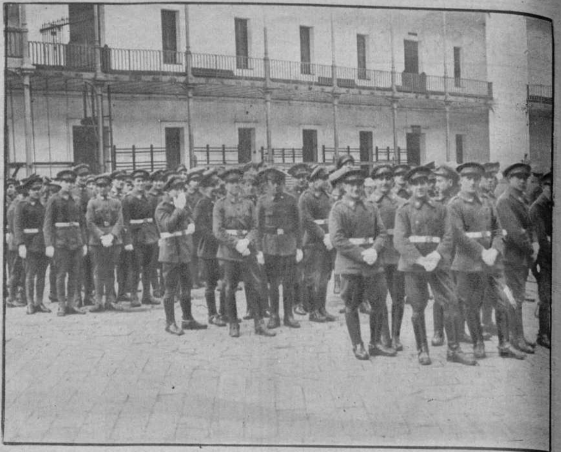
Los licenciados de Intendencia, en el patio del cuartel