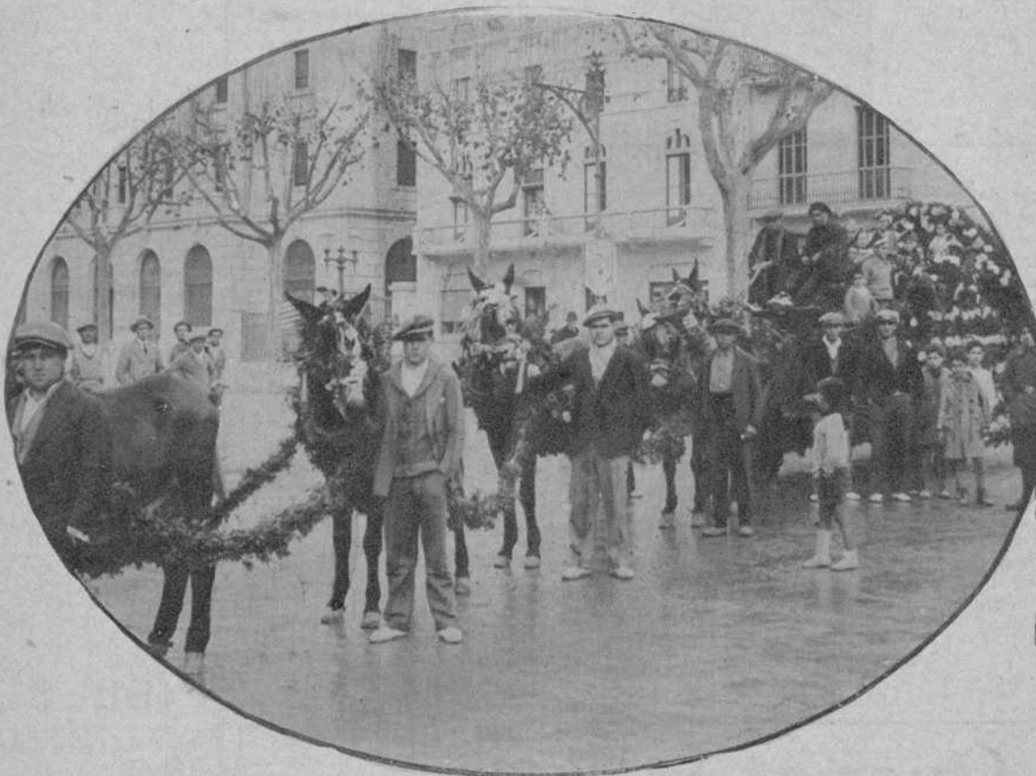
Tarragona.—Una de las carrozas que figuraron en la fiesta de San Antón