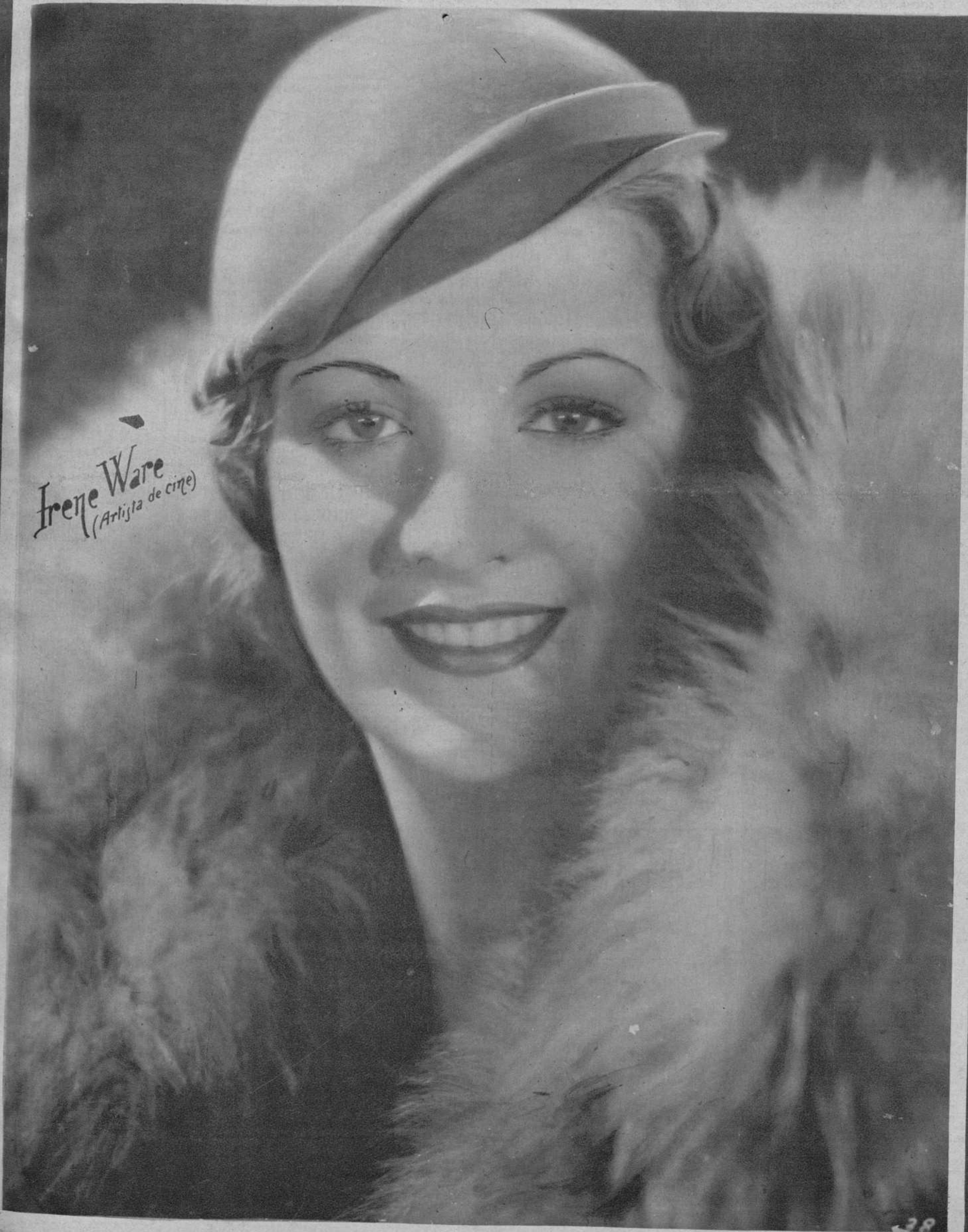
Irene Ware (Artista de cine)