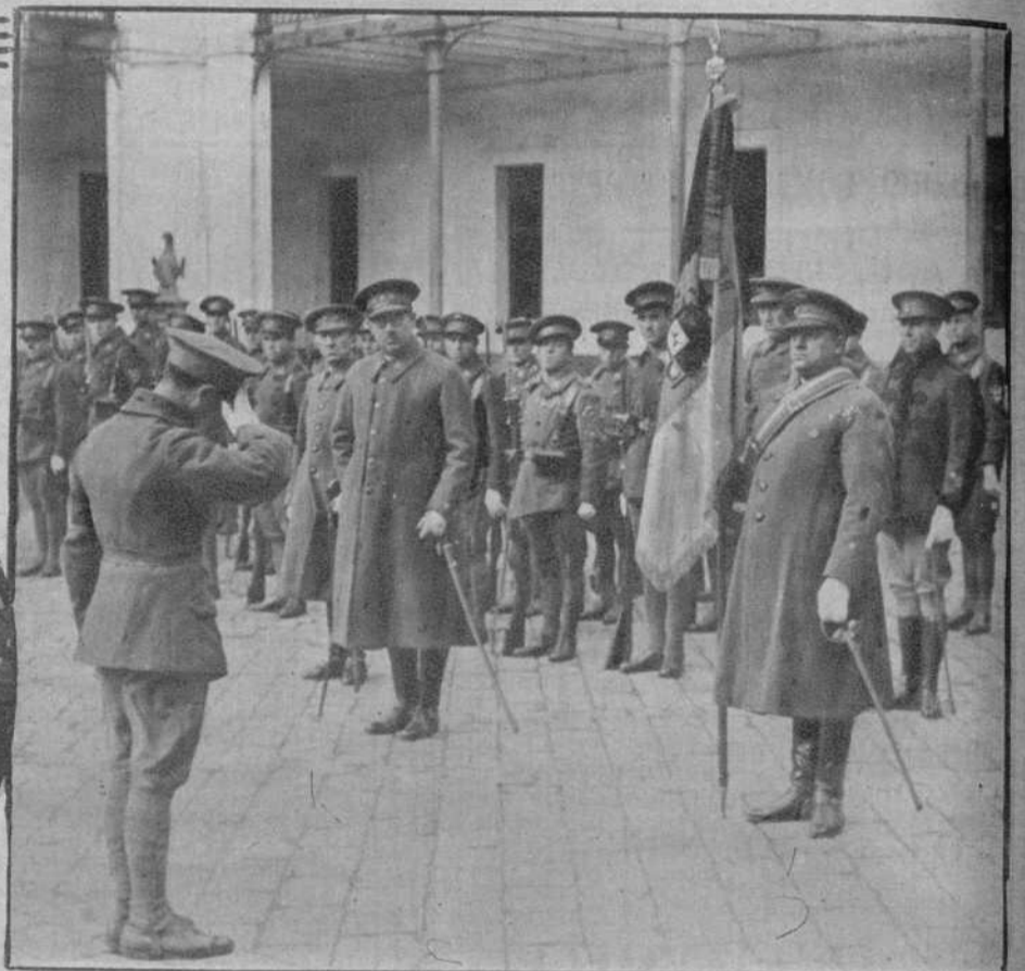
El saludo de despedida a la bandera nacional