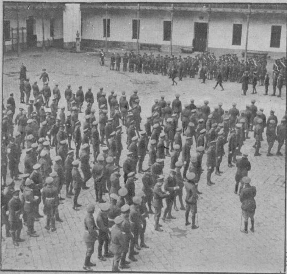
Un aspecto del patio, durante el desfile de los licenciados

LA DESPEDIDA DEL SOLDADO, EN EL CUARTEL DEL PARQUE