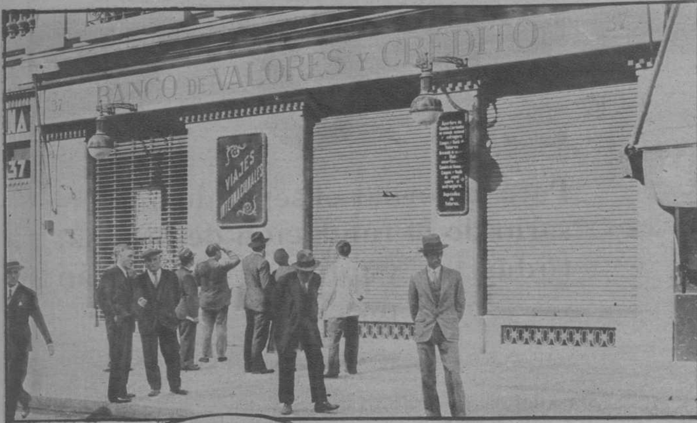
Barcelona.—El Banco de Valores y Crédito, cuyo nombre tanto ha sonado estos días.