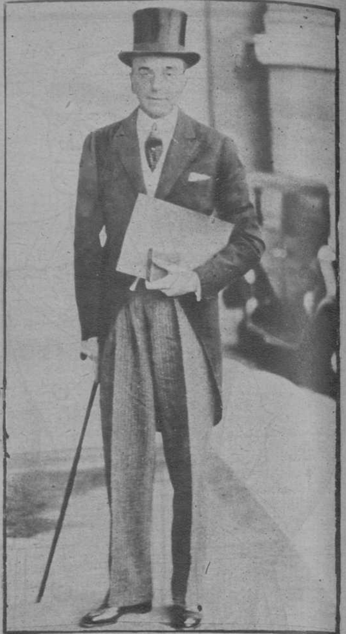
El embajador de Alemania en París, que acaba de entregar a M. Herriot la medalla conmemorativa del centenario de Goethe y un documento firmado por el Presidente Hindenburg.