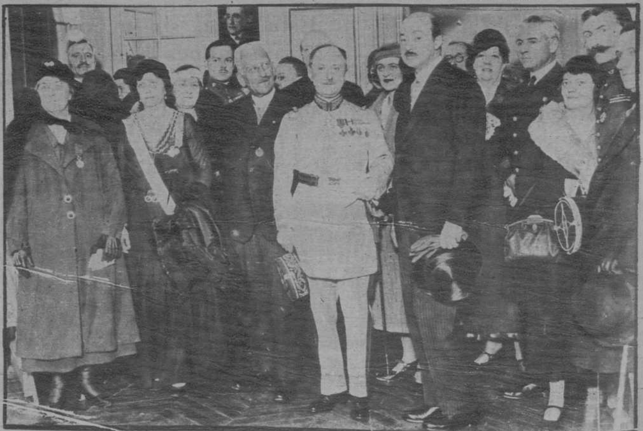
Las hijas de la Revolución americana han entregado a la Villa de París una tabla en la que están insertos los nombres de 133 franceses que murieron por la independencia americana. — La ceremonia de la entrega a la que asistió el general Azan.