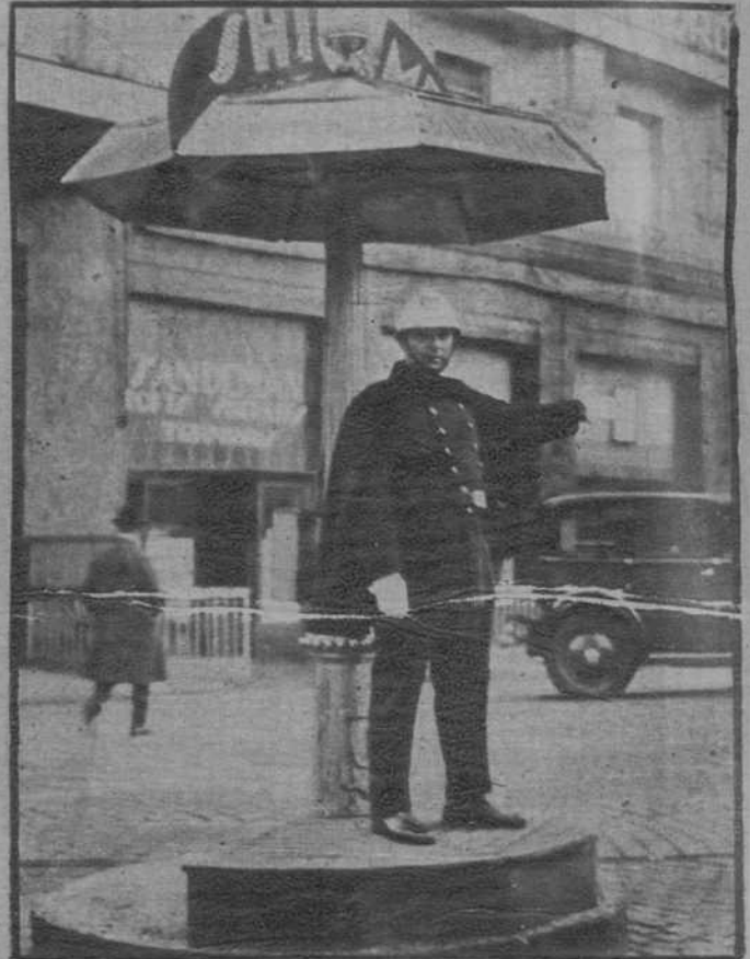
Un agente de circulación, de Bruselas, protegido de las inclemencias del tiempo por una marquesina en forma de paraguas