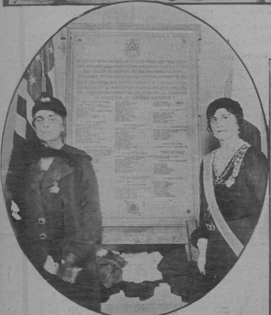
La tabla en la que están inscritos los números de los 133 franceses