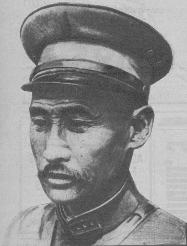
El general chino Ma Chan-Shan, caudillo de las tropas manchurianas, que ha encontrado la muerte en un combate sostenido contra los japoneses, en Ankuchin.