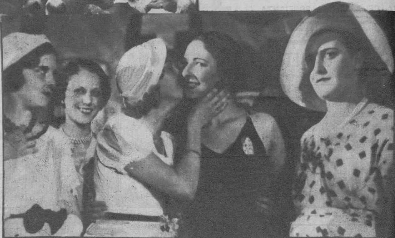
Spa (Bélgica).—«Miss Turquía», elegida «Miss Universo» en el concurso internacional de Belleza, recibe la felicitación de «Miss Dinamarca», que obtuvo la representación de Europa.