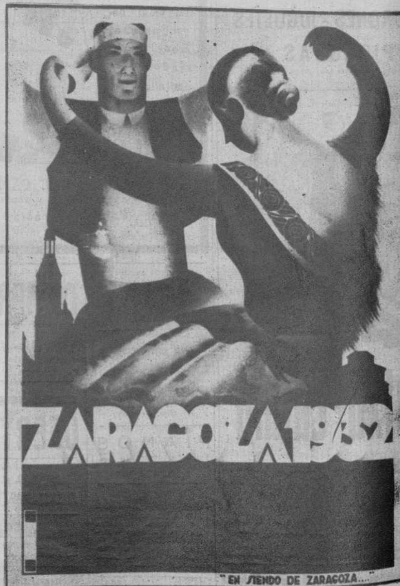
Zaragoza.—El concurso de carteles anunciadores de las próximas Fiestas del Pilar. Original presentado por el artista barcelonés Martínez Surroca, que ha obtenido el primer premio.