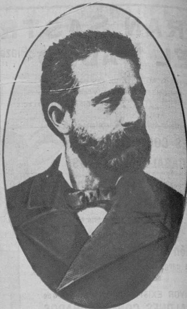
El poeta español Núñez de Arce, el centenario de cuyo nacimiento cumplióse ayer.