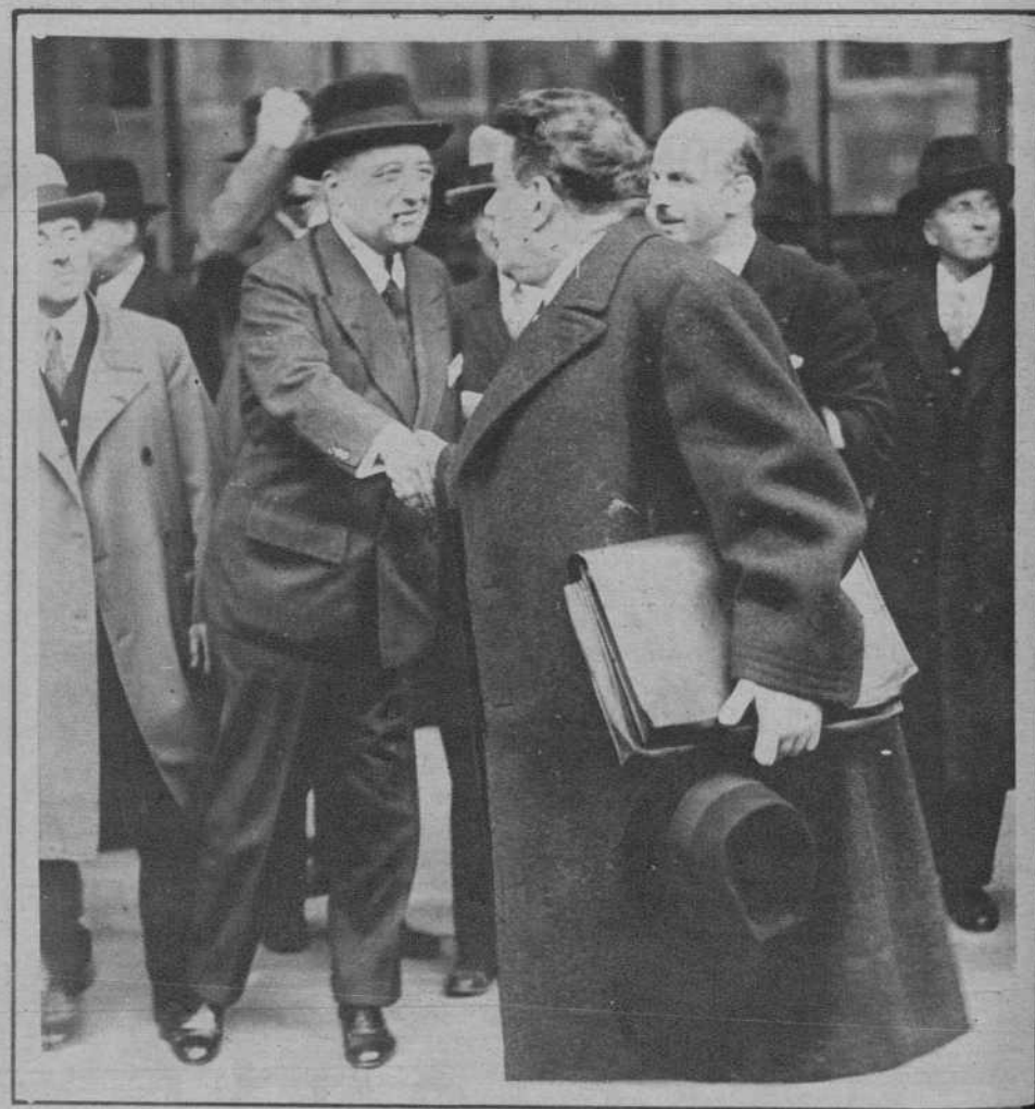
Paris.—Los señores Tardieu y Herriot, despidiéndose a la puerta del Eliseo, después de la entrevista que celebraron en la residencia presidencial, en presencia del señor Lebrún.