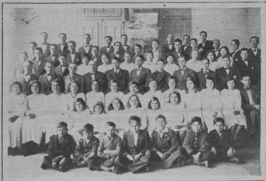
Lérida.—El «Orfeo Balaguerí», que ha dado un interesante concierto en el Teatro de los Campos Eliseos