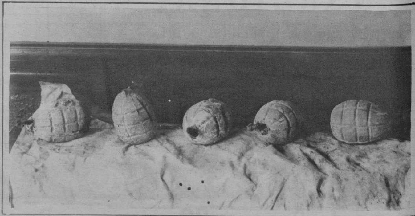
Las cinco bombas abandonadas ayer, de madrugada, en la calle de Cortes, junto a los cuarteles en construcción, por unos individuos a quienes la policía dió el alto, huyendo aquéllos sin poder ser habidos, después de cruzar varios disparos con la fuerza pública.