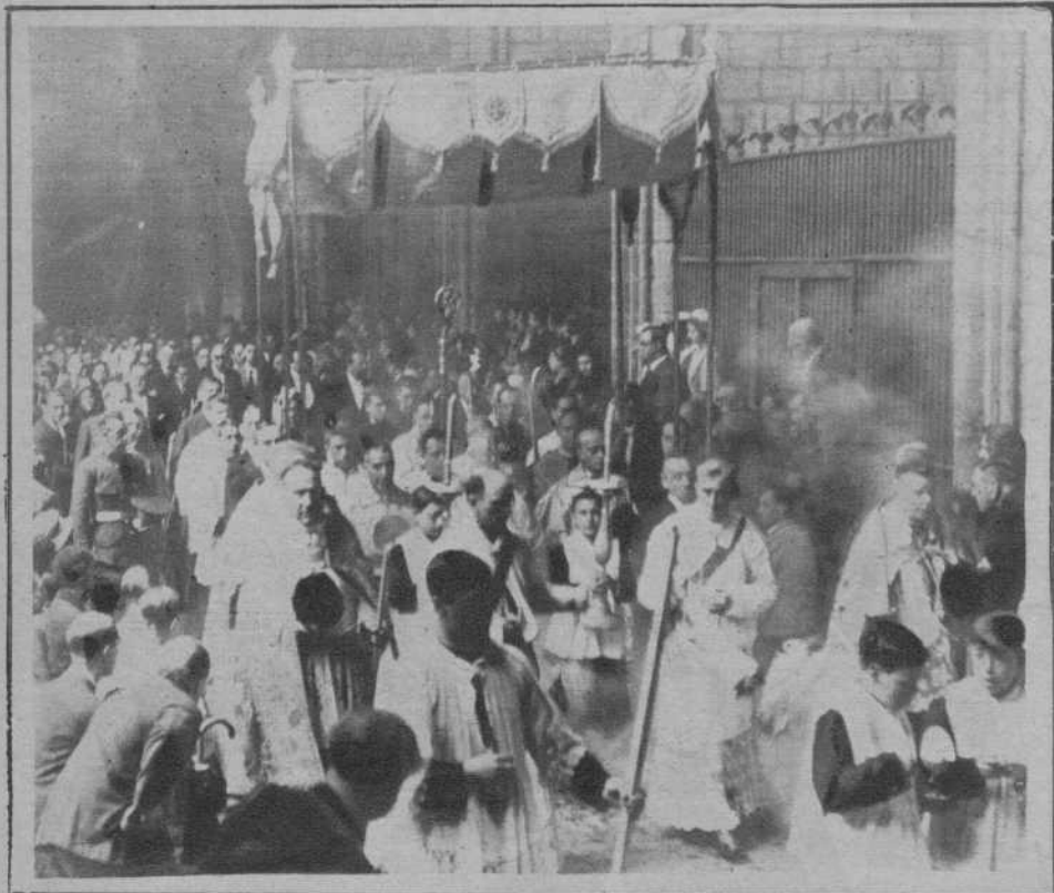
De la festividad del Corpus.—Paso de la procesión por los claustros de la Catedral