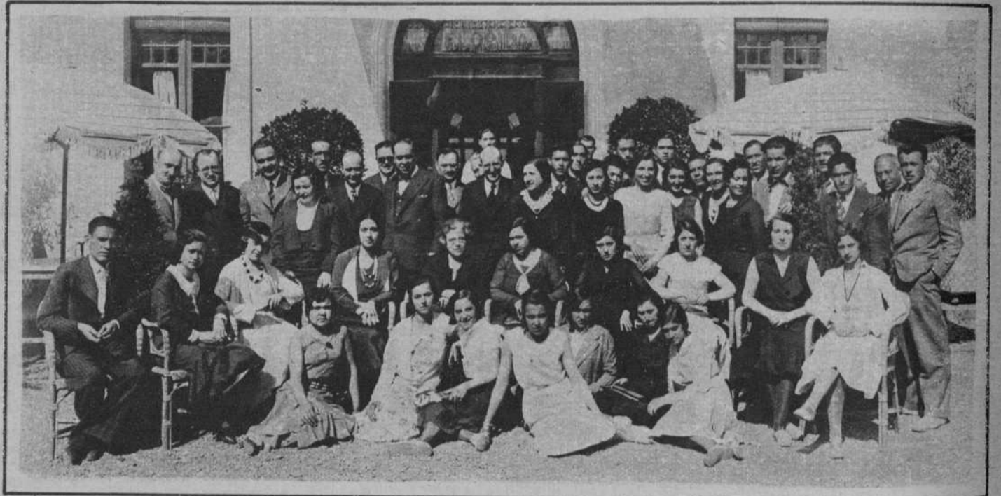
Concurrentes al banquete con que fueron obsequiados en el hotel Florida, del Tibidabo, por la Comisión de Cultura del Ayuntamiento, los alumnos de las Escuelas Normales de Guadalajara, que están en nuestra ciudad, en viaje de estudios.