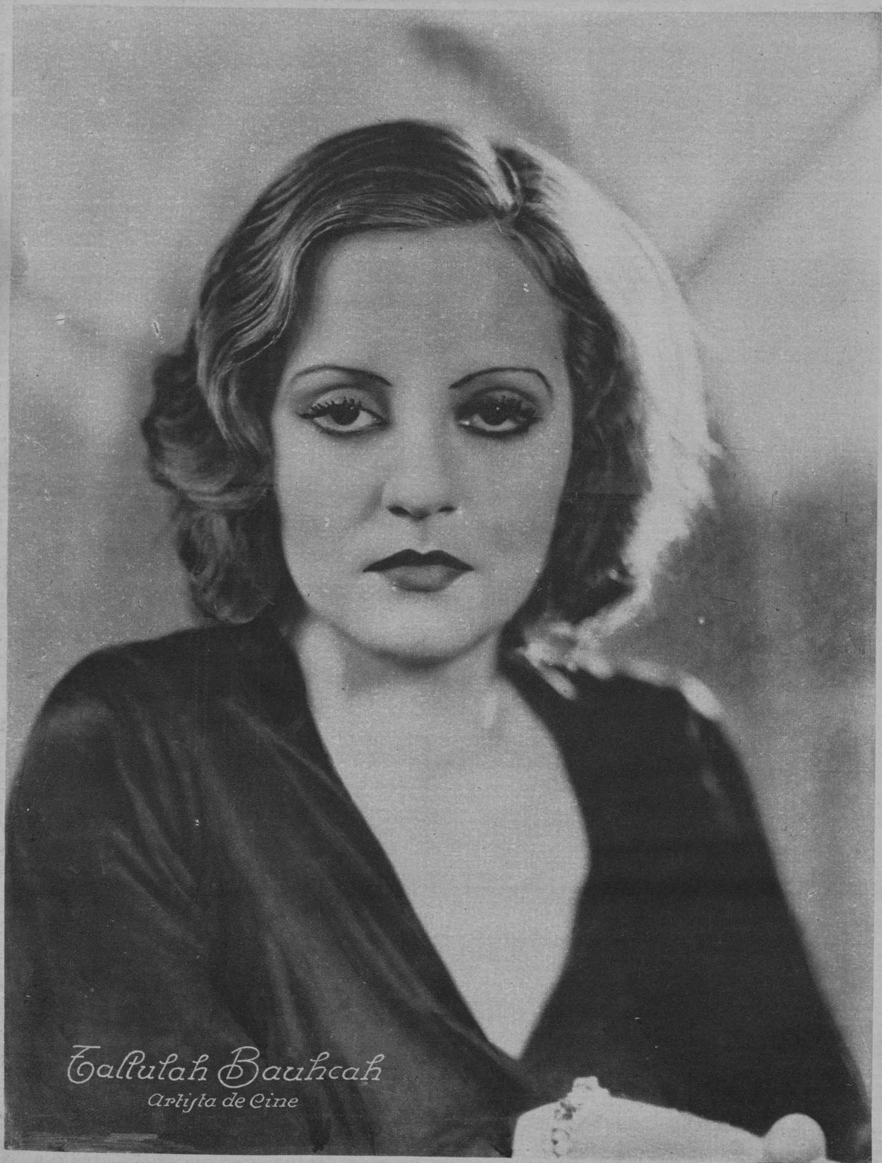
Galulah Bauhcah Artista de Cine