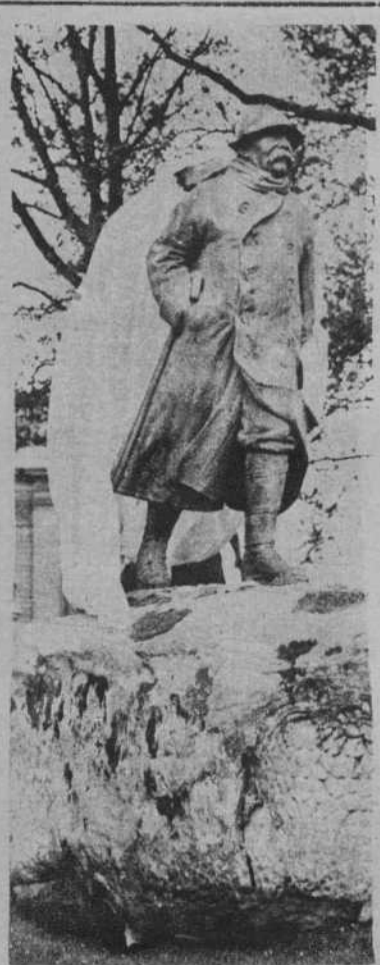
París.—La estatua de Clemenceau, inaugurada en los Campos Eliseos