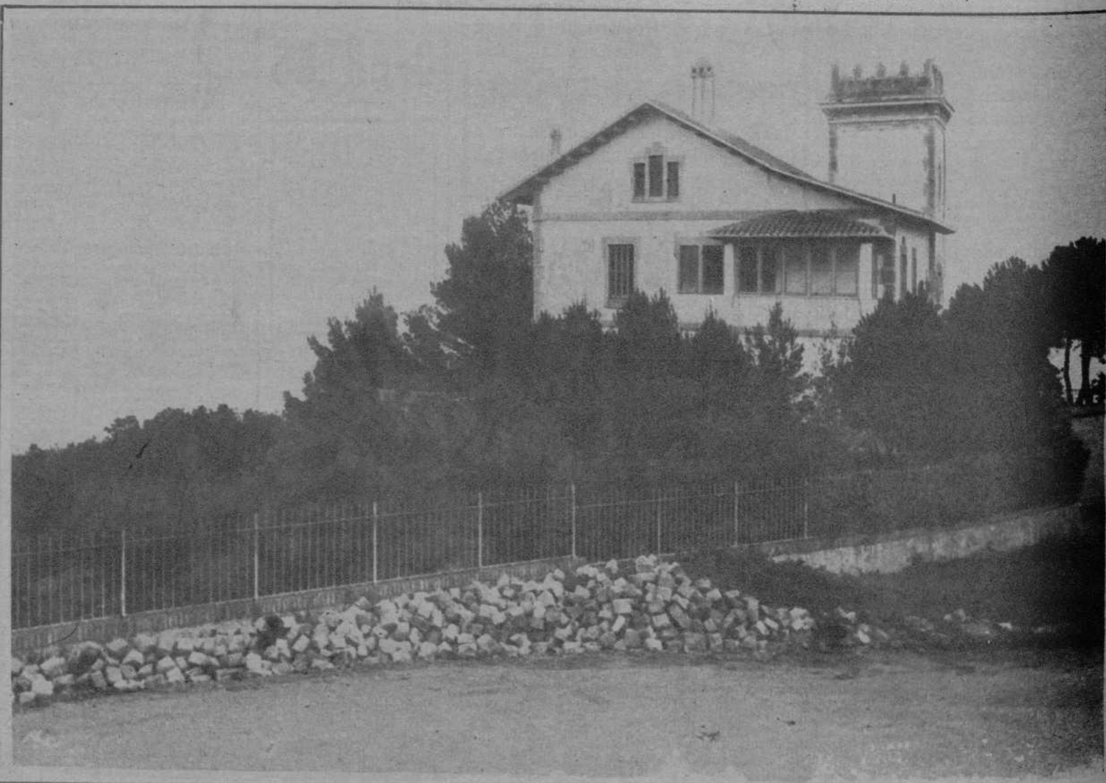
Edificio de la «Mentora Alsina», en el Tibidabo, donde se instalará una Colonia escolar de carácter permanente, capaz para cien escolares