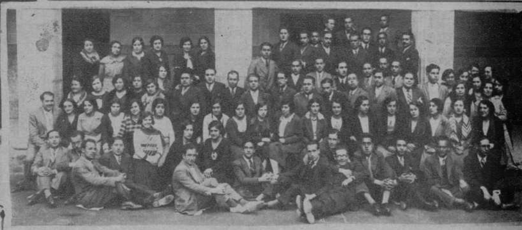
Tarragona.—Grupo de participantes en los Cursos del Magisterio, que han terminado la primera parte de los mismos.