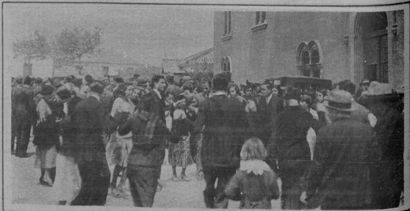
Sabadell.—Bailando sardanas, durante el «aplec» al Santuario de la Salud, celebrado con mucha animación.