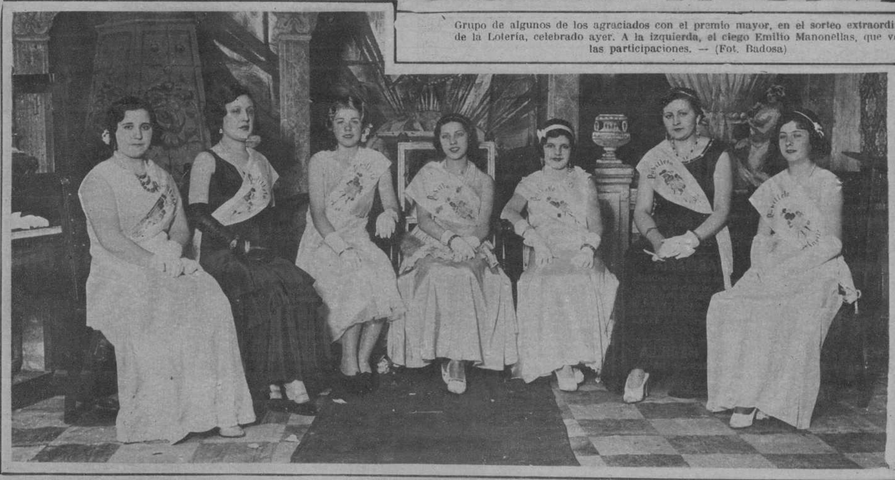
La «Fiesta de la Pubilla y de las Pubilletas».—Grupo de las bellas señoritas que resultaron elegidas para ostentar dichos títulos.