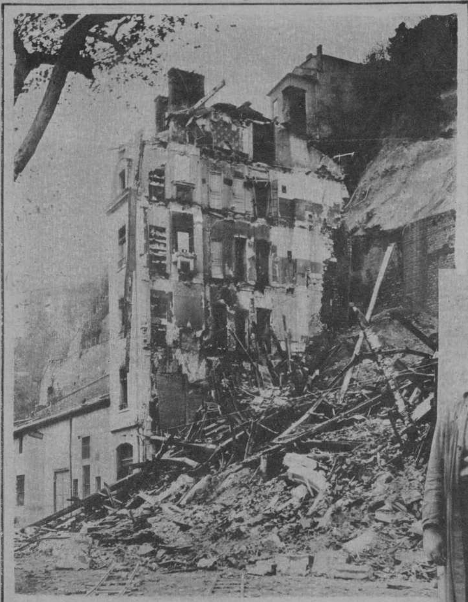
Lyon.—Estado en que quedaron las dos casas que se hundieron, en cuya catástrofe perecieron treinta personas.