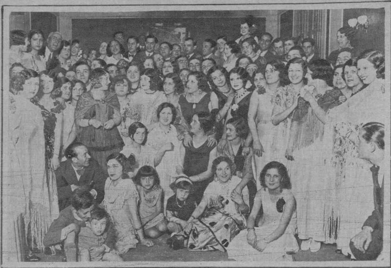
Grupo de concurrentes al "Balle de la Cruz de Mayo", organizado por el "Centro Andaluz".