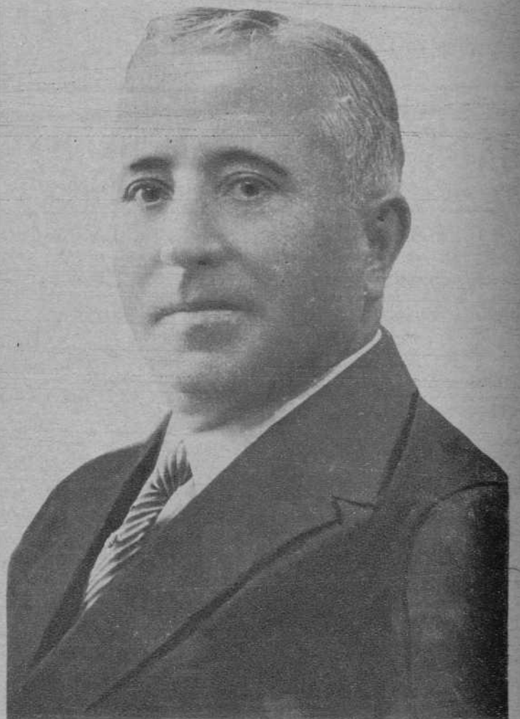
El gran cantante de ópera José Mardones, que ha fallecido en Madrid.