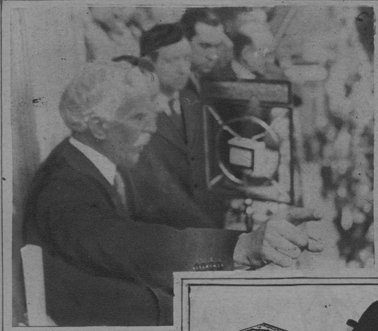
El Presidente de la Generalidad, don Francisco Maciá, en un momento del discurso que pronunció desde el balcón principal de aquel edificio