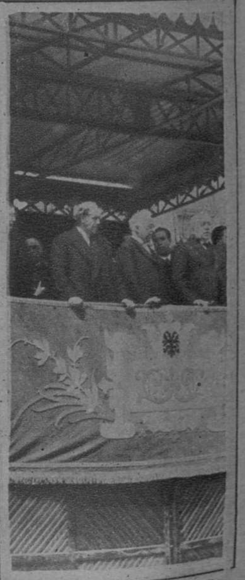
Madrid.—El Presidente de la República, señor Alcalá Zamora, con el del Gobierno, señor Aznar, y el de las Cortes, señor Besteiro, presenciando el desfile de las tropas, desde la tribuna levantada al efecto en el Paseo de la Castellana.