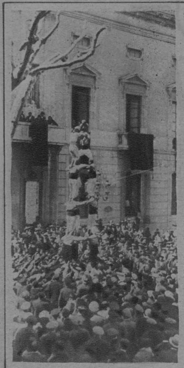
Tarragona.—Los «Xiquets de Tarragona», participaron en los festejos del 14 de Abril, elevando sus arriesgadas torres.