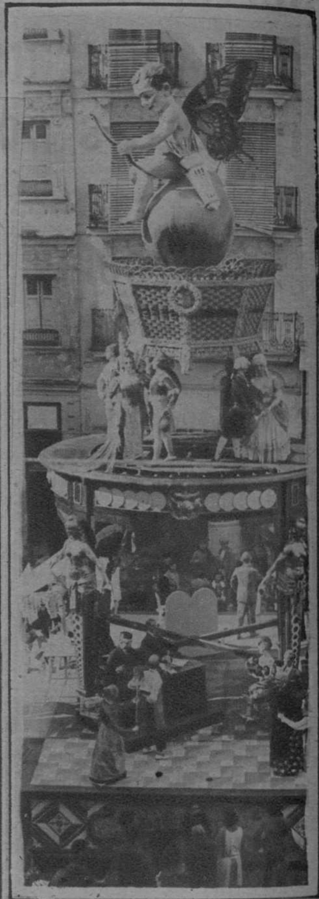
Falla de la Plaza del Collado