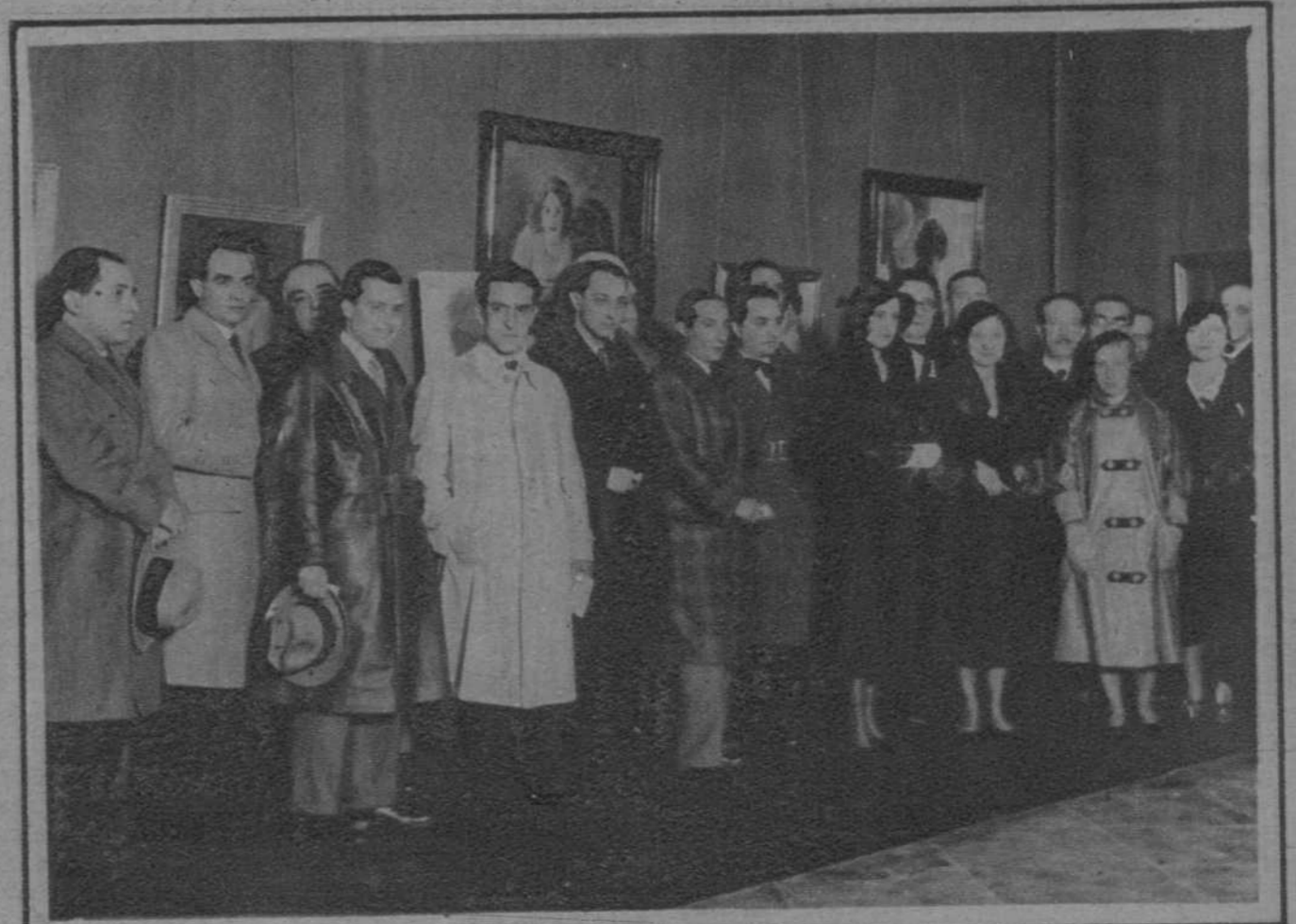
Madrid.—En el Salón de Arte Moderno, del Palacio de Bibliotecas y Museos. Concurrieron al acto inaugural de la Exposición de pintura y escultura de los evolucionistas catalanes. Asistieron al mismo, entre otras personalidades, el ex ministro de Economía, señor Nicolau D'Olivér (I) y el consejero de Cultura de la Generalidad, don Ventura Gassol (II).