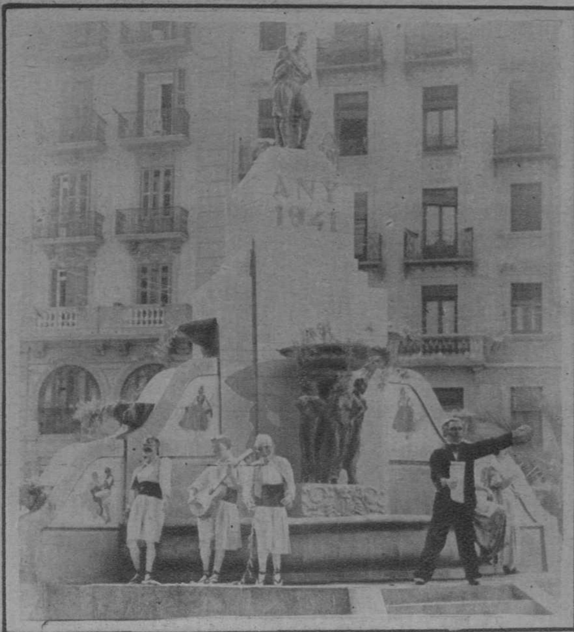
Falla de la Avenida del 14 de Abril.