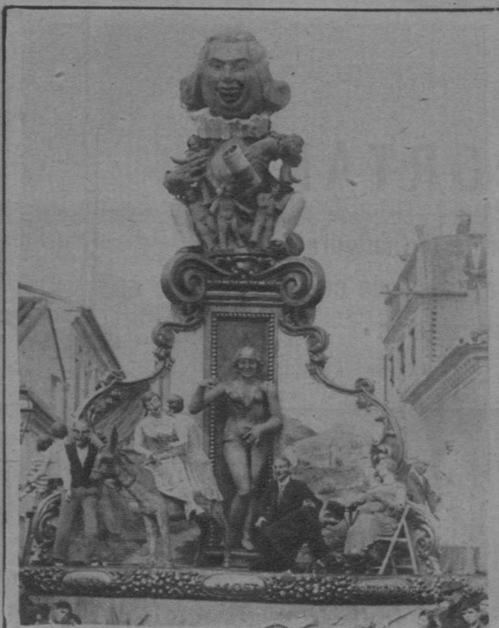
Falla de la calle de Serrano