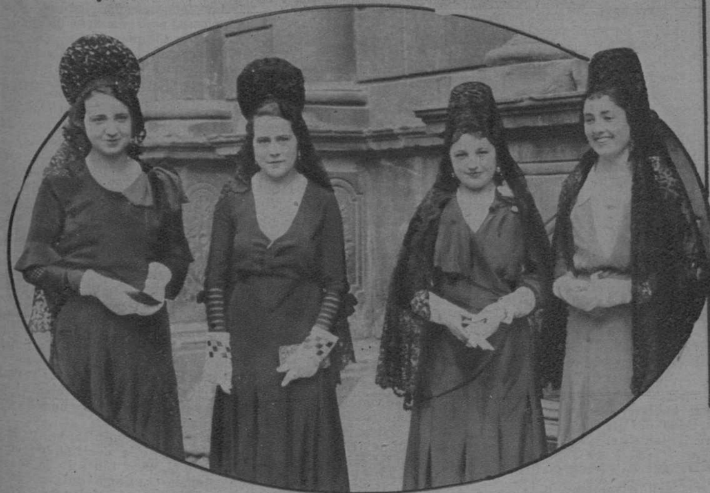
Olot.—Distinguidas señoras que han presidido las «Cuarenta Horas», celebradas solemnemente en la iglesia parroquial.