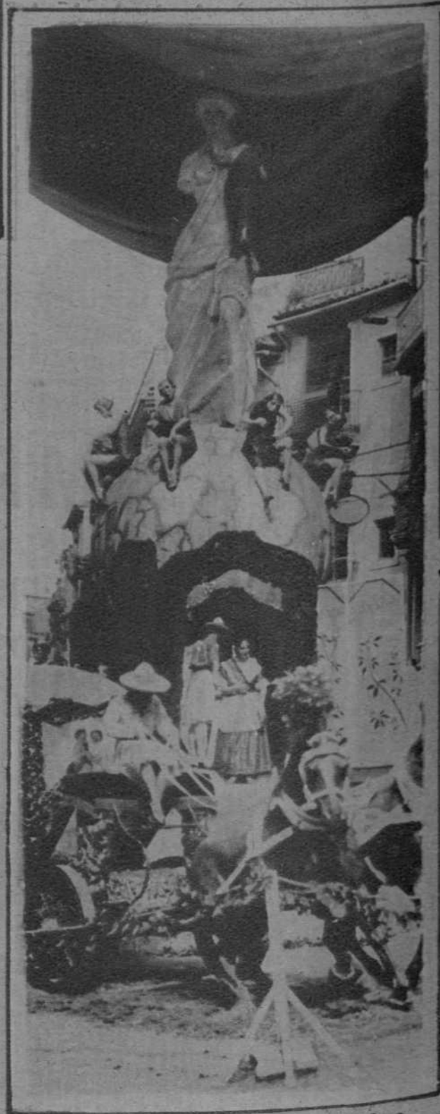
Falla de la Plaza de San Jaime