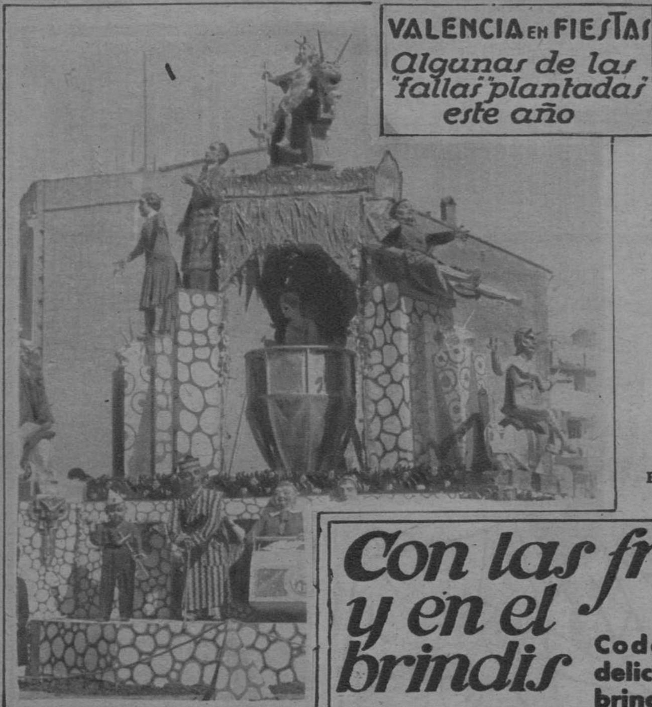
VALENCIA EN FIESTAS Algunas de las "fallas" plantadas este año