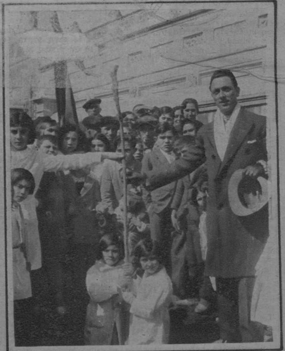
Tarragona.—Un momento de la «Fiesta del Arbol», en la que tomaron parte los niños de las Escuelas