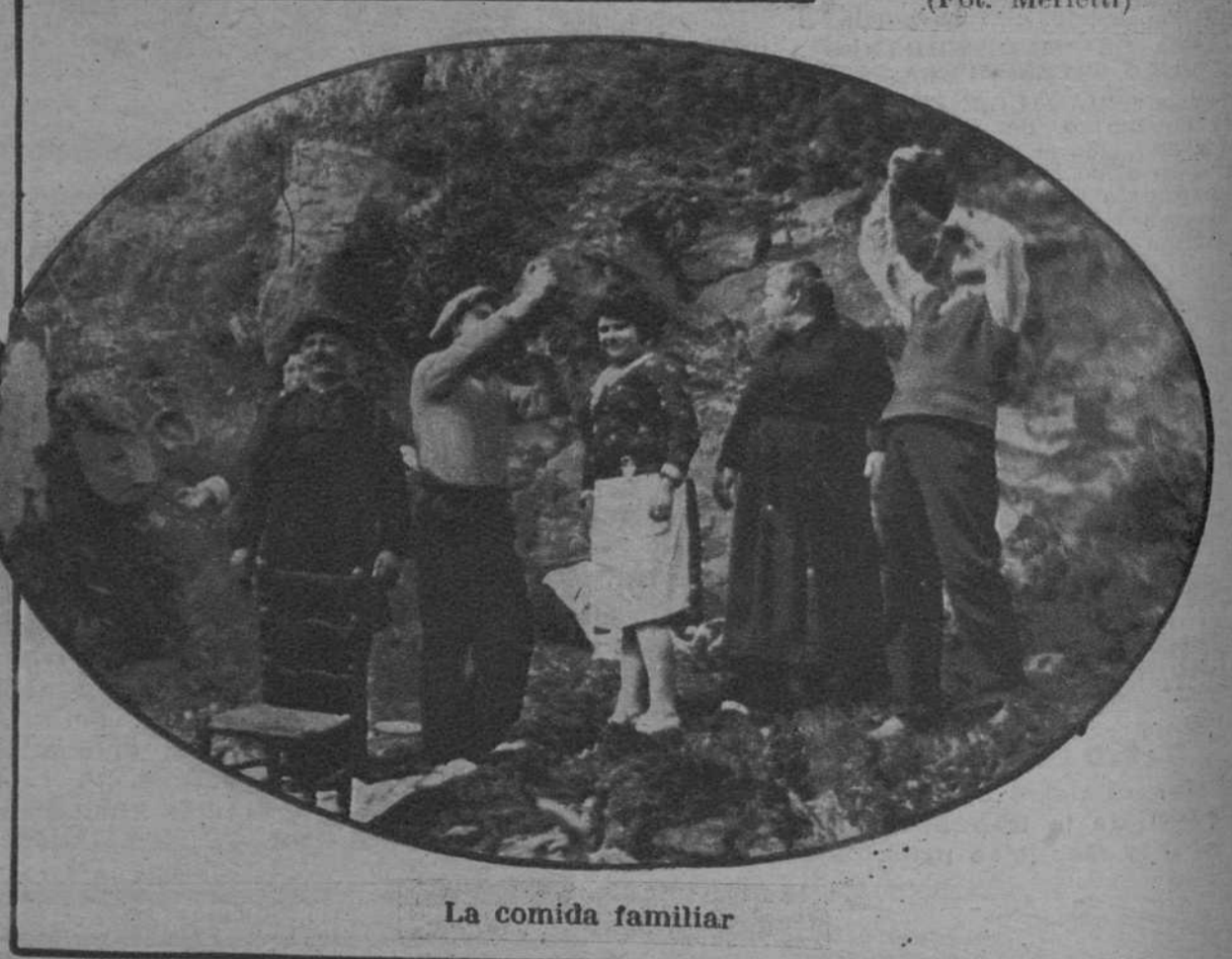
La comida familiar