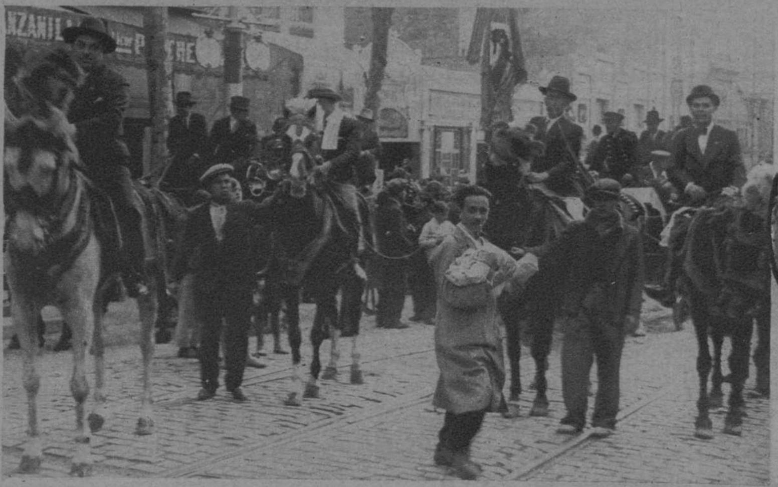
SAN MEDIN.—LA TIPICA FIESTA DE AYER. El abanderado de la «Colla de San Medin»