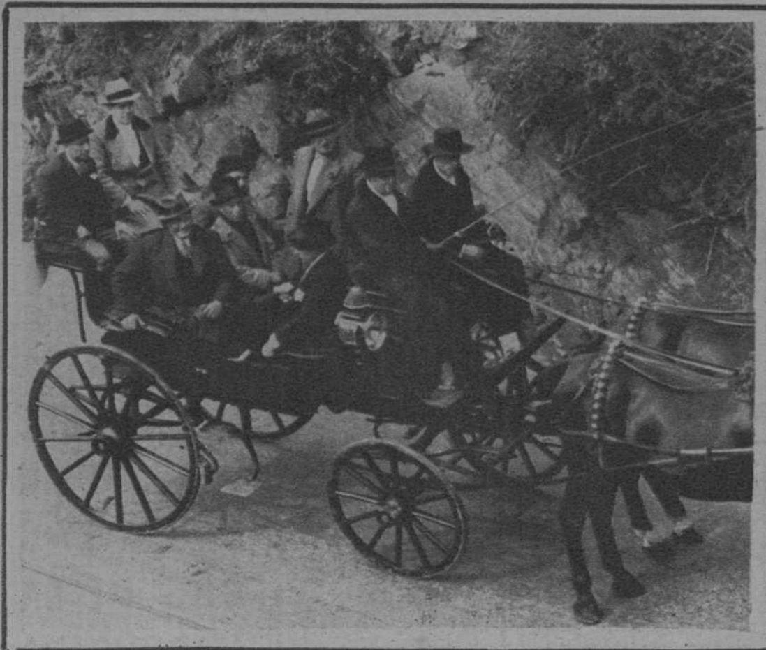
Uno de los coches que concurren a la tradicional romería