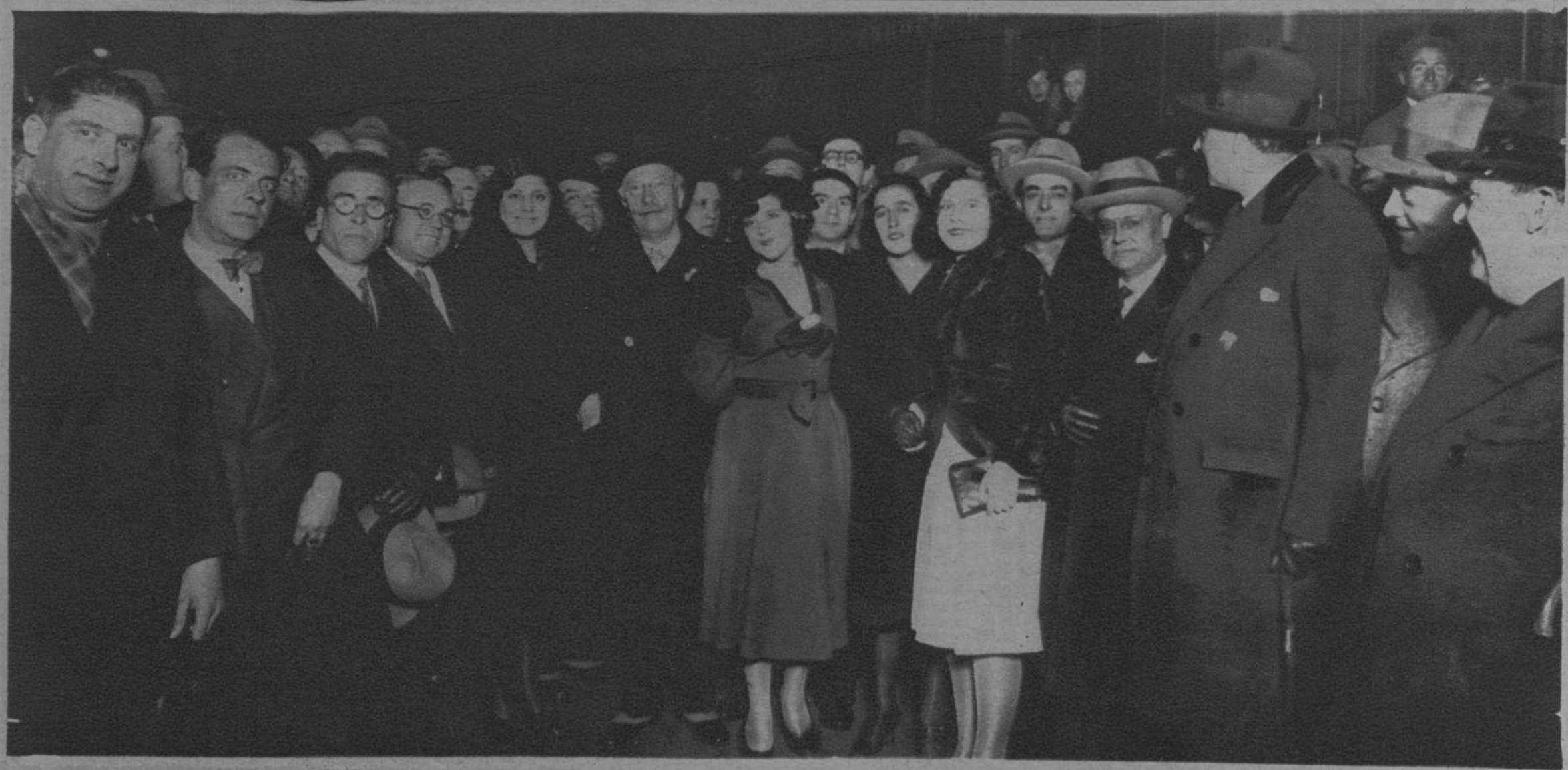
En el Apeadero del Paseo de Gracia, Don Alejandro Lerroux, momentos antes de tomar el tren, anteanoche, para regresar a Madrid, rodeado de algunos de los innumerables amigos y correligionarios, que acudieron a despedirle.