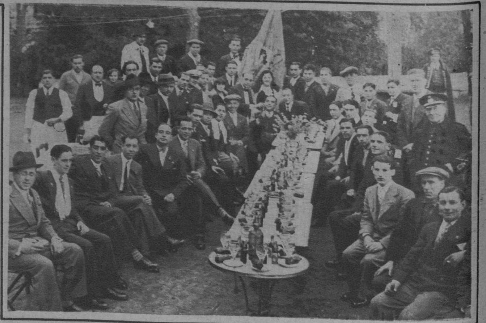
La «colla» «Els Formals», tomando el aperitivo