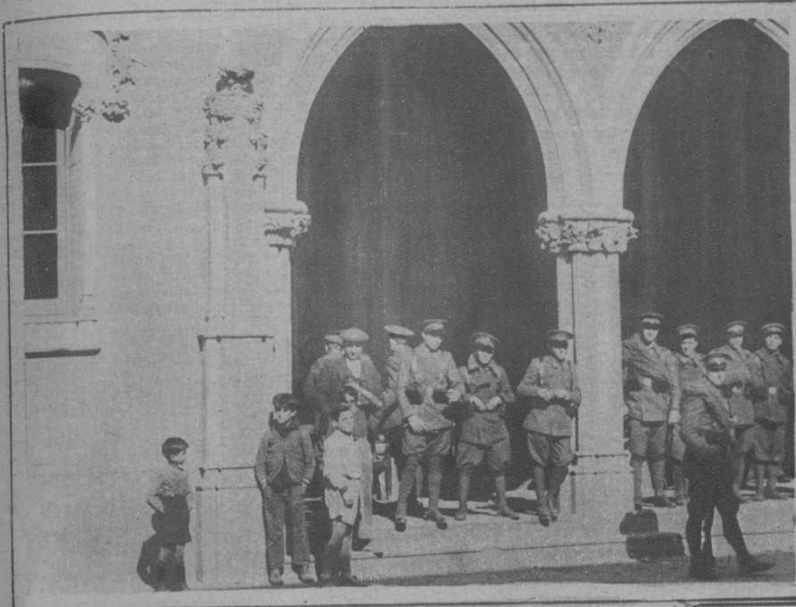
Fuerzas del Ejército custodiando el edificio del Ayuntamiento