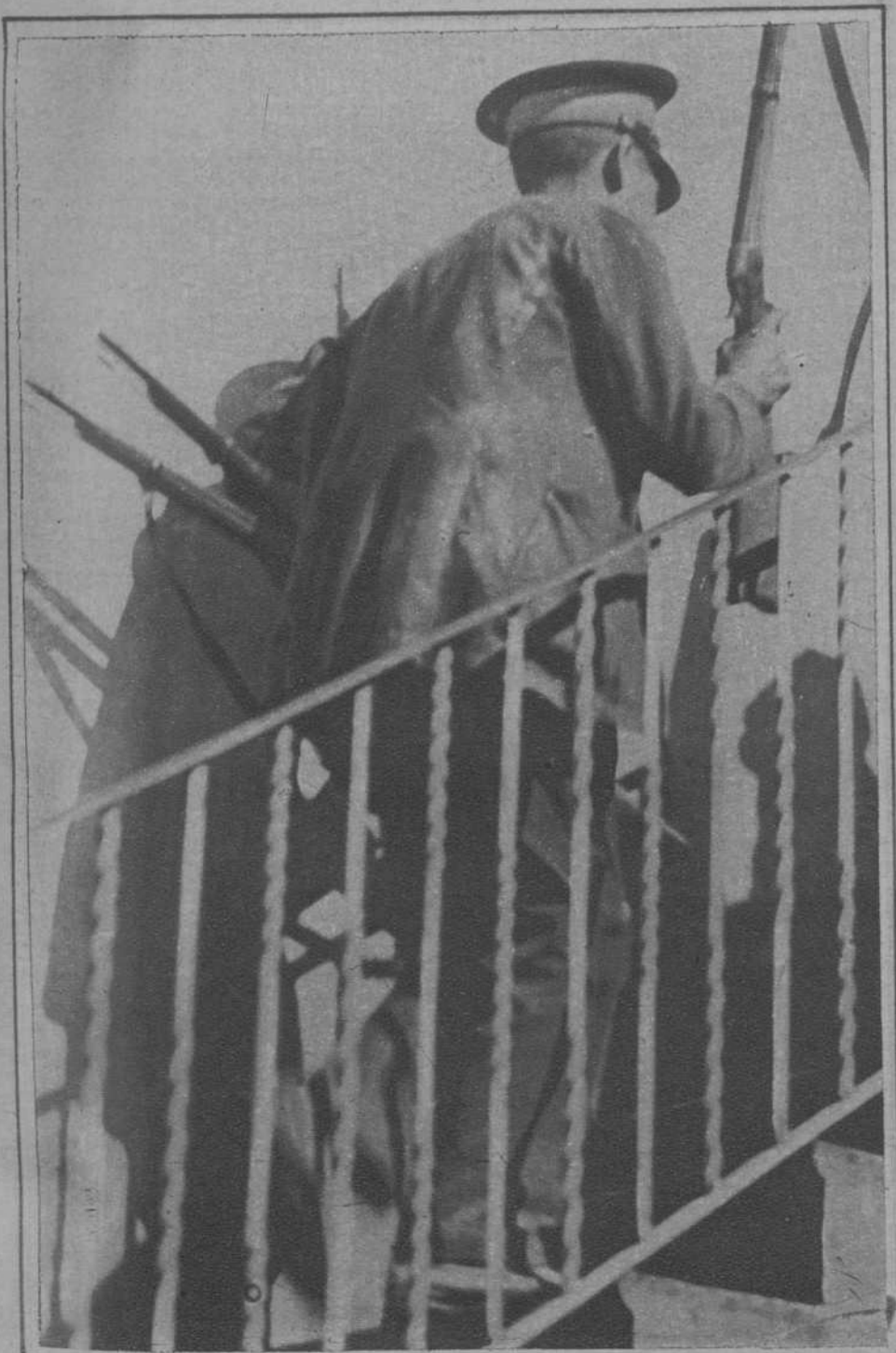
Transportando las armas ocupadas a los revoltosos