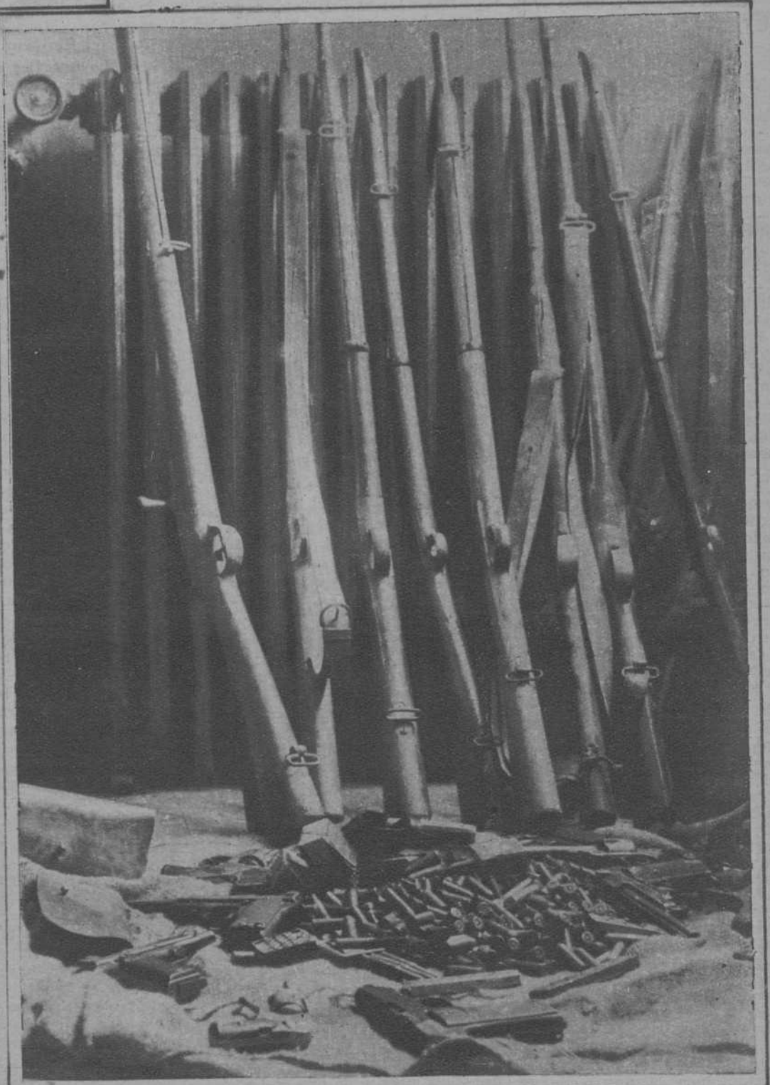
Armas y municiones ocupadas por la fuerza pública.