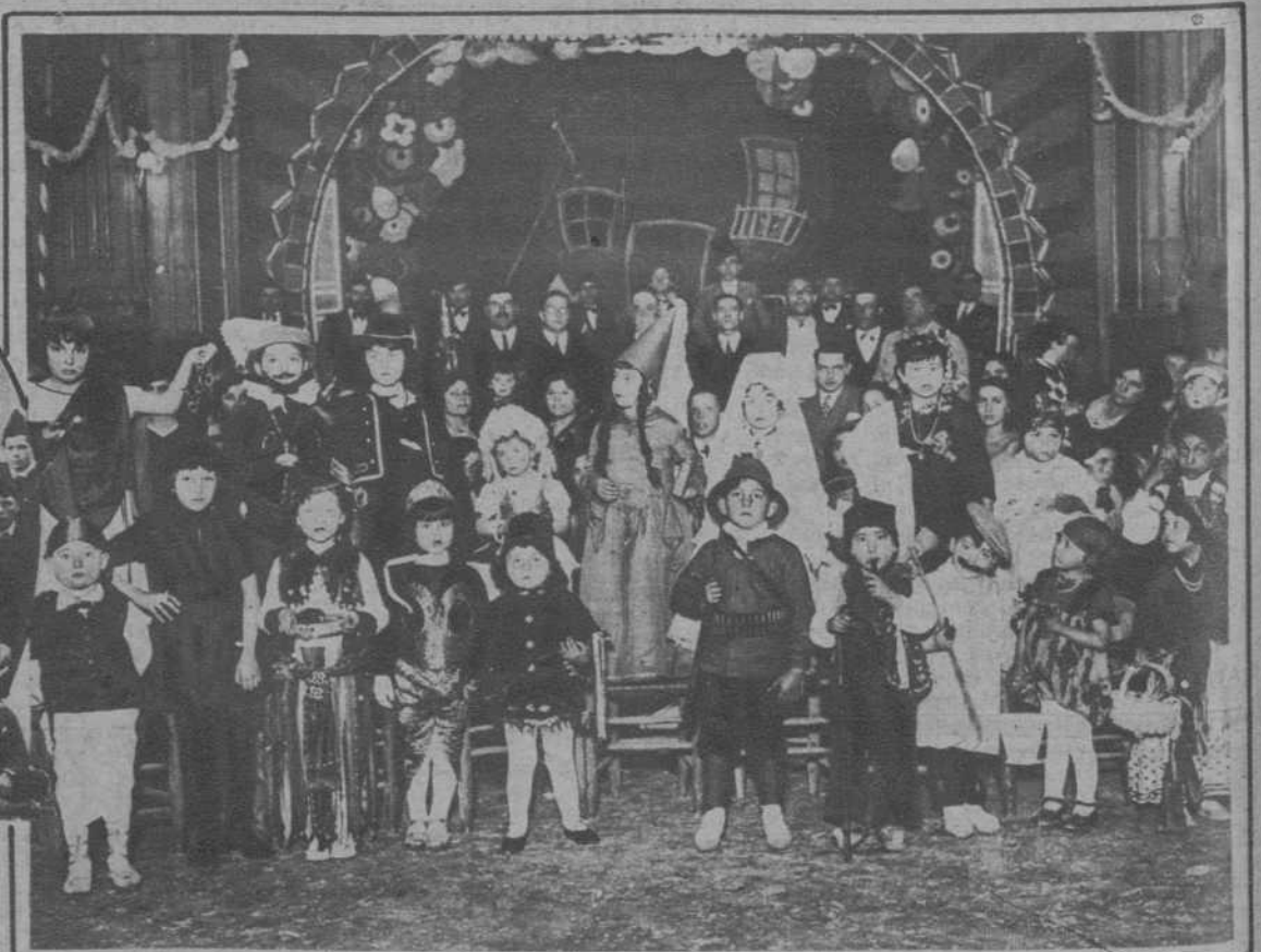
Malgrat.—Concurrentes al baile infantil de disfraces, celebrado en el "Cine Liceo"