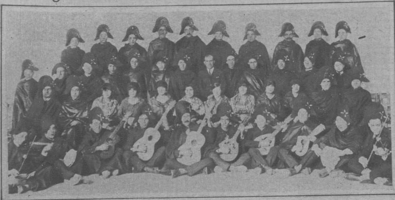
Manresa.—Una típica estudiantina.