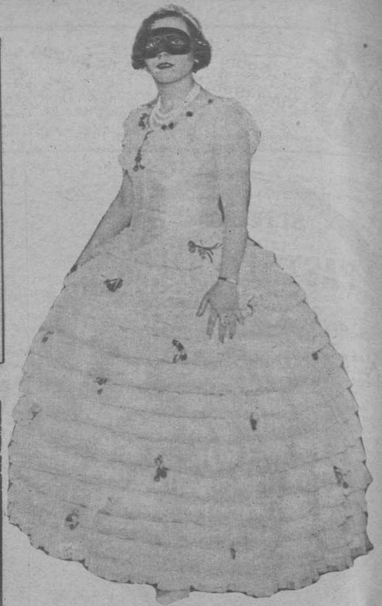
Manresa.—Mascarita que ganó el primer premio en el Concurso de disfraces.