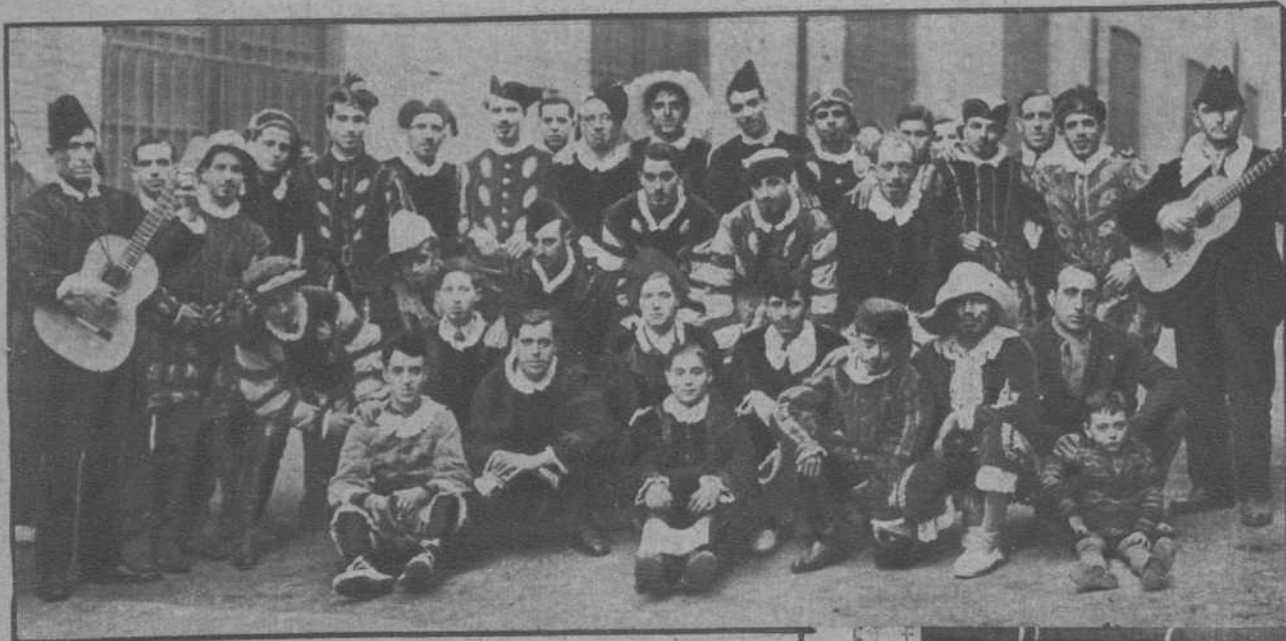
Manresa.—Otra "Tuna", que también recorrió la ciudad