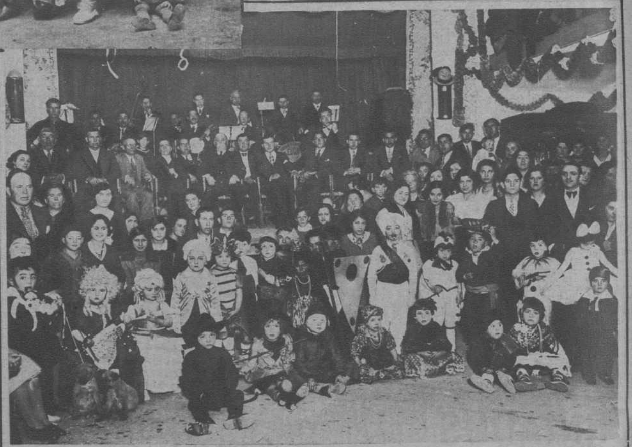
Pineda.—En el "Cine Tivoli", se celebró un brillante baile infantil de disfraces. He aquí un grupo de los concurrentes a la fiesta.