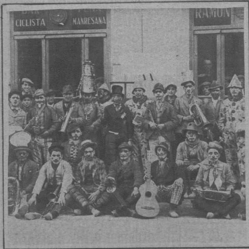
Manresa.—Una "murga" callejera.