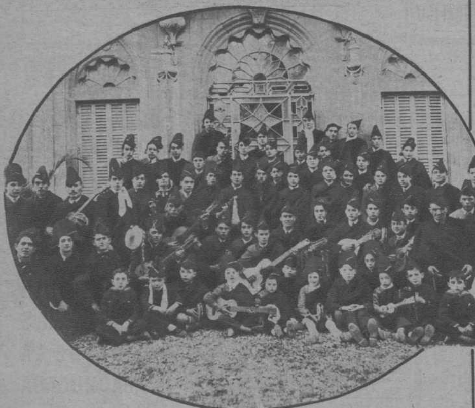
Reus.—Estudiantina de la "Casa del Pueblo", que dió varios interesantes conciertos, siendo muy aplaudida.