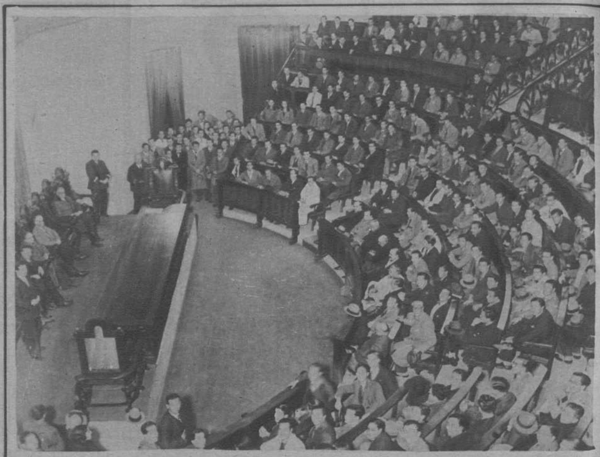
En el anfiteatro de la Facultad de Medicina.—Solemne sesión, celebrada ayer, en honor de los estudiantes de Medicina de Sevilla, que han llegado a Barcelona de paso para París, a donde van en viaje de estudio.