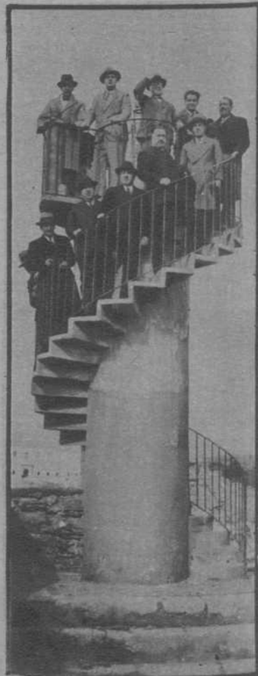
Melilla.—La Comisión de diputados de la minoría radical de las Constituyentes, que ha llegado en viaje de estudio, visitando el Observatorio Meteorológico, acompañados por las autoridades de esta ciudad y representaciones de su partido en la misma.