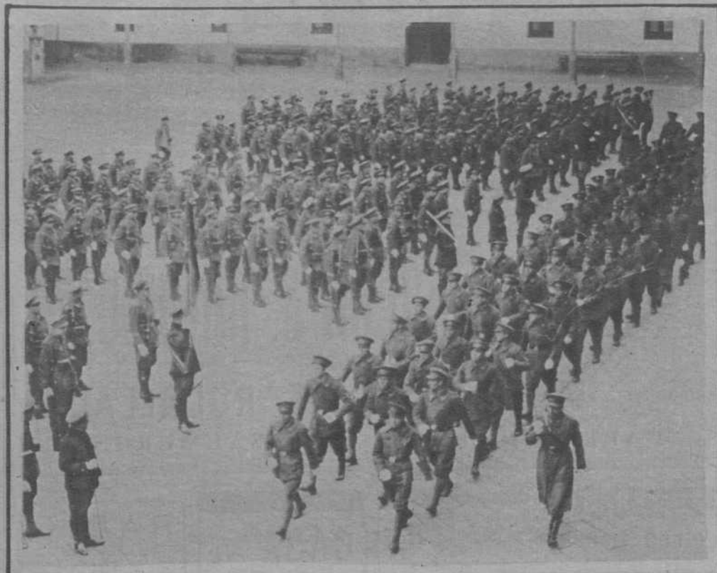
En el Cuartel del Parque.—Desfile de los nuevos reclutas, después de prestar promesa de fidelidad a la bandera, cuyo acto se celebró ayer, coincidiendo con la fiesta de la «Despedida del Soldado».