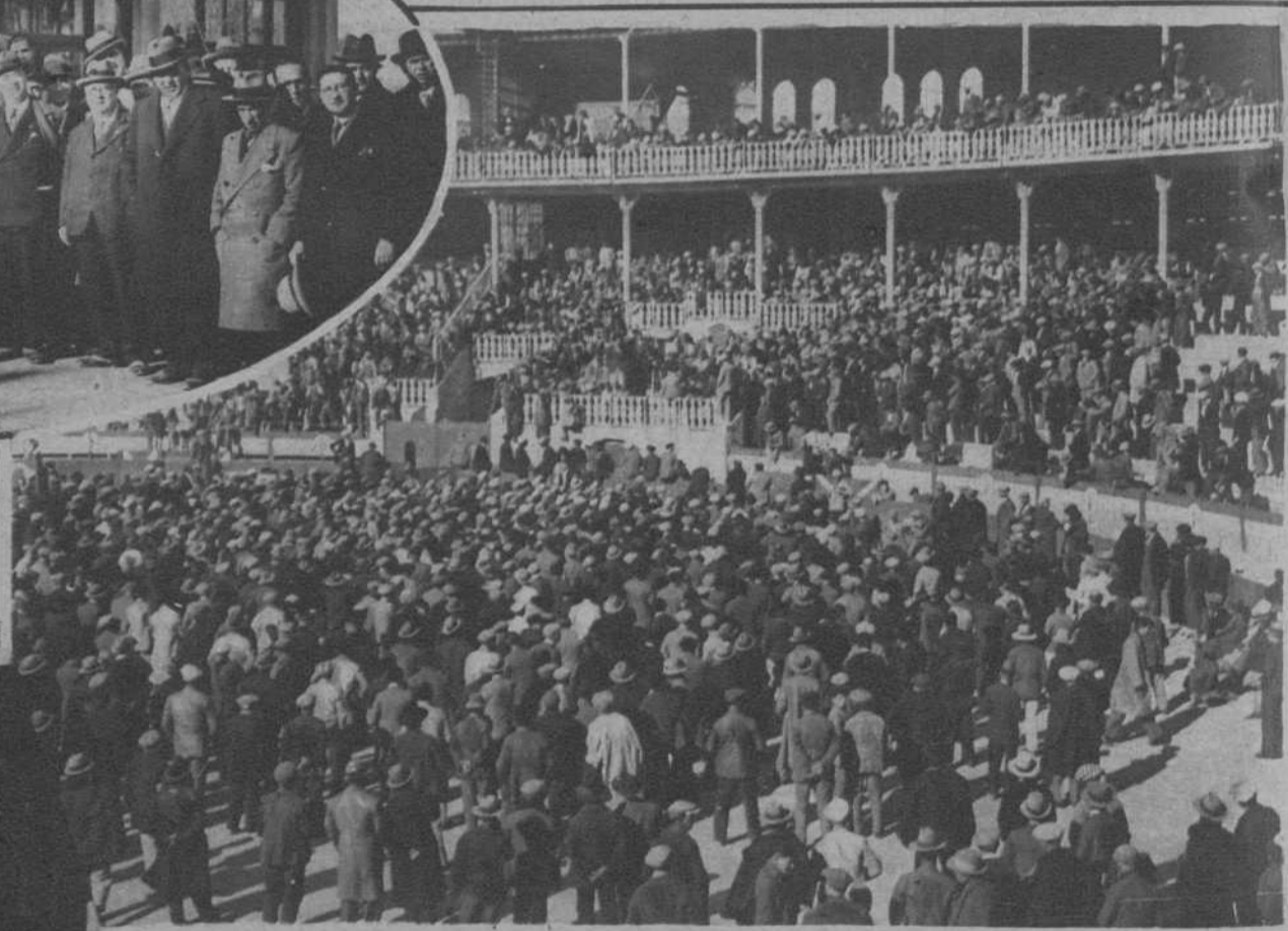
Granada.—Aspecto de la Plaza de Toros, durante la celebración del «mitin de agitación ferroviaria».