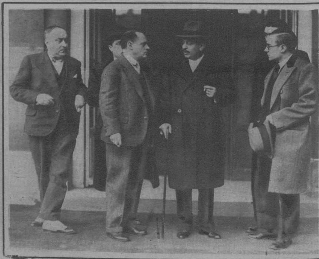
París.—Antes de la solución de la crisis, resuelta con un nuevo Gabinete Laval. El señor Laval, saliendo del Quai d'Orsay, de conferenciar con el señor Briand