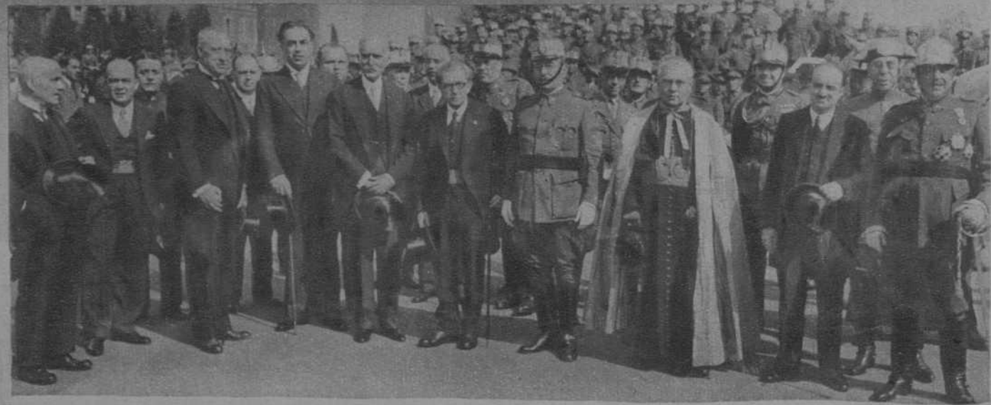
Un aspecto de la gran parada