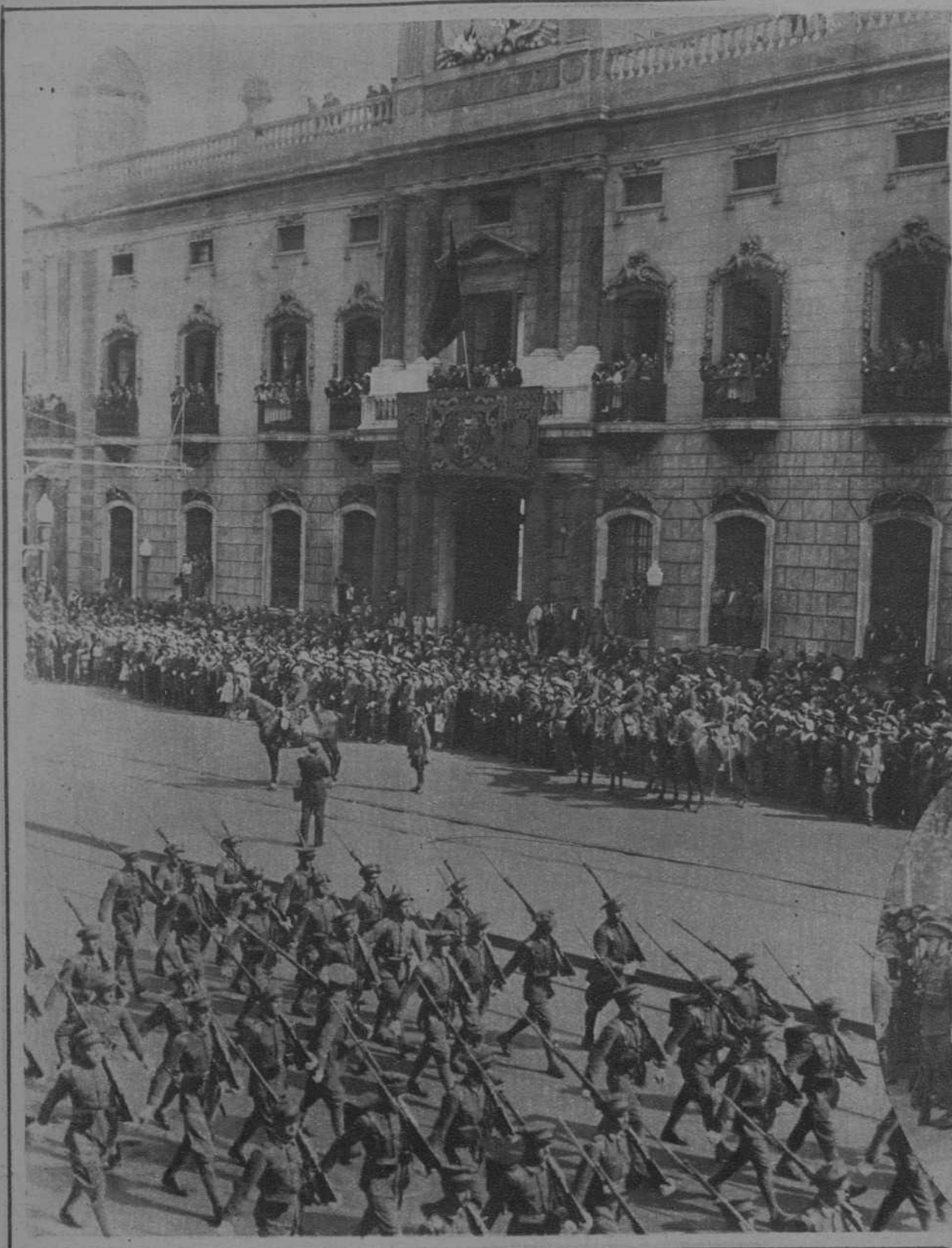
Desfile de las tropas, ante el edificio del Gobierno Civil, desde cuyo balcón principal lo presenciaron las autoridades.