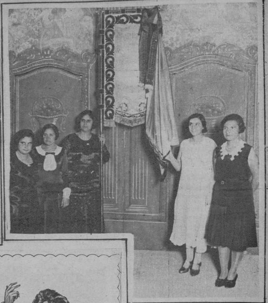
Comisión de señoritas con el nuevo estandarte.