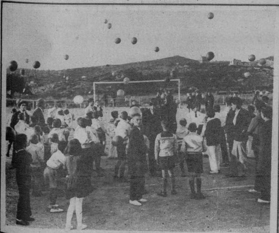
Elevación de globos por los niños de la Casa Provincial de Beneficencia, durante el festival celebrado en su honor.