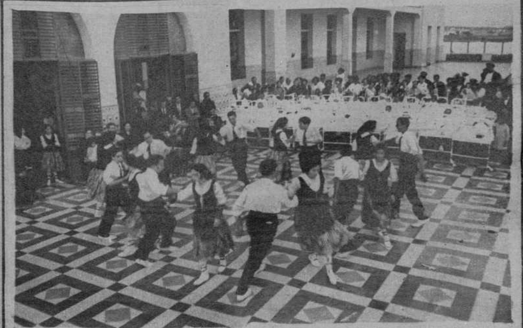
Un momento de la danza «Bolanguera»