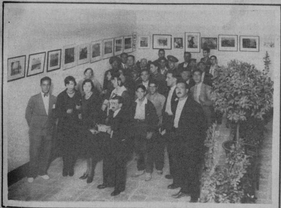
En el «Ateneu Enciclopèdic». Aspecto parcial de la interesante exposición de fotografías de la «Agrupació Fotogràfica de Catalunya», organizada por la «A. F. de Tarragona».