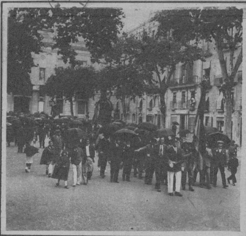
DESCUBRIMIENTO DE LA LAPIDA QUE DA EL NOMBRE DE «ANGEL GUIMERA» A LA HASTA AHORA LLAMADA DE «SAN AGUSTIN». Las autoridades, saliendo del Ayuntamiento, para dirigirse al acto inaugural.