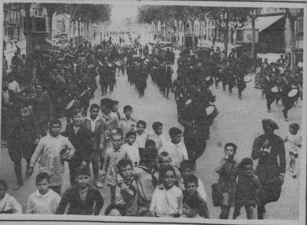
Las bandas militares, recorriendo la población, tocando alegres dianas.