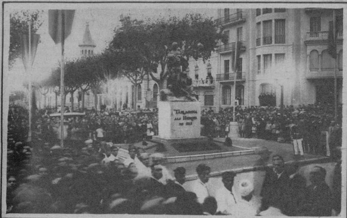
La inauguración del monumento a los Mártires de 1811, obra de Julio Antonio. Las autoridades, la señora madre y otros familiares del malogrado escultor tarraconense, y el público, durante el acto.