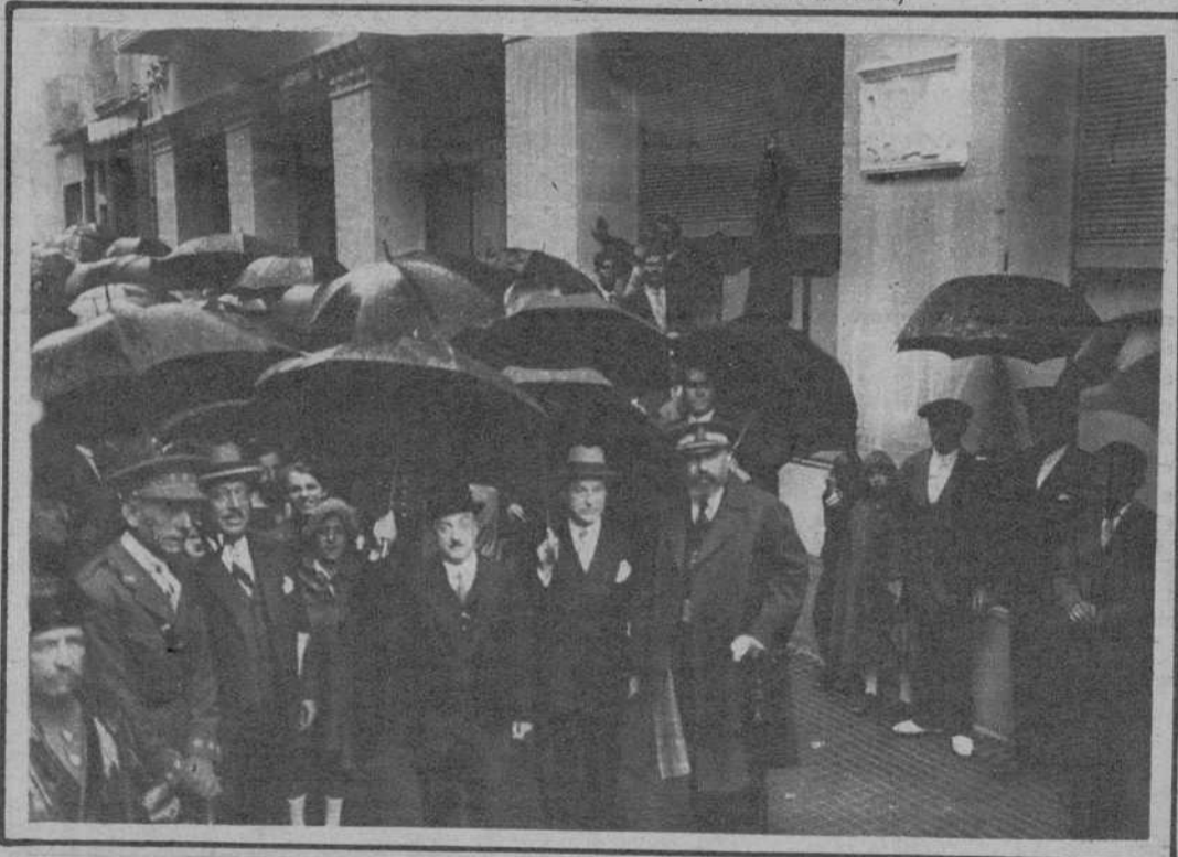
El gobernador civil y demás autoridades, momentos después de descubrir la lápida