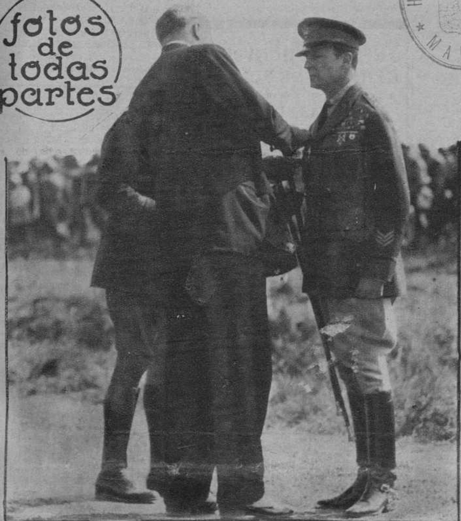
Las grandes maniobras militares en el Aise (Francia).—El señor Maginot, ministro de la Guerra, condecorando con la placa de Gran Oficial de la Legión de Honor, al general Mac Arthur, comandante en jefe de las fuerzas americanas.