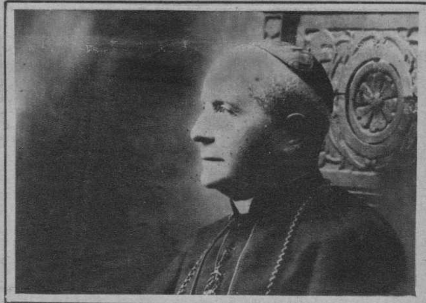
El cardenal Ragonesi, de ochenta y un años de edad, que acaba de fallecer