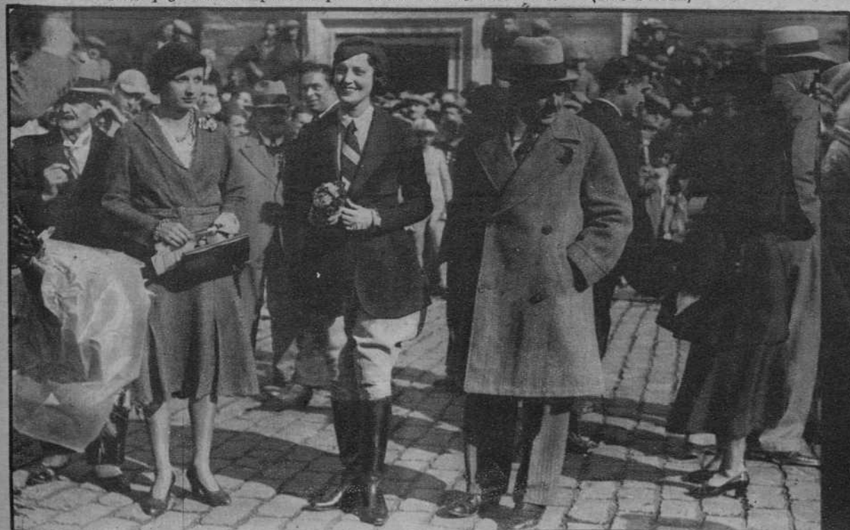
PARIS.—LA CARRERA ANUAL DE LAS «COUSETTES», ORGANIZADA POR LA «REPÚBLICA LIBRE DE MONTMARTRE». — La gentil «estrella» de la pantalla, Jeannette Mac Donald, dando la salida a las simpáticas «midinettes» que participaron en la prueba