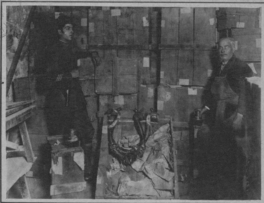
Madrid. — Cajones conteniendo objetos litúrgicos, encontrados en los sótanos del cuartel de San Francisco. — (Fot. Piortiz)