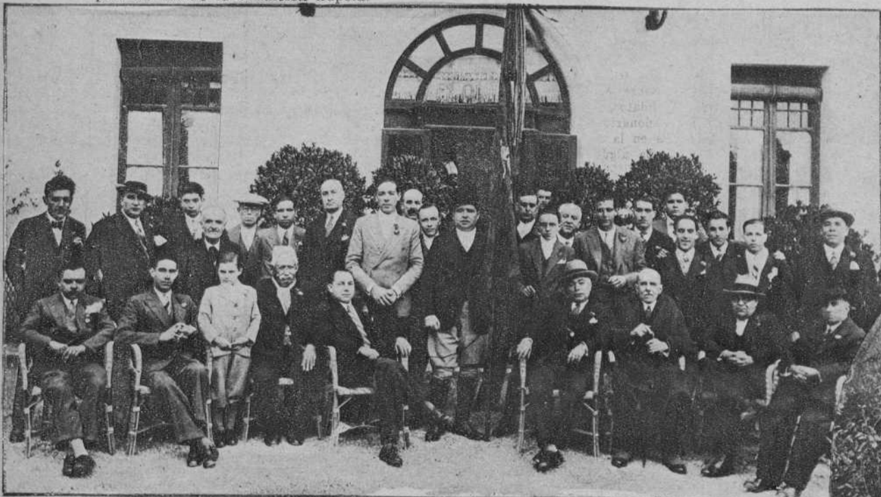
La Colla «La Antiga de Sant Medin», de San Gervasio, en el Tibidabo, antes del banquete en que sus componentes se reunieron.

Número obligado y simpatiquísimo en el programa de las fiestas con que se honra a San Medin el día 3 de marzo, es el de los banquetes de confraternidad y las comidas familiares al aire libre, que reproducen—por lo que al año actual respecta—las adjuntas fotografías