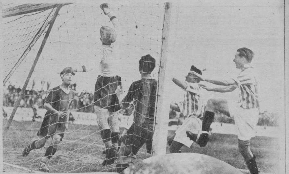
Sevilla.—El partido «Betis»-«Murcia». - Un momento de peligro para la puerta del «Murcia».