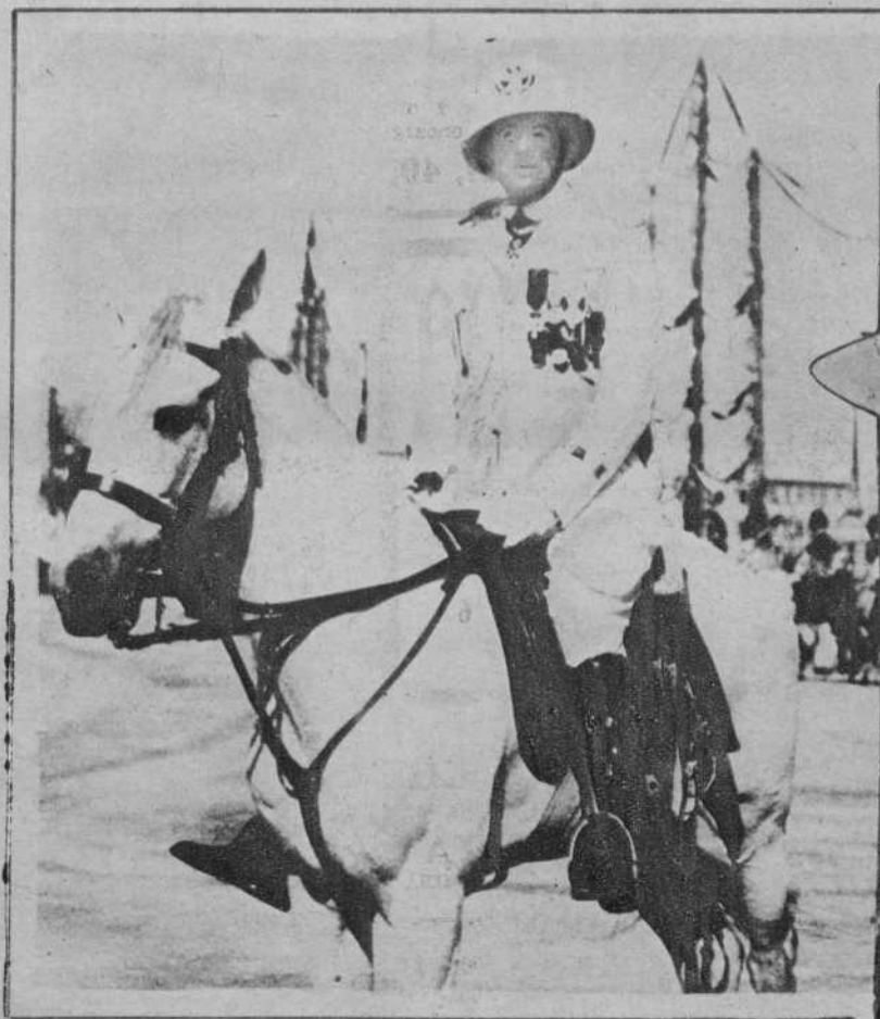
El general italiano Graziani, cuyo cadáver ha sido encontrado sobre la vía férrea, en la línea Florencia-Brato.