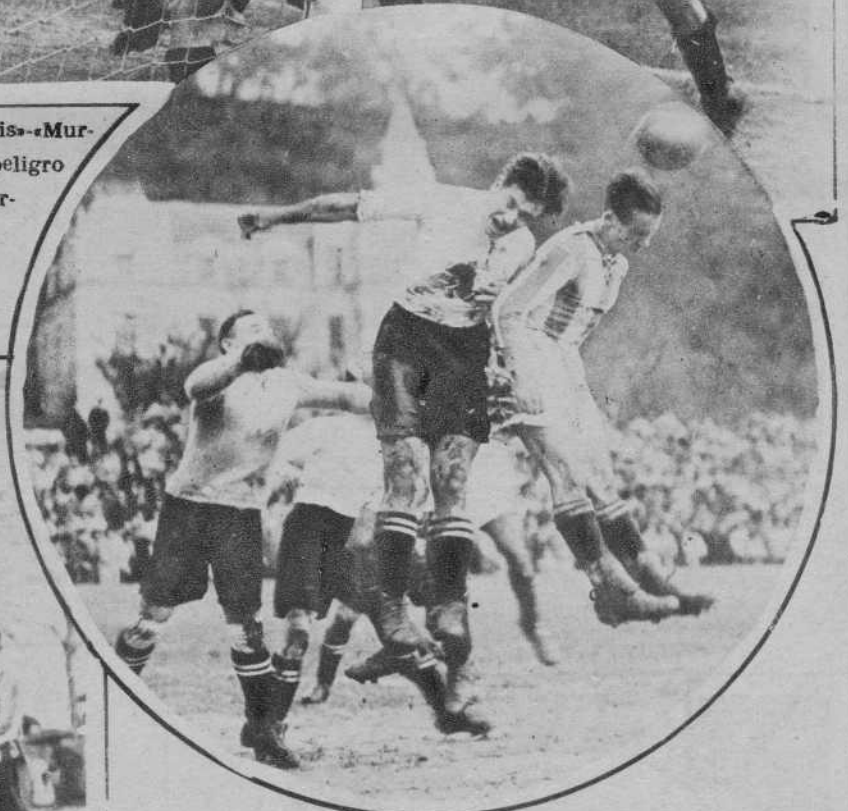
San Sebastián.—El partido «R. Unión»-«R. Sociedad». - Corner contra el «R. Unión», disputado por Bienzobas y Mayer