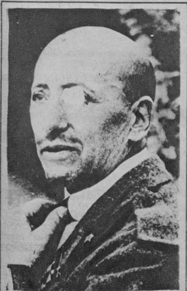
Gabriele d'Annunzio, que ha sufrido un nuevo ataque de influenza y cuya vida está en peligro.