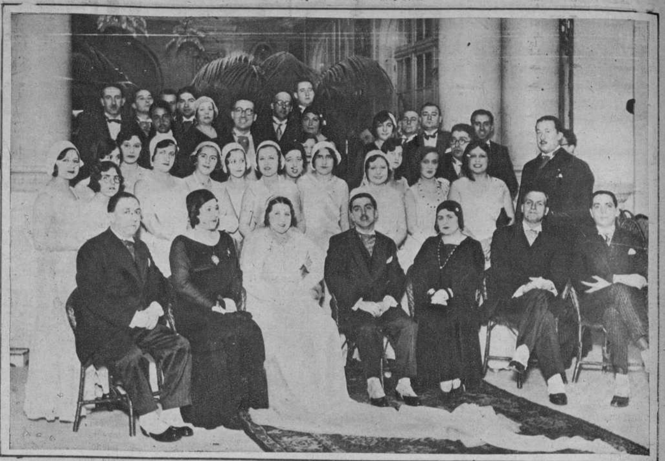
La feliz pareja, con sus distinguidas familias e invitados, en el Hotel Ritz