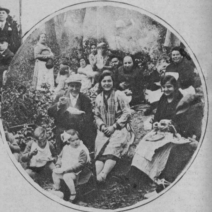
De cómo los aires del Tibidabo son un magnifico aperitivo...