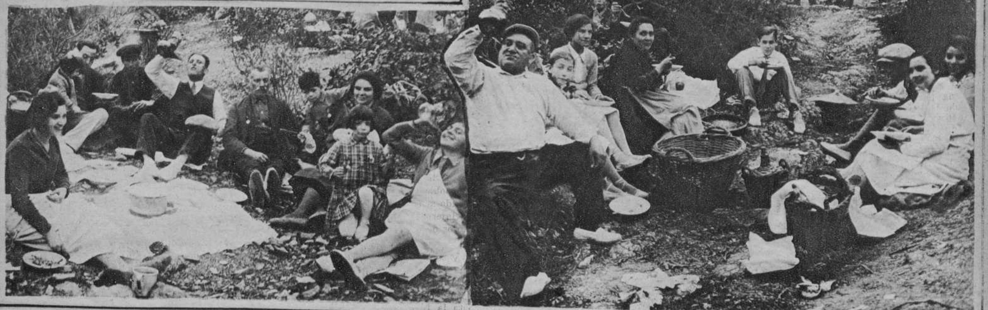
La agradable comida familiar, al aire libre y casi casi en plena naturaleza.