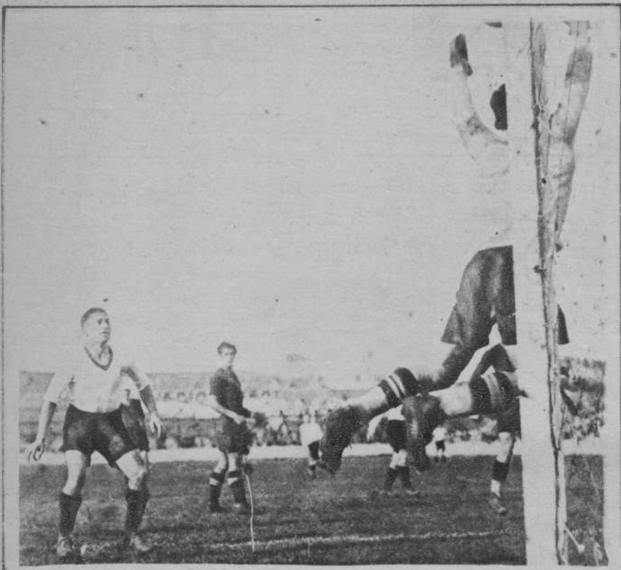
Santander.—El partido «Racing»-«Barcelona». - Una gran parada de Nogués