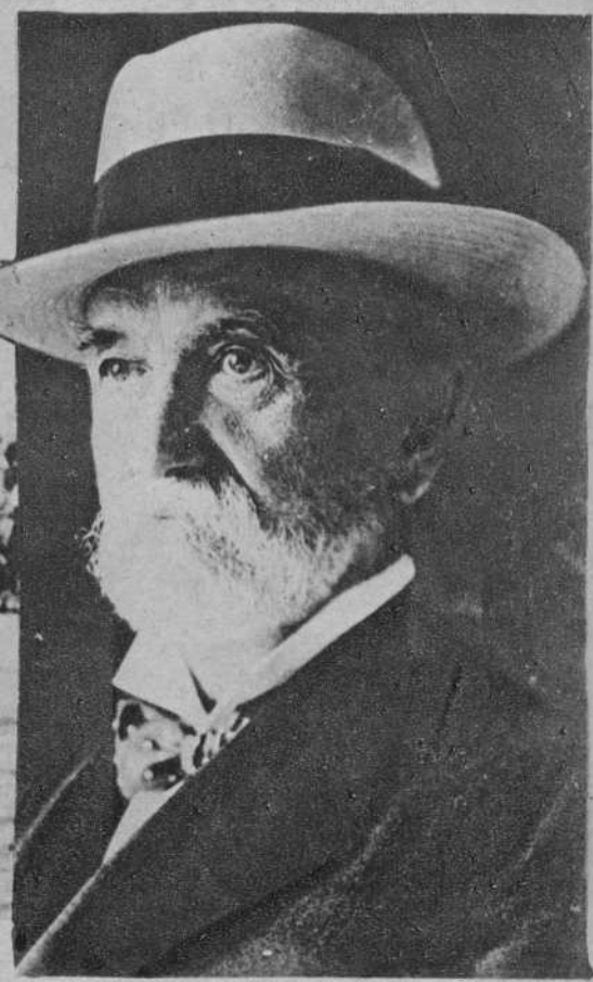
Mr. Henry A. Cooper, el miembro más anciano del Congreso de los Estados Unidos, en el que representaba al de Wisconsin, que ha fallecido a los ochenta y un años de edad.