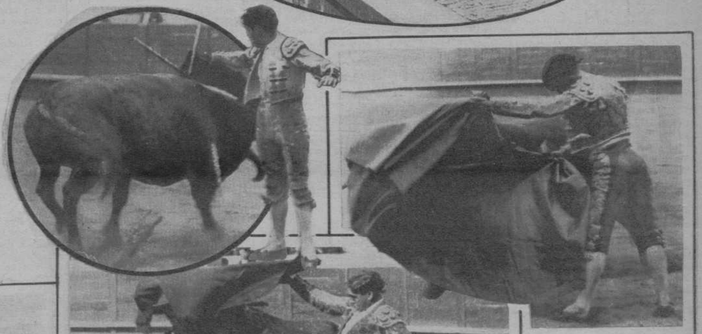
Corrochano en un lance