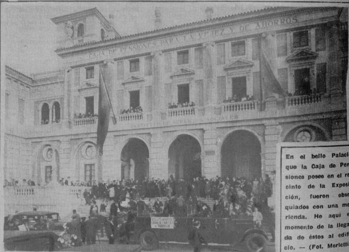
En el bello Palacio que la Caja de Pensiones posee en el recinto de la Exposición, fueron obsequiados con una merienda. He aquí el momento de la llegada de éstos al edificio.