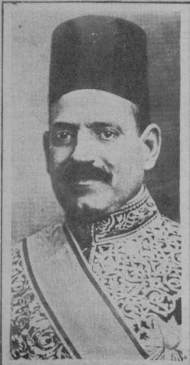
El Gabinete egipcio ha presentado su dimisión al Rey Fuad. Este, la ha aceptado. Retrato de Nahas Pacha, presidente del Gobierno dimisionario.