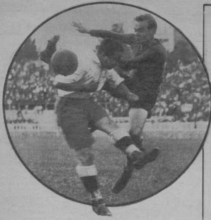
Jugaron, en el terreno de Las Cortes, el «Barcelona» y el «Red Stars», de París. Ganó brillantemente el «Barcelona» por 5 goals a 2, tras un partido interesante, en el cual se evidenció una clara superioridad de los españoles. Reproducimos los dos equipos antes de comenzar el encuentro y dos jugadas de éste