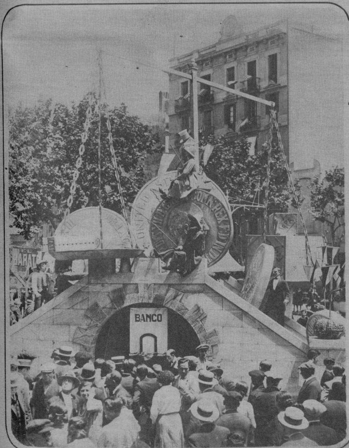
Artística «falla» levantada en la Ronda de San Antonio, que fué quemada con motivo de la celebración de la verbena de San Juan.