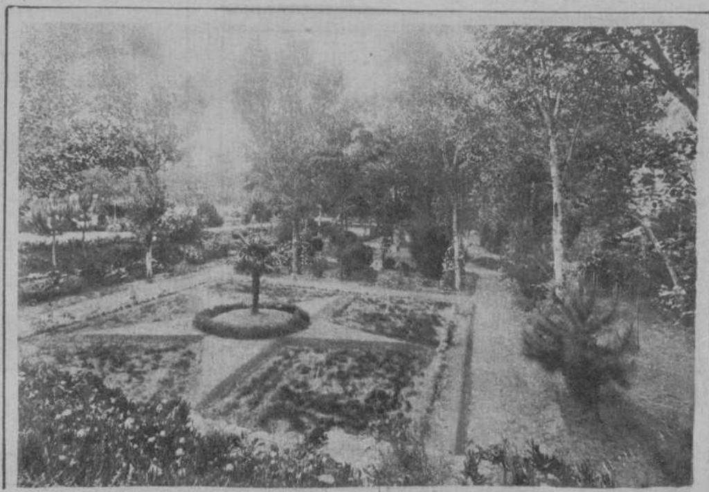
El delicioso encanto que ofrecen sus bellos jardines