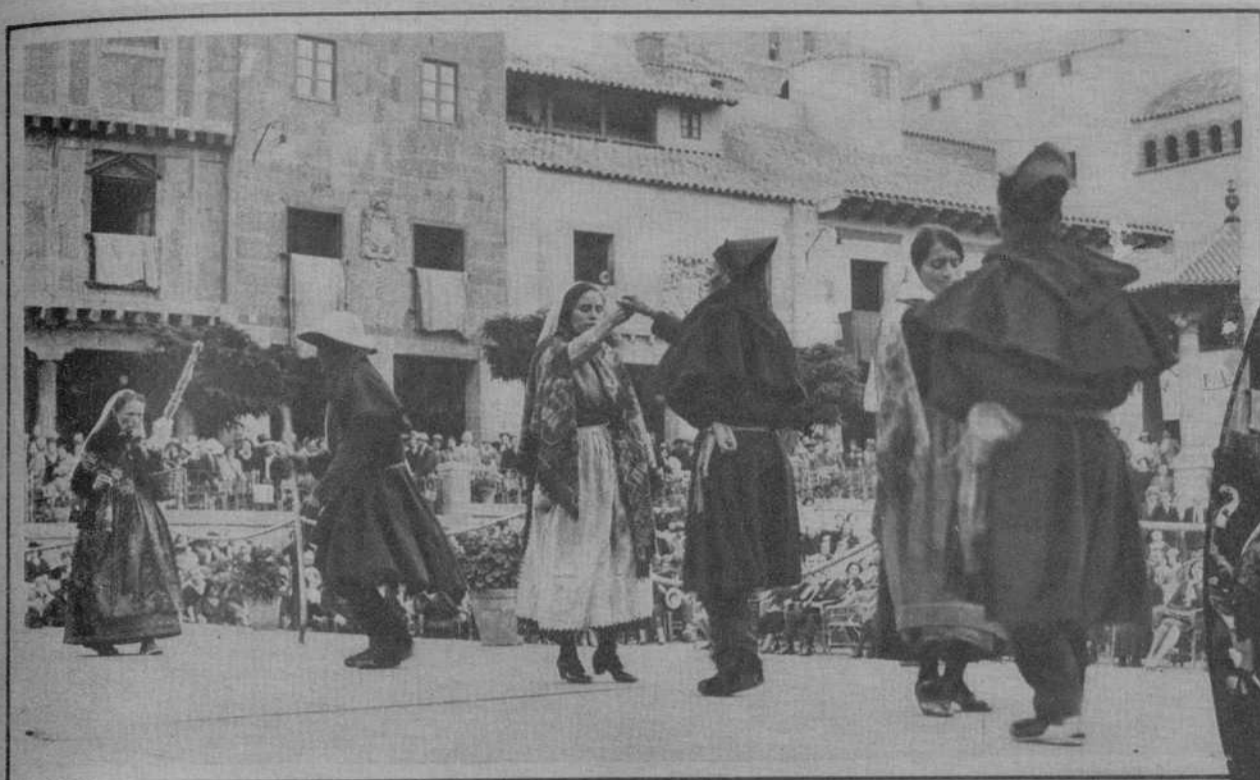
Celebróse, en la Plaza Mayor del Pueblo Español, un típico festival ampurdanés, en el que se exhibieron los típicos y tradicionales bailes de aquella hermosa comarca catalana. He aquí dos aspectos de la interesante fiesta.

SUSCRIPCIÓN CAPITAL Ptas. 2'25 al mes SUSCRIPCIÓN PROVINCIAS Ptas. 8'50 trimestre NÚMERO SUELTO DIEZ CÉNTIMOS