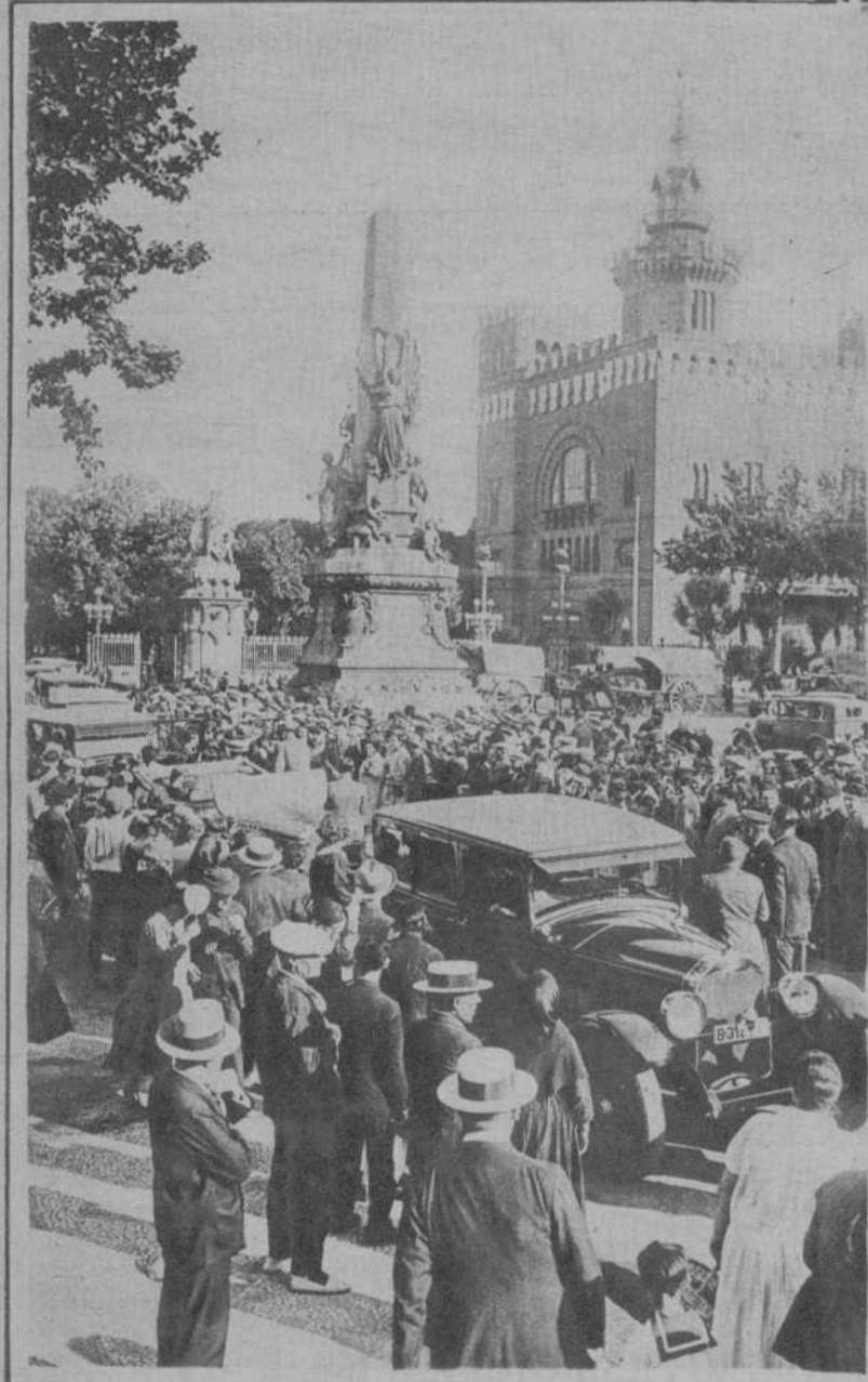
Junto al Monumento de Rius y Taulet se organizó la comitiva. Los ancianos, en automóviles cedidos por sus propietarios, salieron de dicho punto para recorrer la Exposición, acaso la postrer maravilla que sus ojos contemplarán.