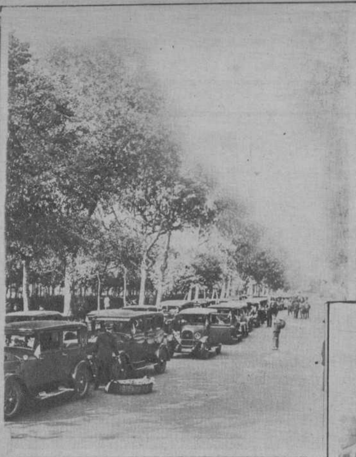
Los autos que, cedidos por particulares, condujeron a los ancianos en su visita a la Exposición

Verificóse, el sábado por la tarde, organizada por la Caja de Pensiones para la Vejez y de Ahorro, la visita colectiva de los ancianos asilados en los establecimientos benéficos a la Exposición de Barcelona. De dicho obsequio, homenaje sentido a la vejez, al que cooperaron las autoridades y muchos particulares, ofrecemos las adjuntas fotografías