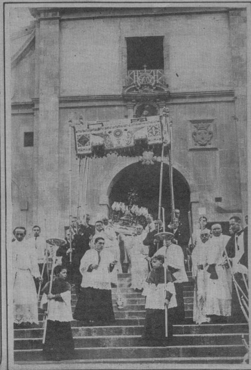
La procesión del Corpus, que salió de la parroquia de San José, de Gracia, fué este año brillantísima. Reproduce la adjunta fotografía el momento en que la Custodia sale del templo parroquial