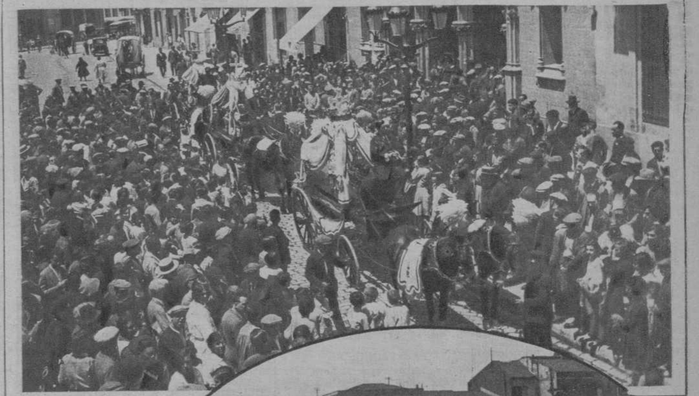
Se ha verificado en Triana, el entierro de los muchachos que arrastrados por las aguas en la Riera del Palau, hallaron trágica muerte. Al duelo se sumó la población entera. Dos aspectos del desfile del cortejo fúnebre entre la multitud apenada.