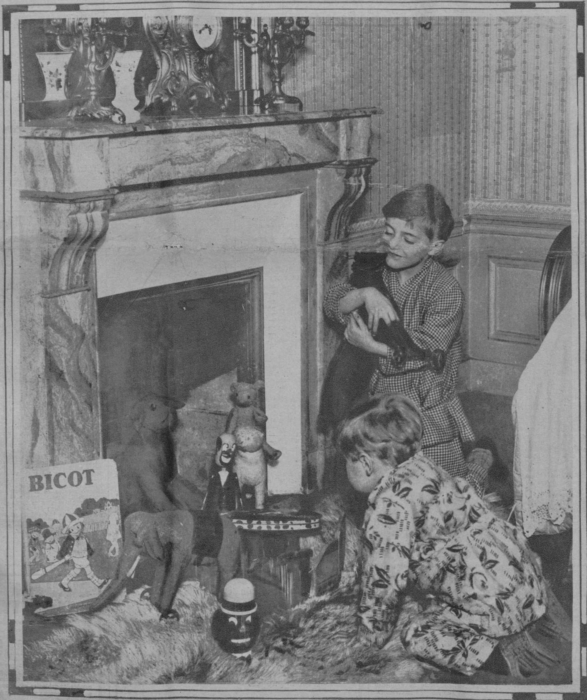
EL MOMENTO DE LA ILUSION EN PYJAMA, PORQUE NO TUVIERON PACIENCIA PARA DEJARSE VESTIR, HAN ACUDIDO A LA CHIMENEA PARA RECOGER LOS REGALOS DE LOS REYES DE ORIENTE (Fot. Consorcio).