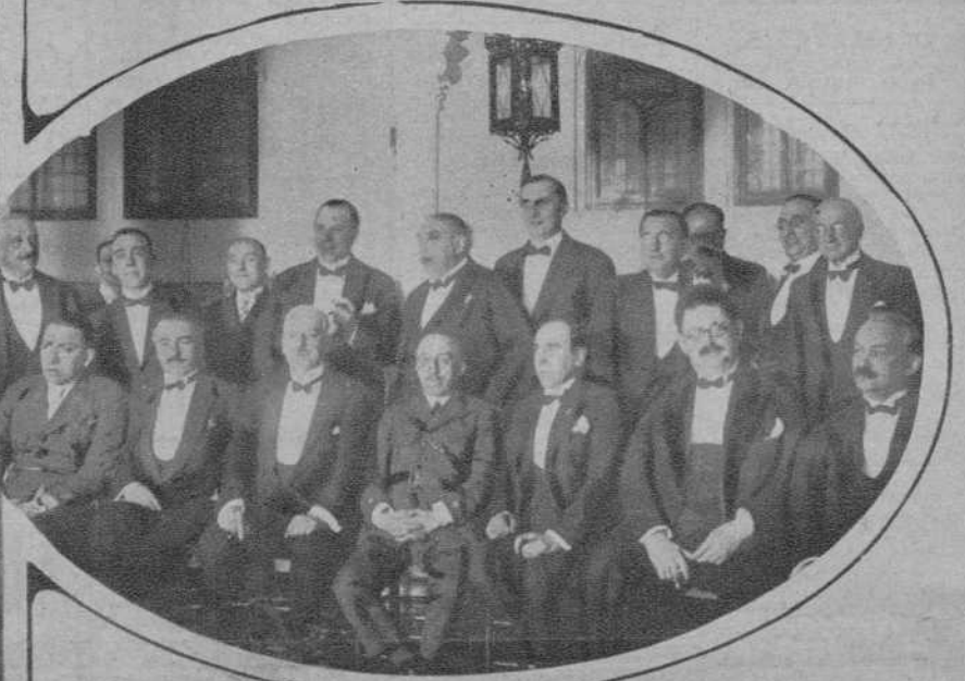
SAN SEBASTIAN.—Banquete ofrecido por el Cuerpo consular a las autoridades de San Sebastián.