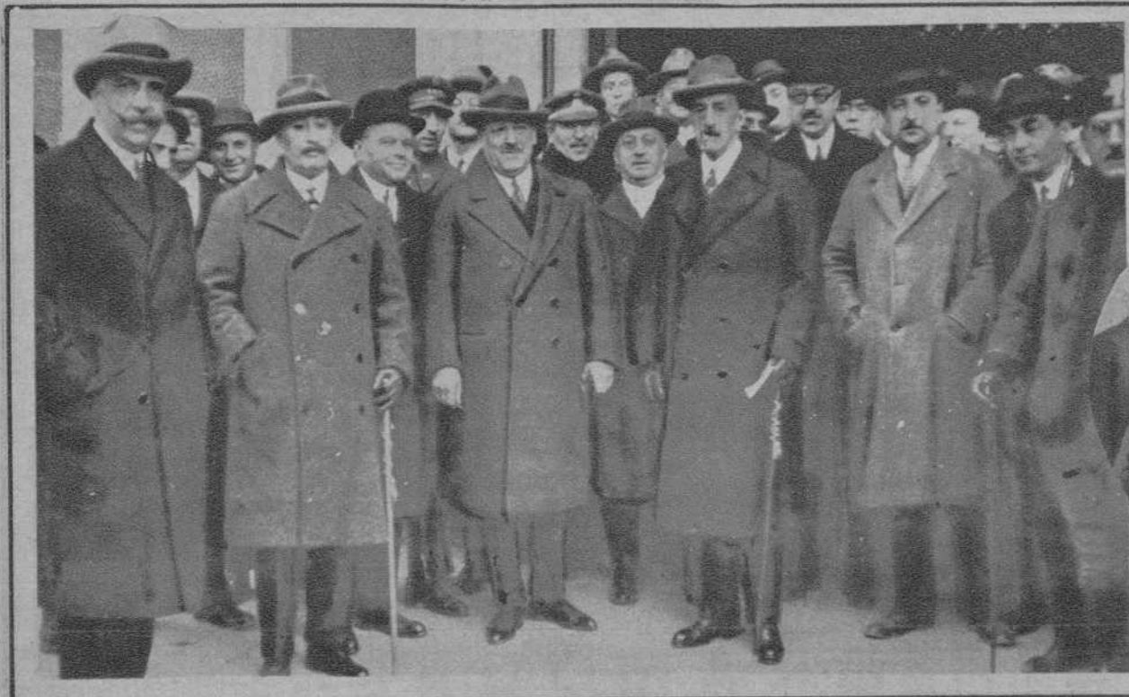
BARCELONA.—Llegada al Apeadero del ministro de la Gobernación, general Martínez Anido.