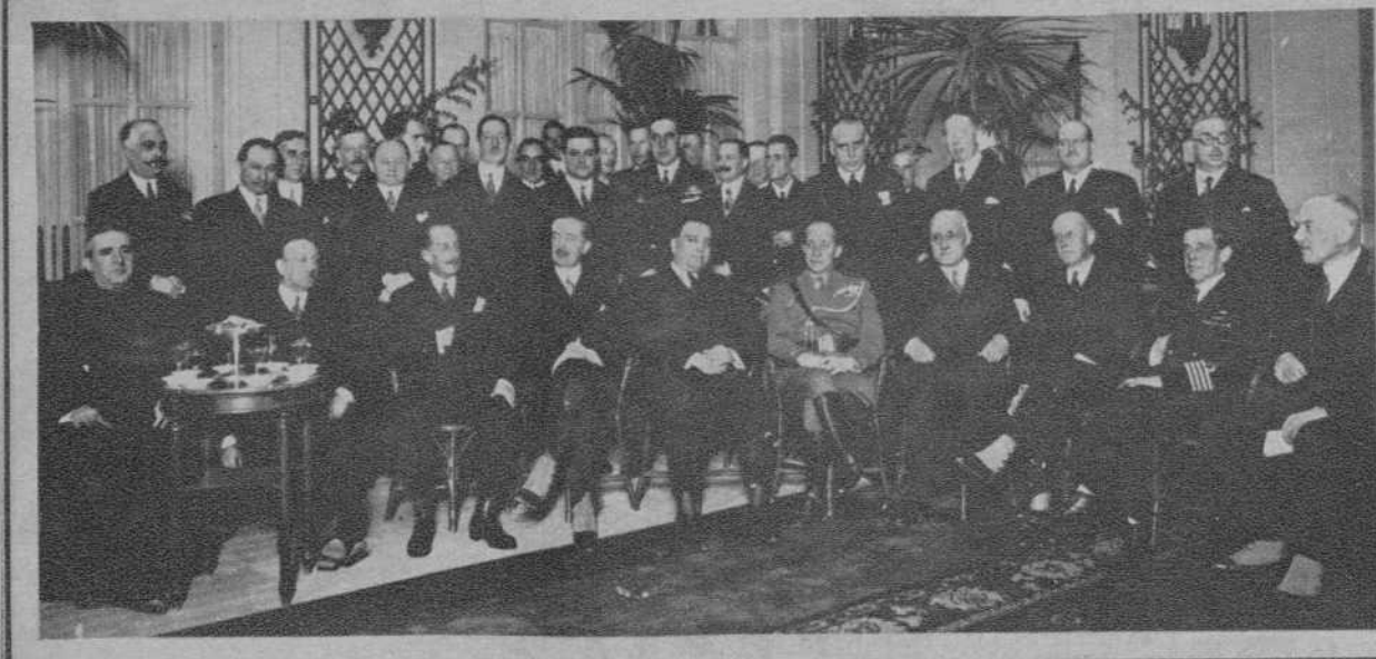
BARCELONA.—El Embajador de Alemania, el ministro del Trabajo, autoridades locales y demás personajes que asistieron al banquete inaugural de la línea aérea Barcelona-Berlin.