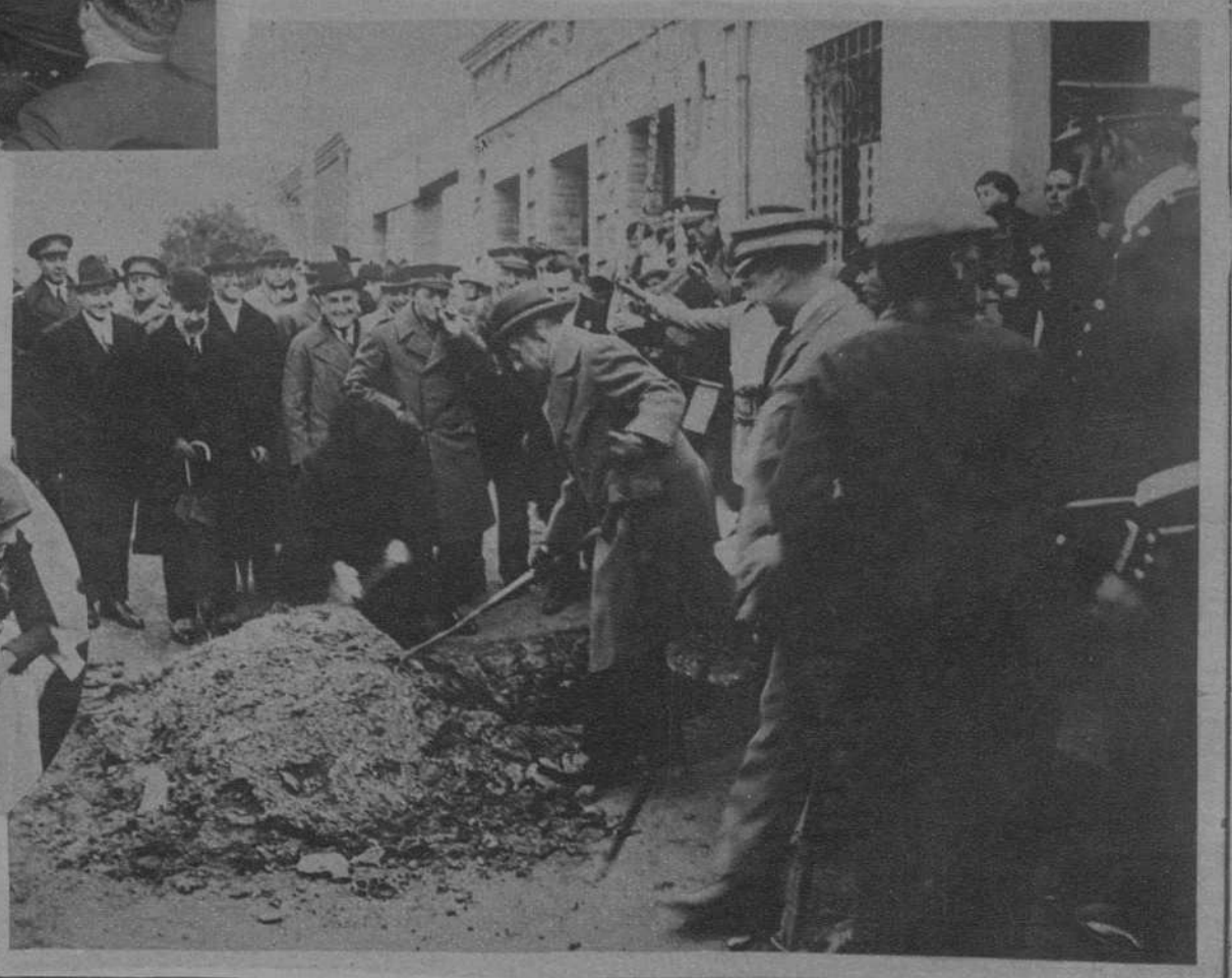
SANTA COLOMA DE GRAMANET.—El gobernador civil de la provincia echando la primera paletada de tierra en la Fiesta del Arbol celebrada en dicho pueblo. (Fot. Mateo).