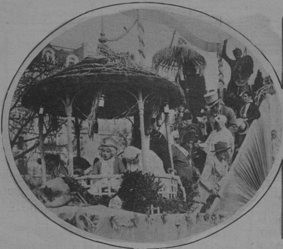
PARIS.—Carroza de «Robinson», representando una boda campestre, que figuró en la cabalgata de la Mi-Careme.