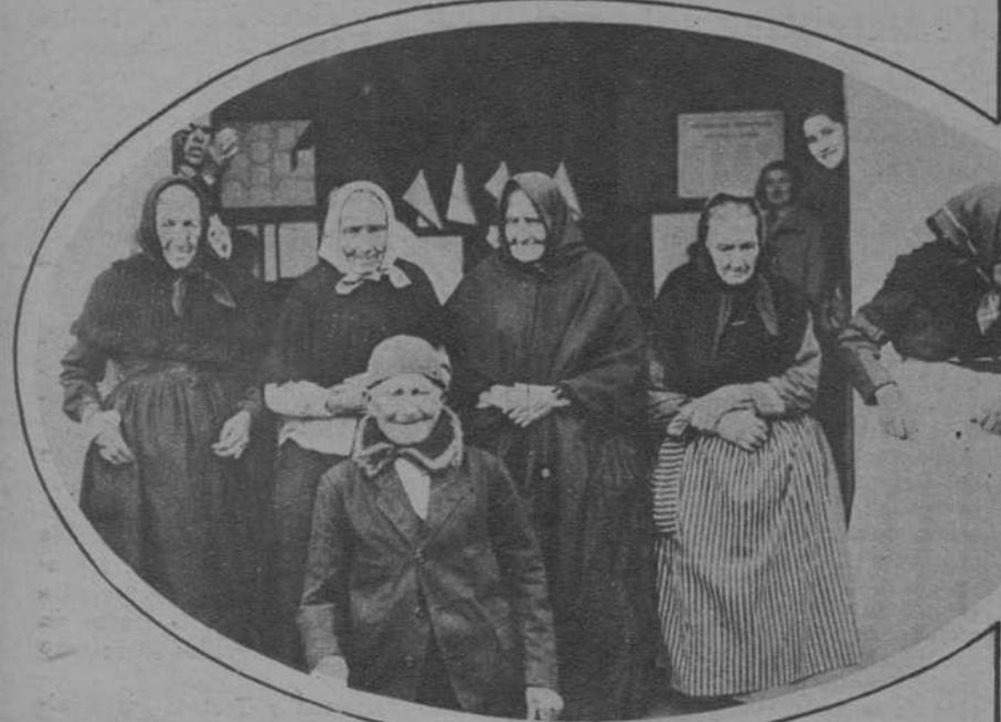
SANTA COLOMA DE GRAMANET.—Homenaje a los ancianos de más de 70 años. El que aparece en primer término tiene 103.