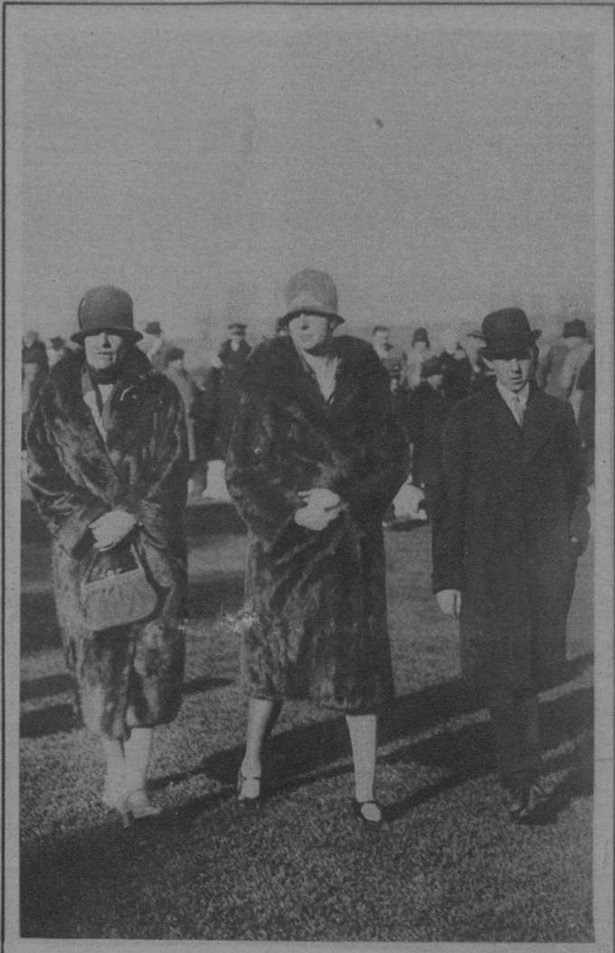
MADRID.—La Infanta doña Beatriz y el Infantito don Juan paseando por el stand, durante la cuarta reunión en el Hipódromo de la Castellana.