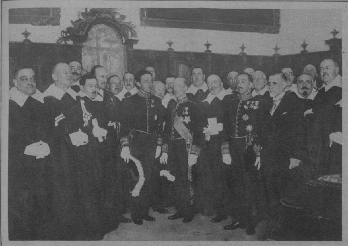
MADRID.—Los nuevos Infanzones de Illescas, entre los que figura el ministro de Instrucción pública, rodeados del Cabildo de la Real Hermandad.

Barcelona, miércoles 30 de Marzo de 1927