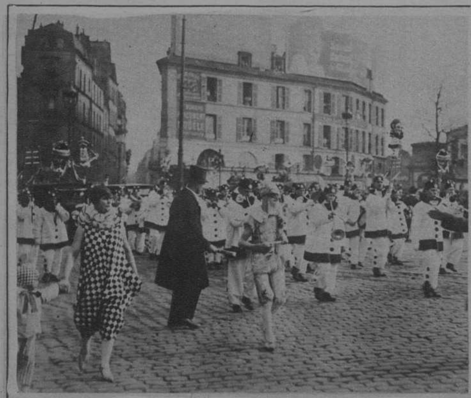
PARIS.—La mascarada desfilando por las calles con motivo de la Mi-Careme.