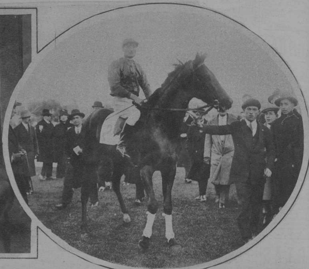
MADRID.—El caballo «Mongeneral», de J. Daniels, ganador del «Premio Torres Arias», en las últimas carreras.