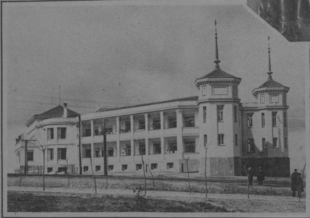
MADRID.—Vista del nuevo pabellón «Enfermería Victoria Eugenia», destinado a niños tuberculosos, en terrenos del Hospital del Rey.