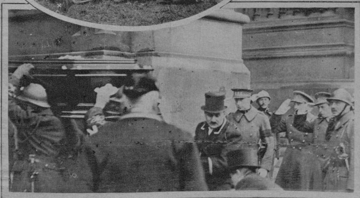
LAECKEN (Bélgica).—Funerales de la ex Emperatriz Carlota; en el fondo, el rey Alberto y los príncipes Leopoldo y Carlos.