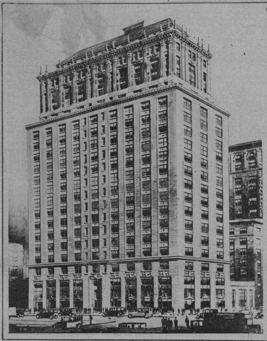
Edificio «Lexington Park», que va a ser adquirido por la compañía yanqui, que se propone construir en su solar la «Casa de España» en Nueva York