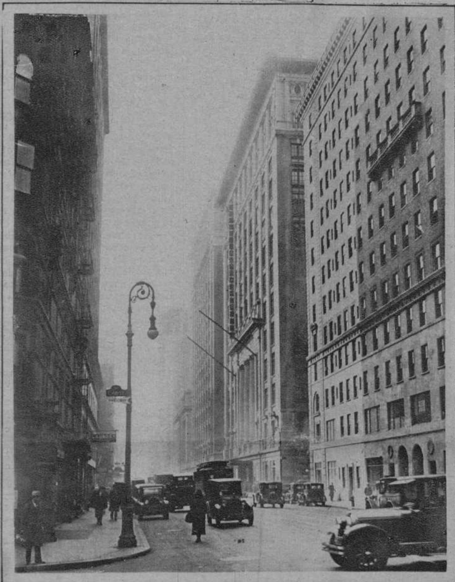
El «Grand Hotel Palace», que también ha de ser adquirido con el propio objeto. Ambos edificios, situados en uno de los sitios más céntricos de la capital americana, serán albergue de los consulados hispano-americanos y portugueses.