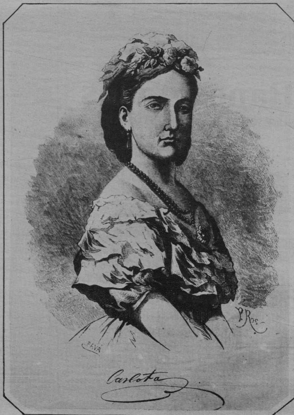
Una antigua litografía de la Emperatriz Carlota, que acaba de fallecer en Bélgica (Fot. Vidal)