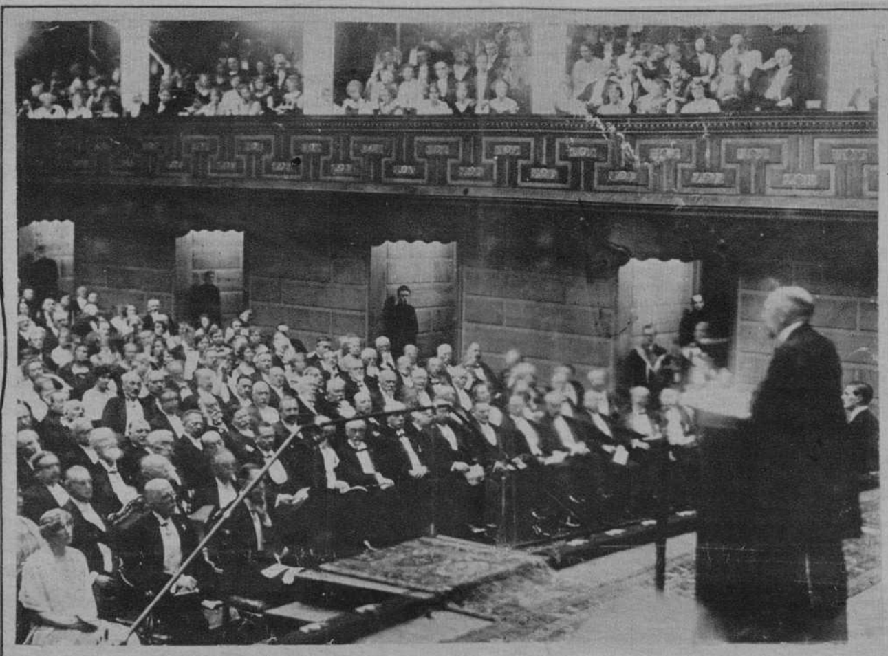
ESTOCOLMO. Solemne sesión celebrada en la Sala de Conciertos de la capital sueca para la entrega de los premios Nobel a los agraciados con esta suprema distinción intelectual