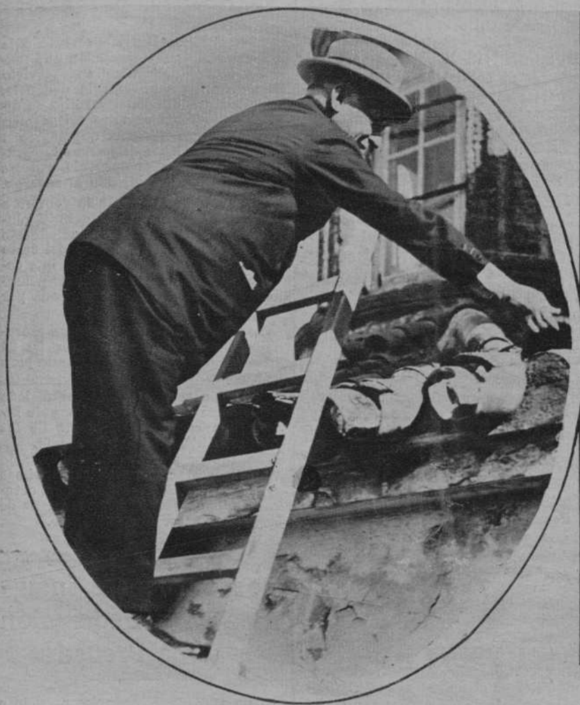
SEVILLA. El presidente del Directorio, general Primo de Rivera, inaugurando las obras de demolición del edificio del antiguo Gobierno Militar, quitando unas tejas del tejado más alto