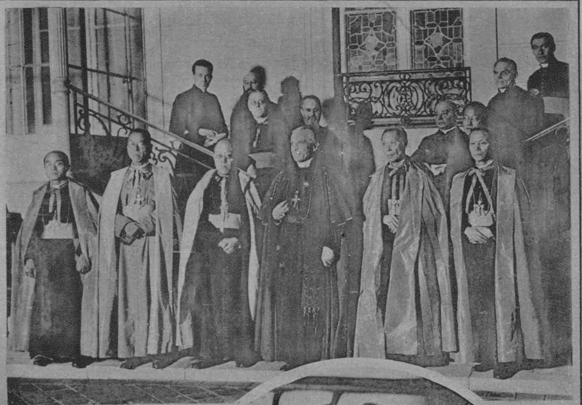
PARIS.—EL CARDENAL DUBOIS CON LOS OBISPOS CHINOS MONSEÑORES HOU, TCHEN, TCHAO, SOUN Y TSOU, QUIENES HAN SIDO RECIENTEMENTE CONSAGRADOS POR SU SANTIDAD