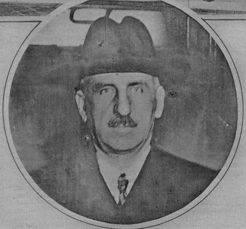
M. Nitchich, ministro de Negocios Extranjeros de Yugoslavia, que dimitió al formarse el pacto Italo-almán