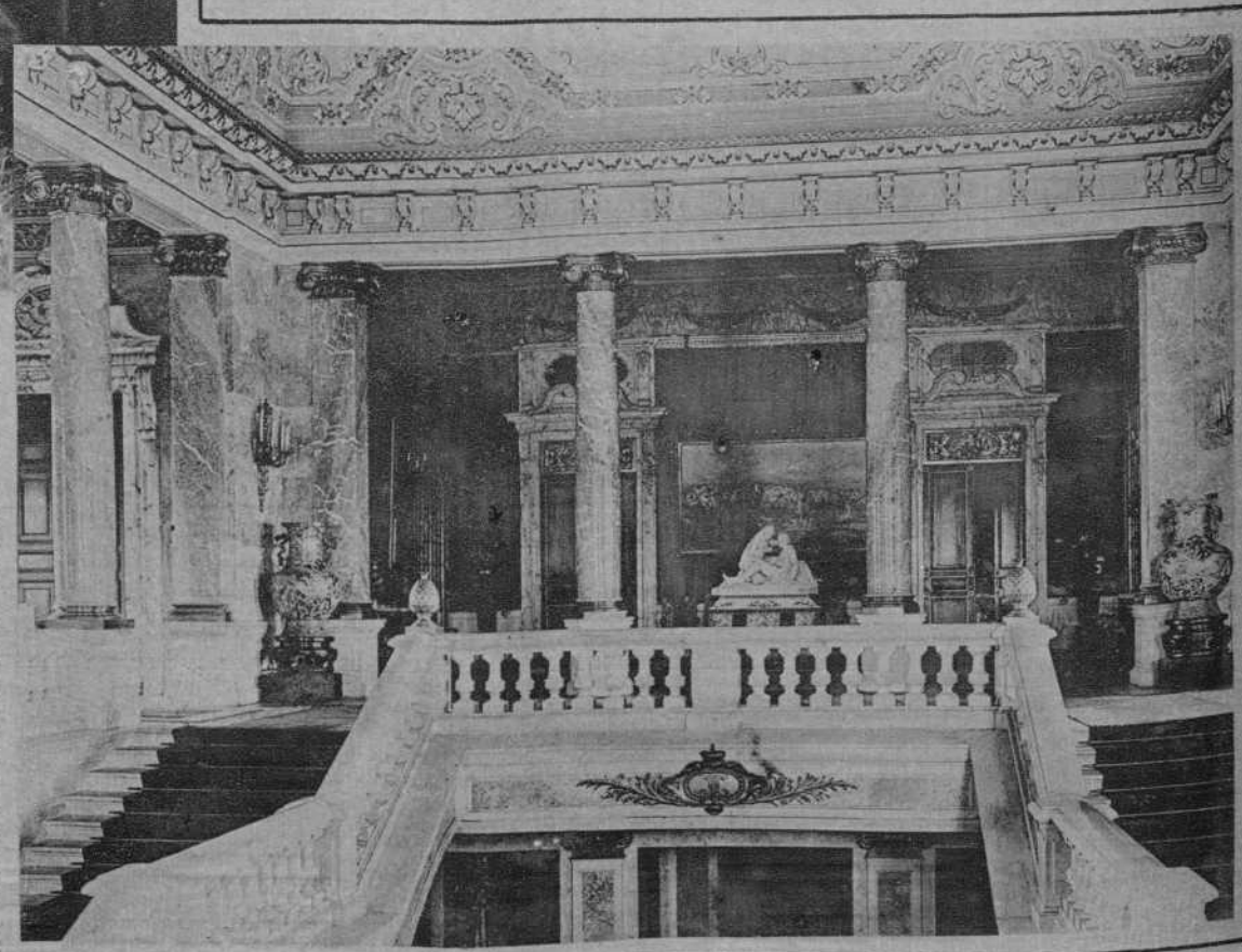
EL PALACIO REAL DE BUCAREST LA ESCALERA DE HONOR DESTRUIDA POR EL INCENDIO OCURRIDO DIAS PASADOS