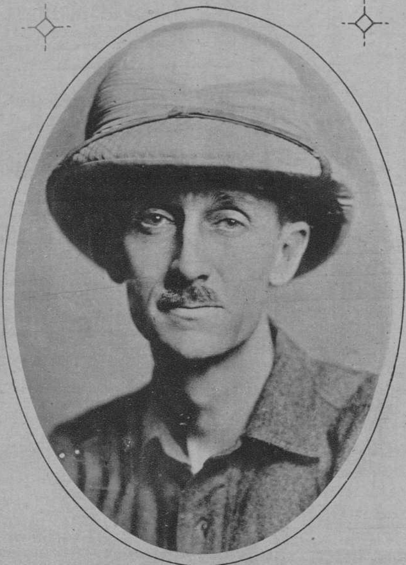
EL EXPLORADOR NORTEAMERICANO DR. WILLIAM BEEBE, QUE SE PROPONE DESCENDER A UNA PROFUNDIDAD DE 1.800 METROS DEL OCEANO