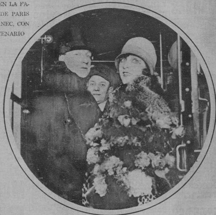
SACHA GUITRY EL POPULAR AUTOR Y ACTOR FRANCES Y SU ESPOSA IVONNE PRINTEMPS, EN LA ESTACION DE PARIS, PARA DIRIGIRSE A CHESBURGO Y AMERICA