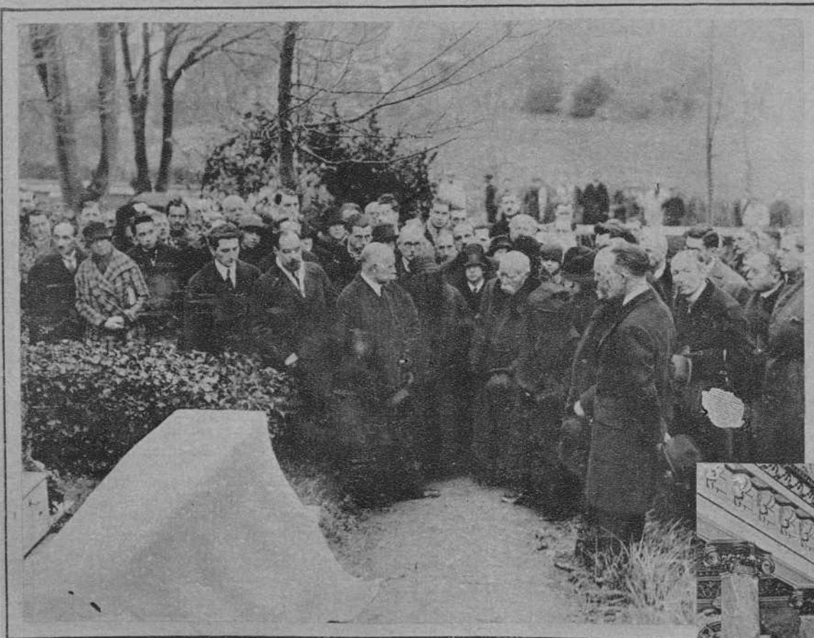
M. CLEMENCEAU EN EL CEMENTERIO DE GIVERNY, FRENTE A LOS RESTOS DE SU GRAN AMIGO, EL CELEBRE PINTOR CLAUDIO MONET