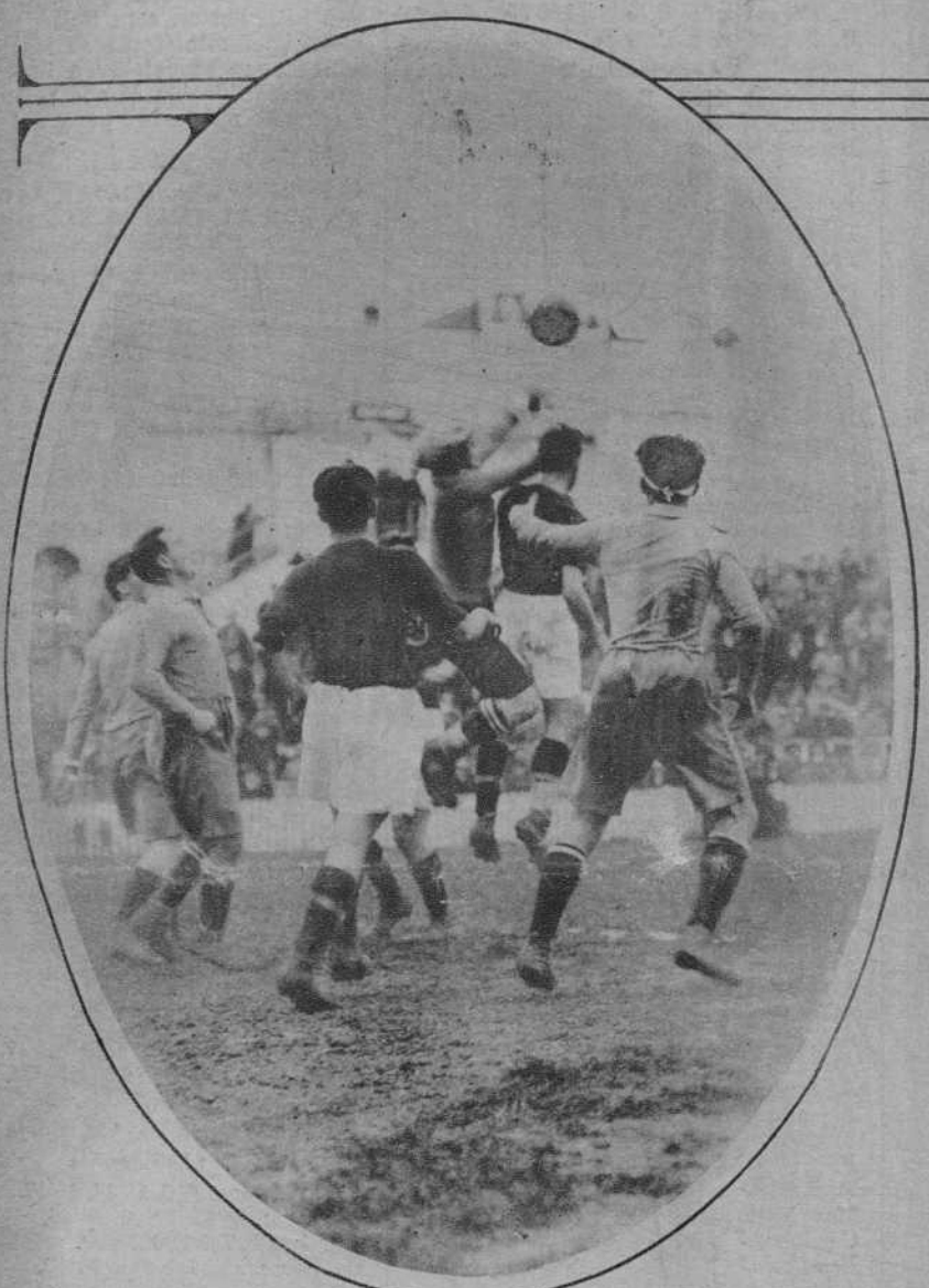
MADRID.—DEL PARTIDO DE FOOTBALL JUGADO EL MIÉRCOLES ENTRE LAS SELECCIONES DE BUDAPEST Y MADRID.—UN MOMENTO DEL PARTIDO

Barcelona, viernes 17 de Diciembre de 1926