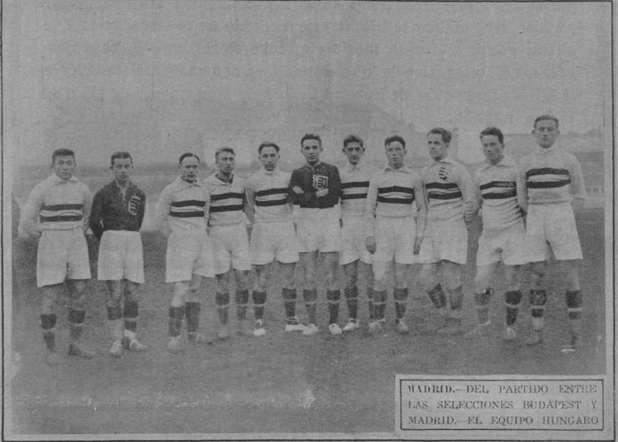
MADRID.—DEL PARTIDO ENTRE LAS SELECCIONES BUDAPEST Y MADRID.—EL EQUIPO HUNGARO