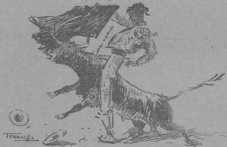
Cagancho en su primer toro