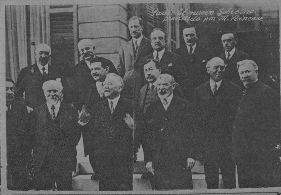
Paris. El nuevo Gobierno presidido por M. Poincaré