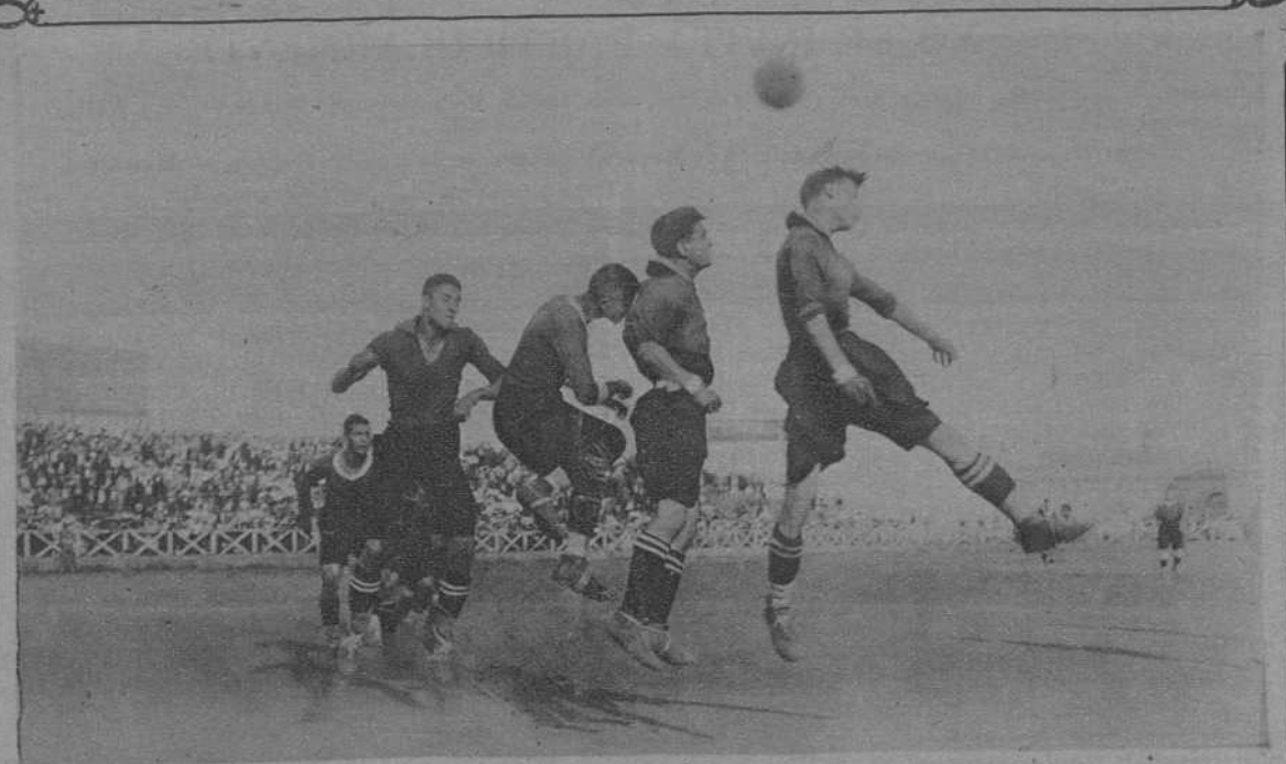
Barcelona. Una fase del match de fútbol entre el "Badalona" y "Martínenc"