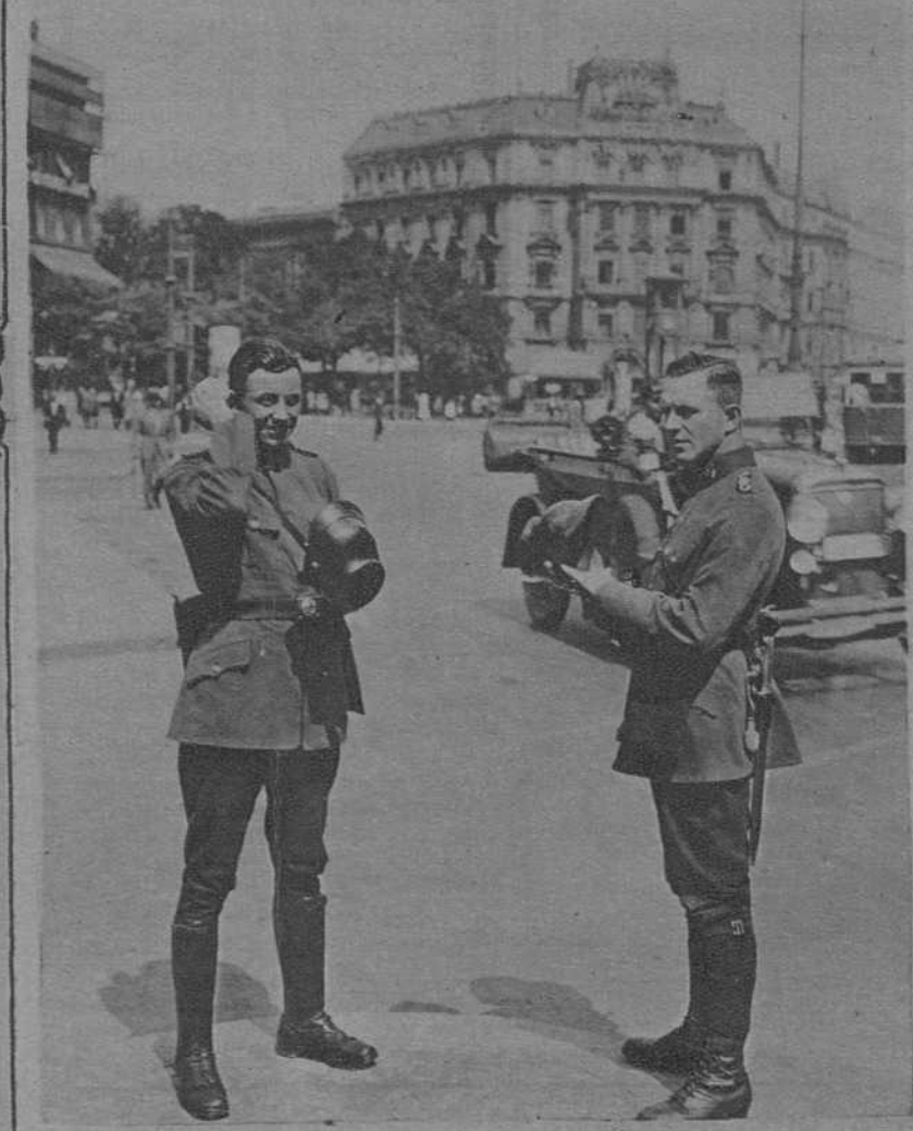
Berlin. Los soldados de la "Schupo" resistiendo el calor de solos días.