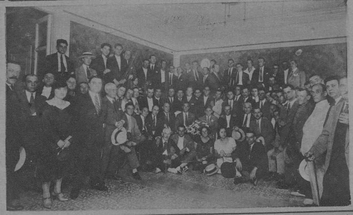
Barcelona. Homenaje tributado al campeón de boxeo, Sironés, por sus admiradores