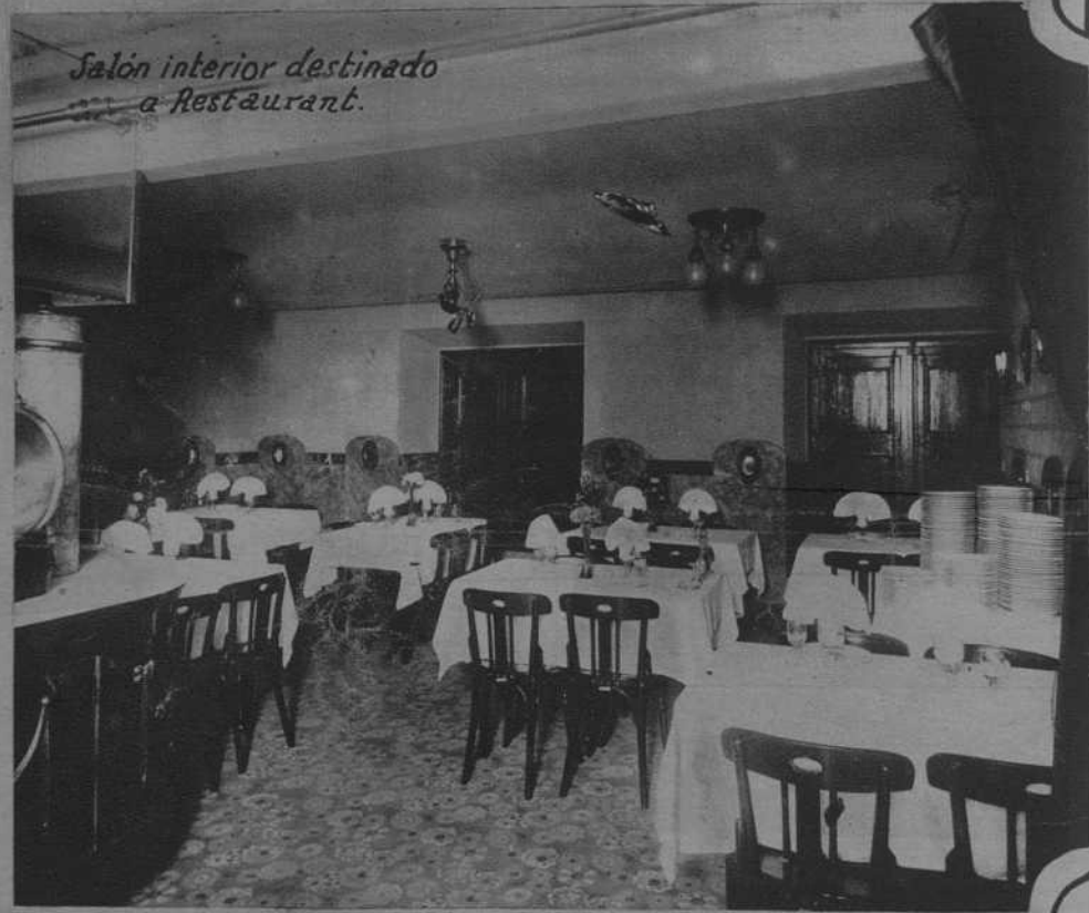
Salón interior destinado a Restaurant.