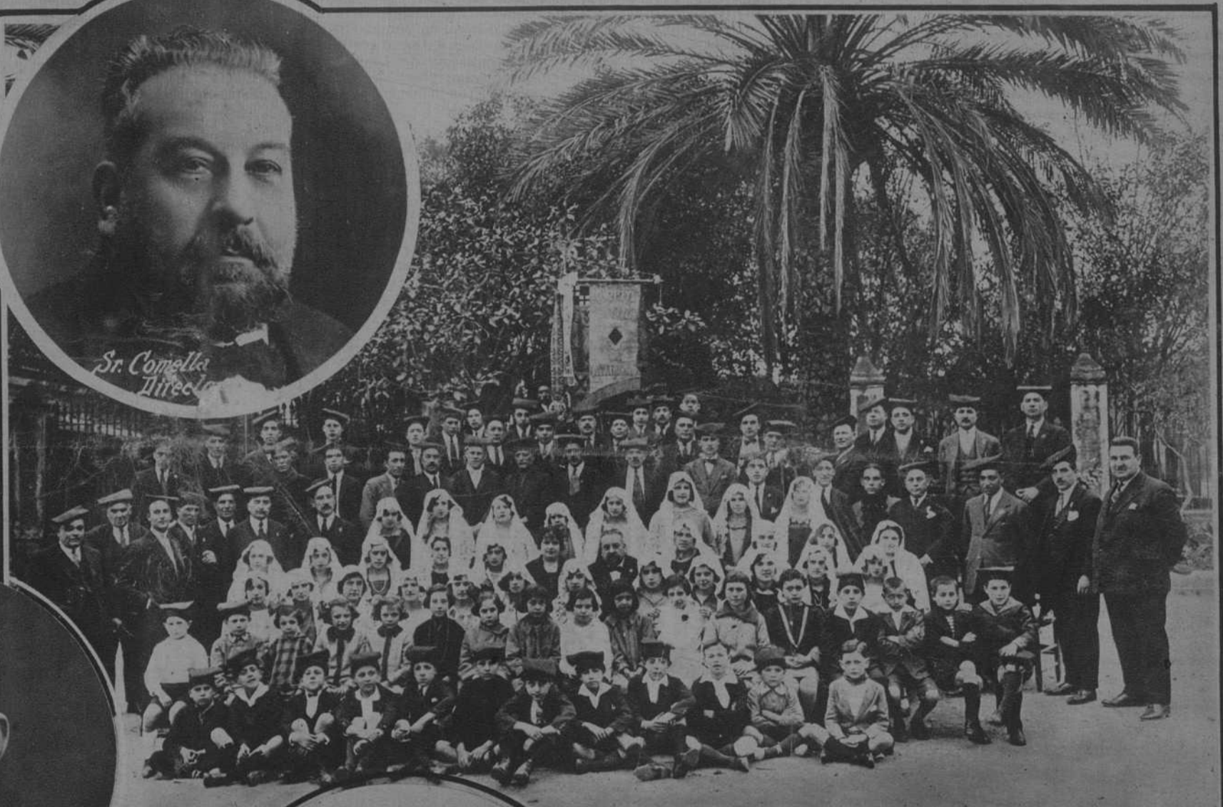
El Orfeón "L'Eco de Catalunya"