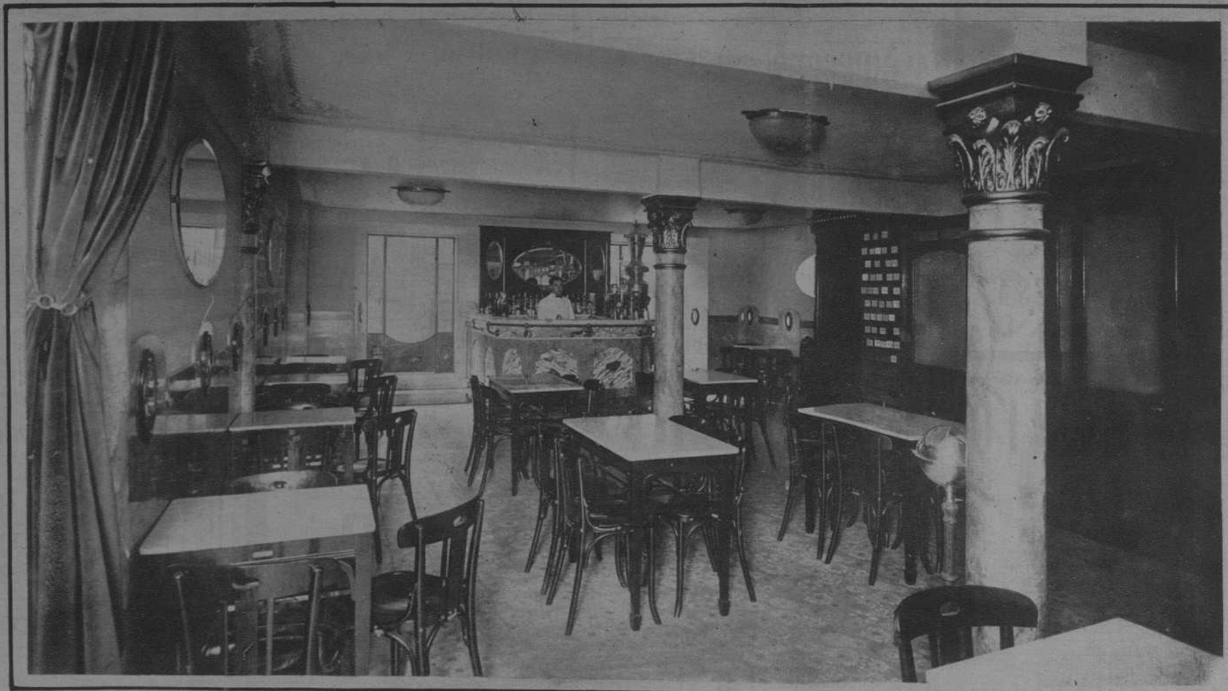
Salón Bar.