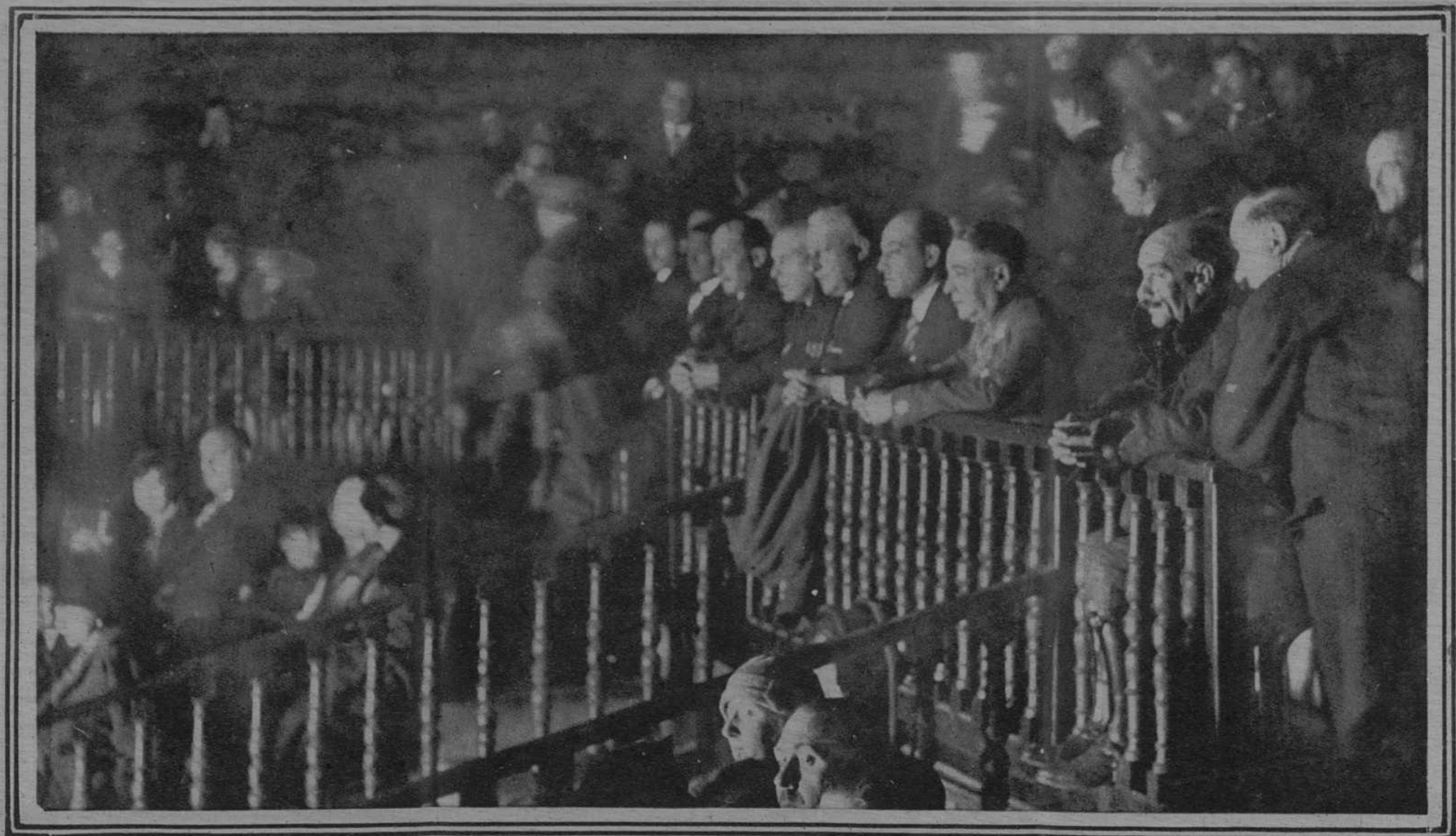
El presidente del Consejo de Ministros, general Primo de Rivera acompañado del Capitán General y demás autoridades que asistieron al estreno de la película Quo Vadis?