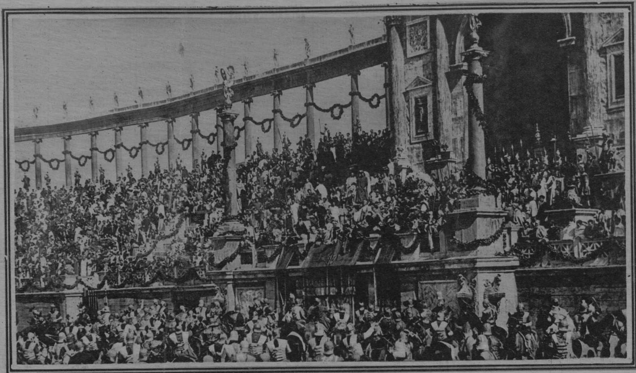
Una escena de la grandiosa película QUO VADIS? que en la actualidad se exhibe en la pantalla de Olympia