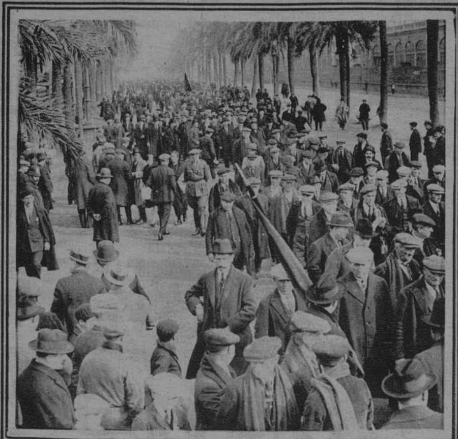
Los actos organizados por la Union Patriótica: 1. Salida del mitin celebrado en Olympia: 2. Banquete ofrecido por la Marquesa de Foronda a los jefes y oficiales del Regimiento de Badajoz: 3. El general Primo de Rivera presenciando la manifestación celebrada el domingo: 4. Los manifestantes al pasar frente a Capitanía General