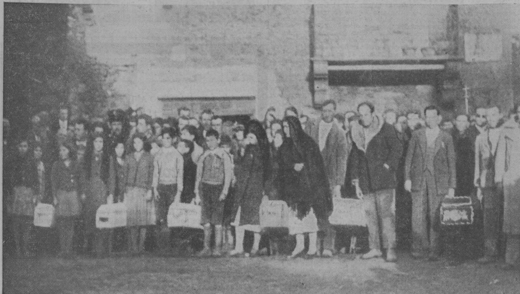
Entierro de los restos del matrimonio y sus cuatro hijos, que murieron en Saucelles (Salamanca), al estallar la dinamita que guardaban en la casa