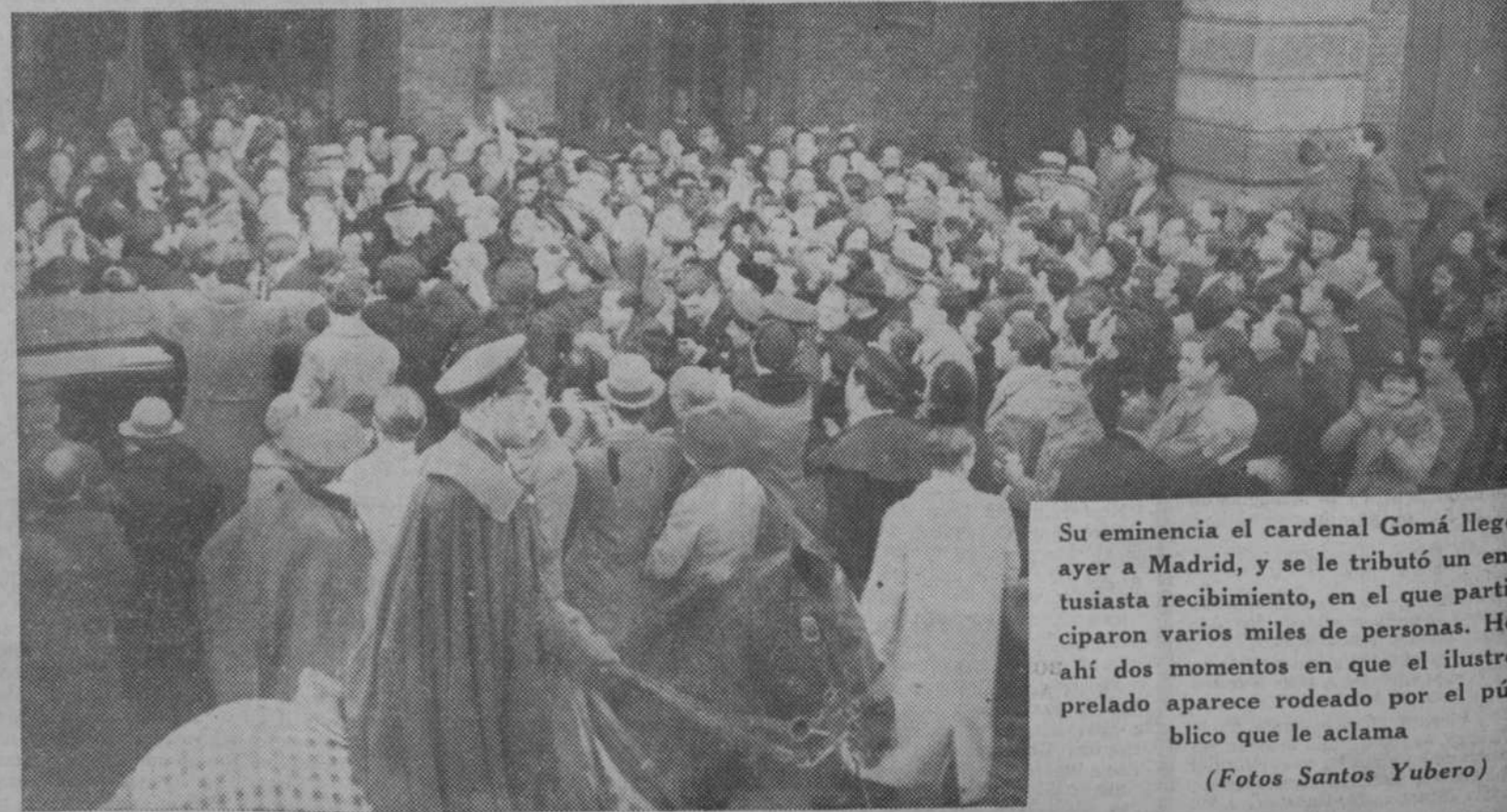
Su eminencia el cardenal Gomá llegó ayer a Madrid, y se le tributó un entusiasta recibimiento, en el que participaron varios miles de personas. He ahí dos momentos en que el ilustre prelado aparece rodeado por el público que le aclama