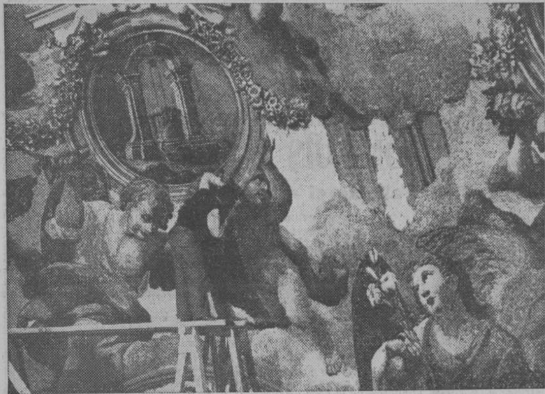
Un obrero de los que trabajan en la restauración de los mosaicos de la cúpula de San Pedro, de Roma, situados a ochenta metros de altura