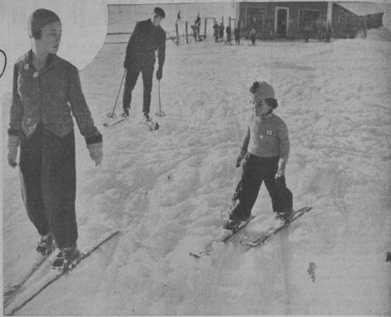
Esta pequeña deportista se inicia en el manejo de los esquís, en Beuil. Alpes Marítimos