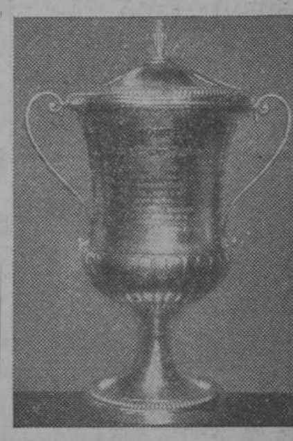
COPA DE LA EUROPA CENTRAL ("Mitropa Cup")

Efectivamente, la Copa Internacional ha dado resultados maravillosos desde el punto de vista deportivo, y este con-