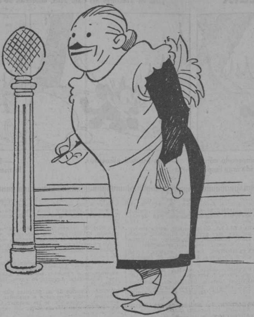
—¿Se me ve el plumero?