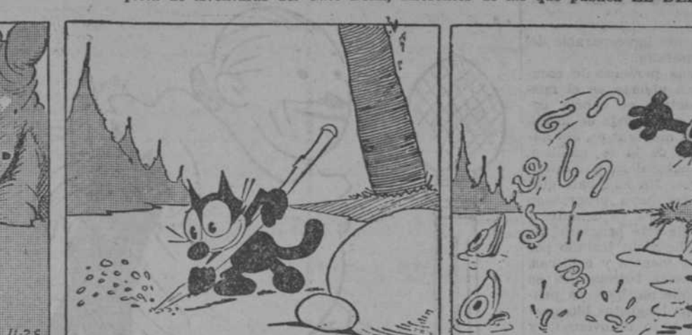
—Voy a ver cómo viven los pececitos. —Aparte de que no comprendo cómo no se ahogan, parece una vida muy limpia. —Les buscaré alimentos. —Dentro de unos segundos, angulas a la marinera.