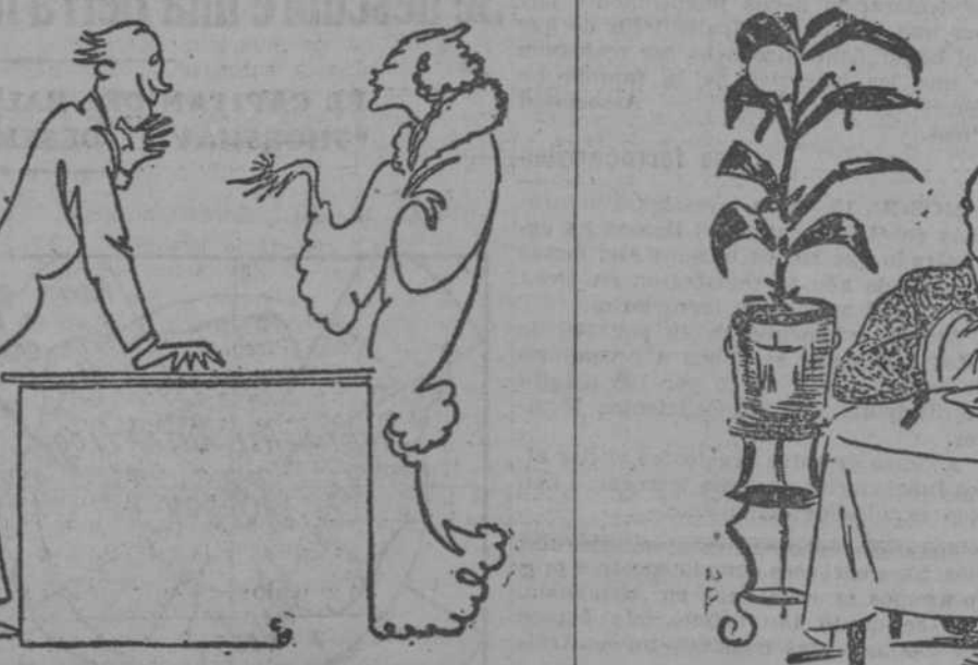
—¿Quisiera saber si esta joya que me ha regalado mi marido es falsa o verdadera? —¿Cuánto tiempo llevan ustedes de casados? —Doce años. —Es falsa. ("Guerin Maschino", Milán.)