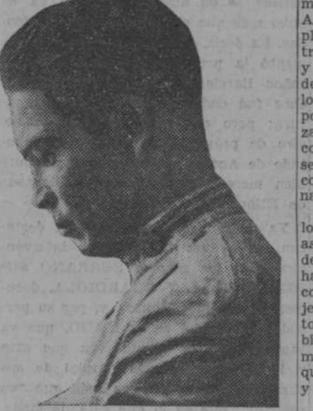
EL CORONEL BATISTA

Idieron, pues, el lento acceso de los indígenas a las escuelas francesas. Así