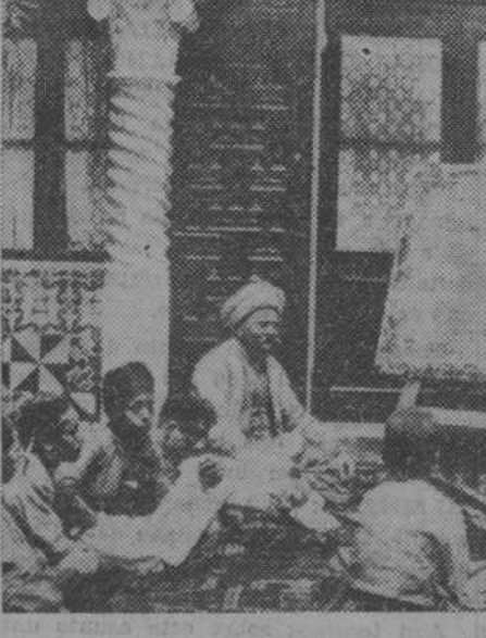
Una escuela coránica en Argel

Los Estados Unidos no intervendrán para nada en el conflicto planteado y no enviarán crucero alguno de su flota a aguas de Cuba, a pesar de que el Gobierno español haya dado orden a uno de sus cruceros para que zarpe con rumbo a La Habana.