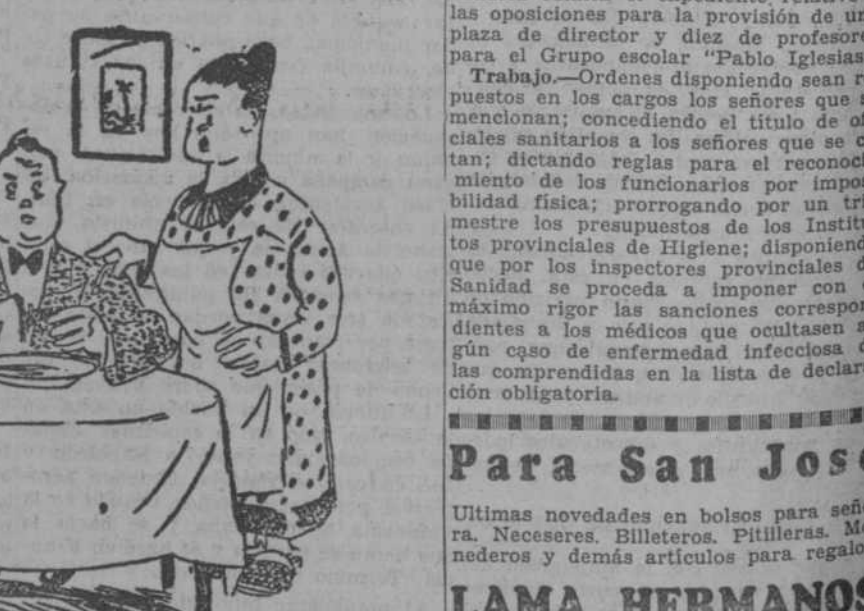
—Haga el favor de no limpiar los cubiertos en la servilleta. En primer lugar, no lo necesitan, y, en segundo lugar, la servilleta se pone muy sucia. ("Hummel", Hamburgo.)