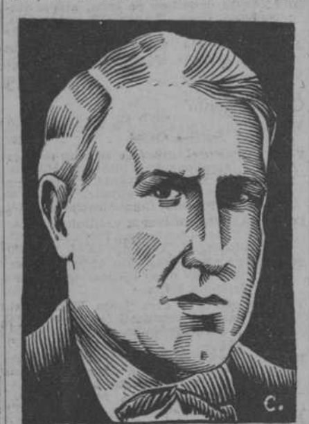
PABLO GARGALLO (Apunte por Cobos.)

—calidad primaria del artista—, la transmite al espectador encarnada, materializada, en un lenguaje plástico de fórmulas universales.