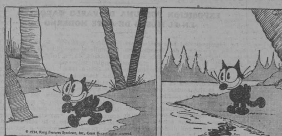
—Voy a ver cómo viven los pececitos. —Aparte de que no comprendo cómo no se ahogan, parece una vida muy limpia. —Les buscaré alimentos. —Dentro de unos segundos, angulas a la marinera.