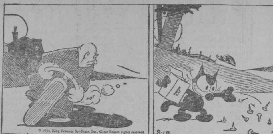
—Esta "moto" de la "Poli" me va a servir maravillosamente. —Esta es la única carretera de salidas; así que forzosamente tiene que pasar por aquí.