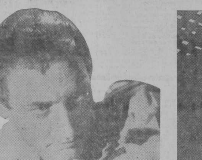
Warren William en "Cleopatra"