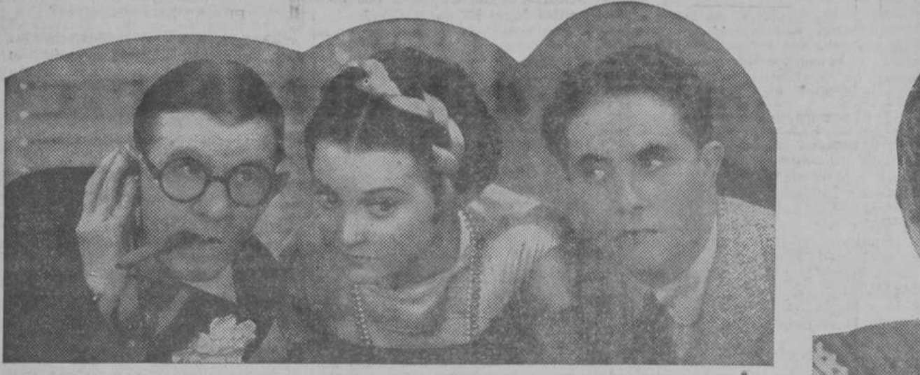
La popular pareja Wheeler and Woolsey reaparece el lunes en el AVENIDA en la graciosísima película Radió "Amor y alegría"

por funcionarios Cuerpo. Máquinas examen. Preparación completa, 20 pesetas; por correspondencia, 25. Contestado, 25; a reembolso, 28. Los regulamos al más alto nivel. Todos nuestros alumnos se examinan con la máquina en que practican.