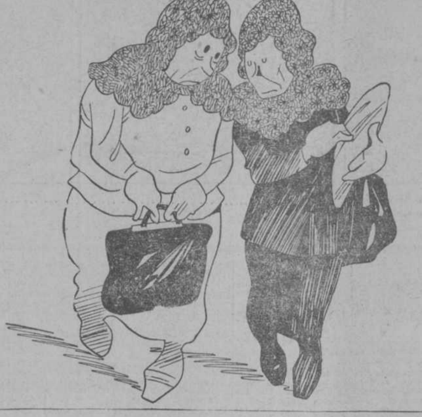
-Sigue hablando, señora Gertrudis; pero con grandes intervalos. -No le extraña. Estará sometido a la censura.