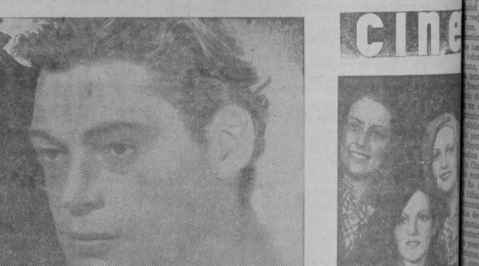
Jonny Weismuller, el auténtico Tarzán, en el gran "film" "Tarzán y su compañera", que el lunes se estrena en el PALACIO DE LA MUSICA