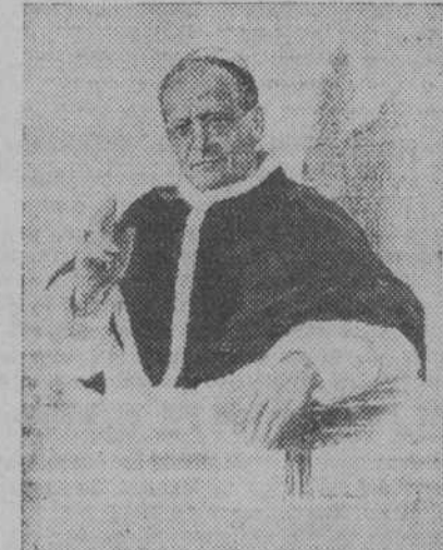
Oleografías de S. S. Pio XI (54 x 64 cms.) para Círculos y Centros de Acción Católica, Juventudes, Padres de Familia, salas parroquiales, etc. DIEZ PESETAS, UNA.

Se ha planteado la conveniencia de aplazar la fecha del homenaje, teniendo en cuenta la prolongación del estado de alarma, y se ha dejado para la reunión del próximo jueves, día 7, la conveniencia de fijar la fecha definitiva.