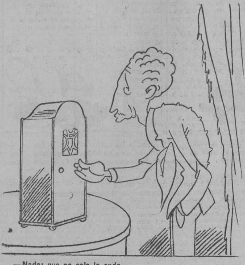
—Nada; que no cojo la onda.