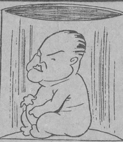
¡AHI QUEDA ESO!

ABANDONADO POR TUS ELECTORES EL SOCIALISMO TE RECOGE