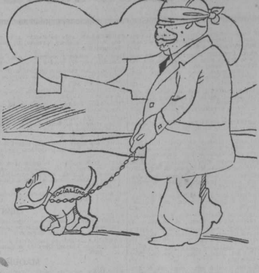
¿Quién lleva a quién?