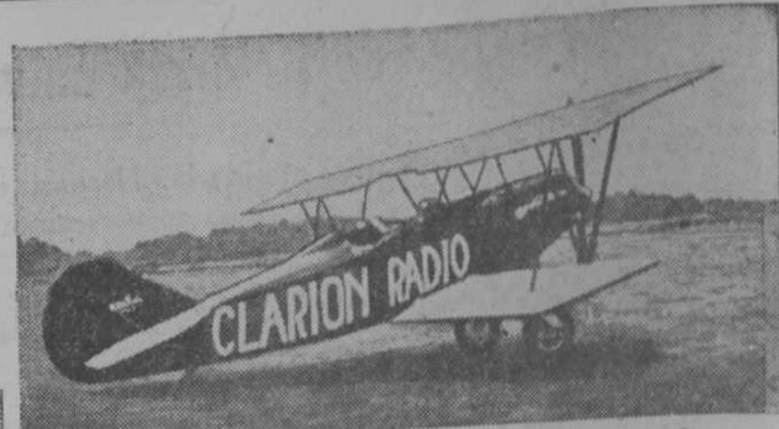
Para la distribución de sus aparatos por vía aérea, la fábrica productora de los afamados Clarion dispone de aeroplanos como el que se ve en la "foto"

¡Qué tranquila escena de hogar! En ausencia del marido, alegre su trabajo casero con un magnífico aparato SAMA