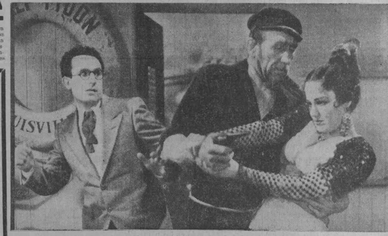
Harold Lloyd y Constance Cummings en "Cinemania", el gran "film" cómico que se proyecta en Astoria