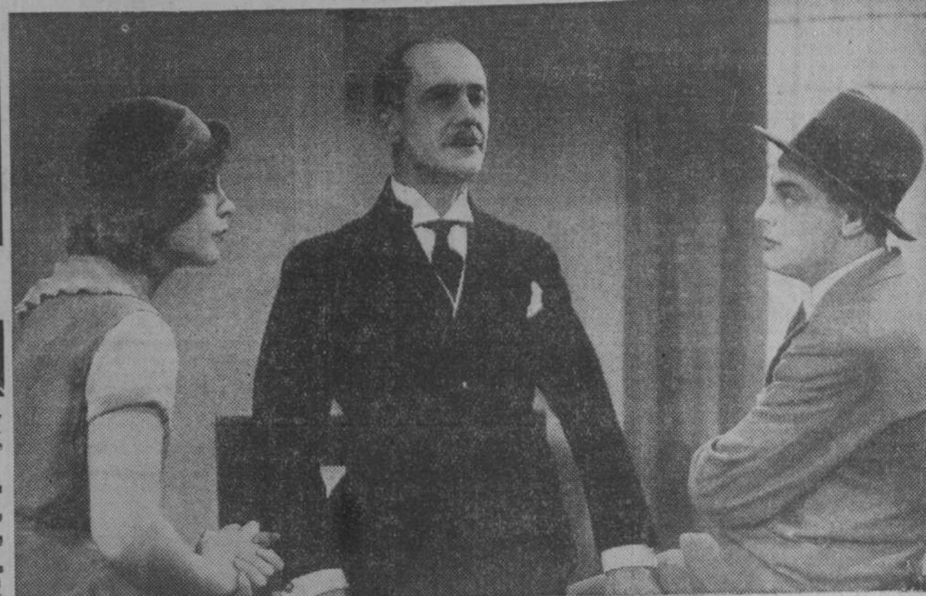
Una escena de "Las maletas del Sr. O. F.", magnífica producción que pronto presentará en Madrid Selecciones Filmófono