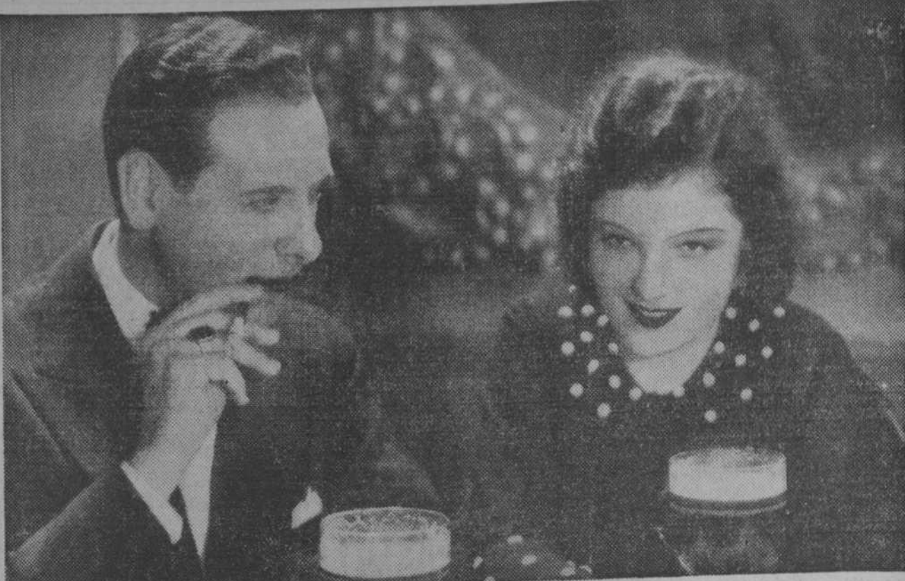
Una escena del "film" "Las Telefonistas", que en breve presentará Renacimiento Films

Esta noche, ESTRENO de BARRIOS BAJOS de LUIS FERNANDEZ ARDAVIN