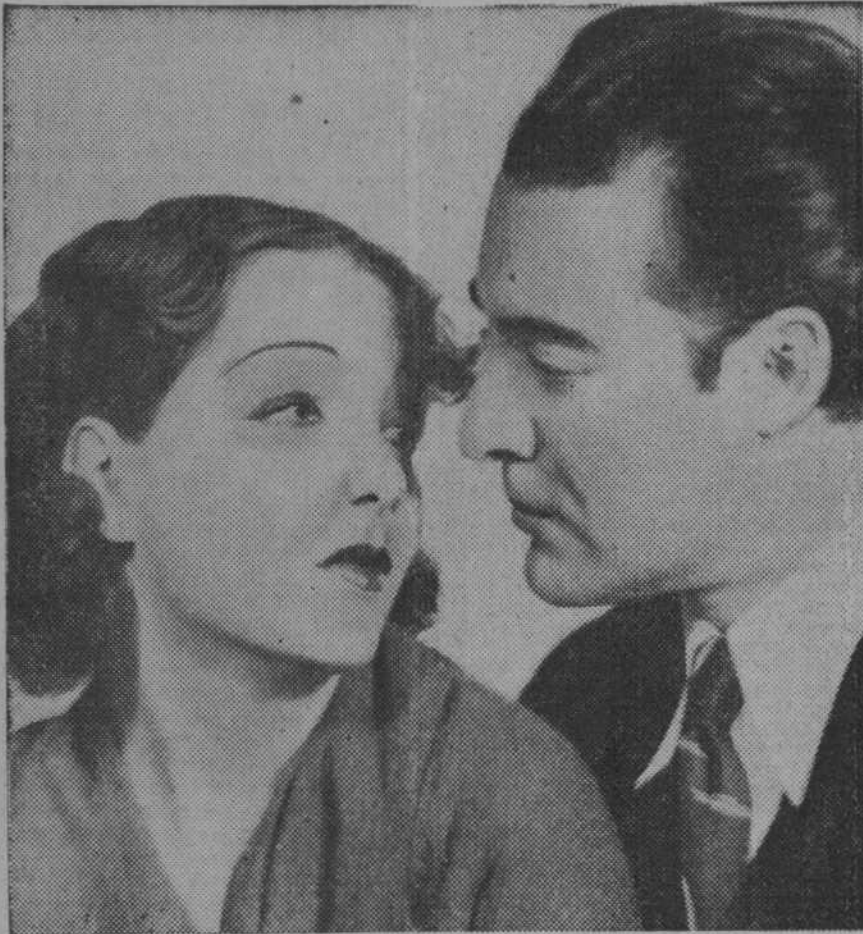
Lupe Vélez y Ramón Pereda en un momento de la producción Columbia, en español, "Hombres en mi vida"