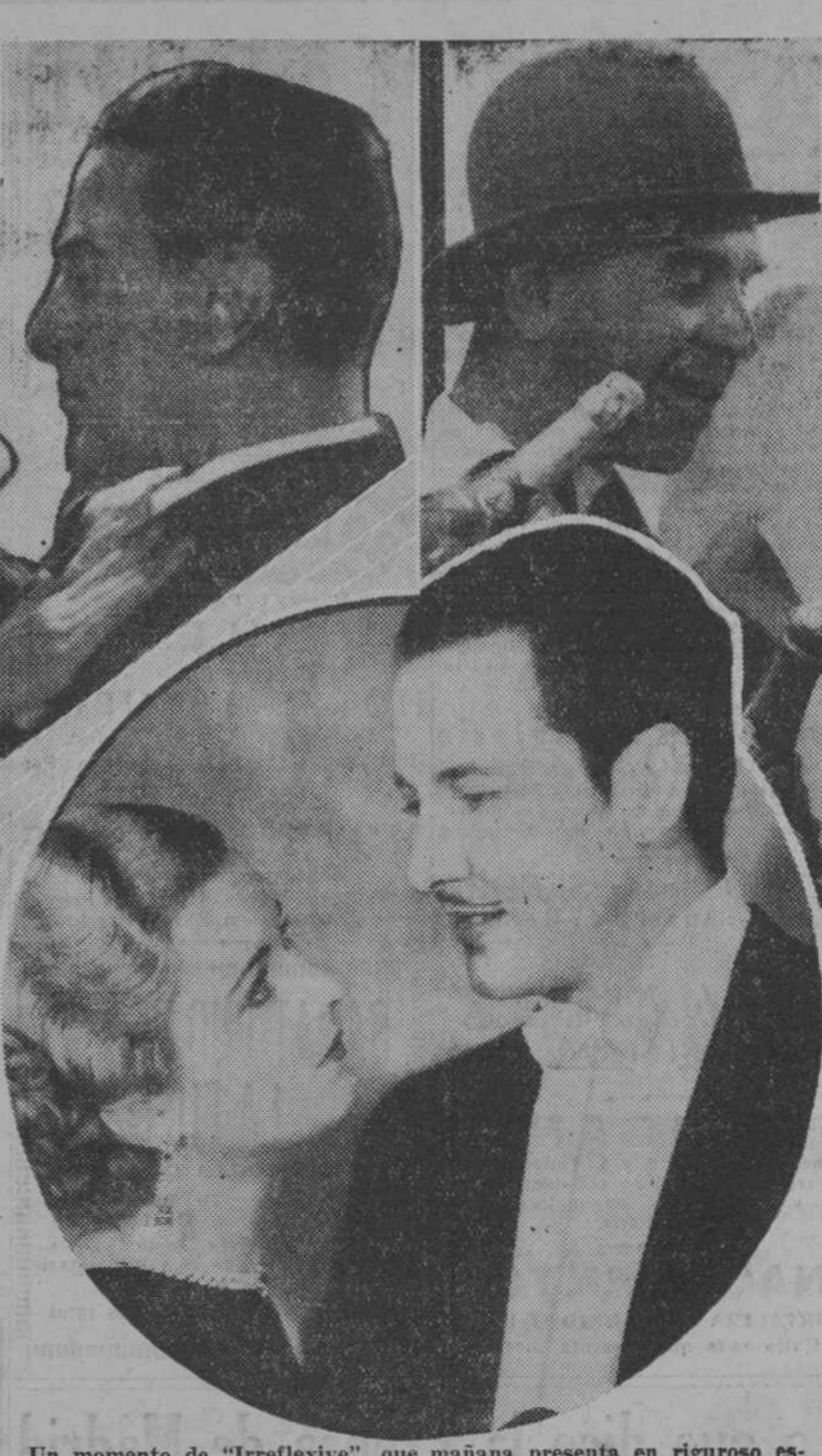
Un momento de "Irreflexive", que mañana presenta en riguroso es-treno el Cine Royalty

El próximo miércoles, en función pri-vada, abrirá sus puertas el magnífico palacio cinematográfico de la calle de la Fuencarral.