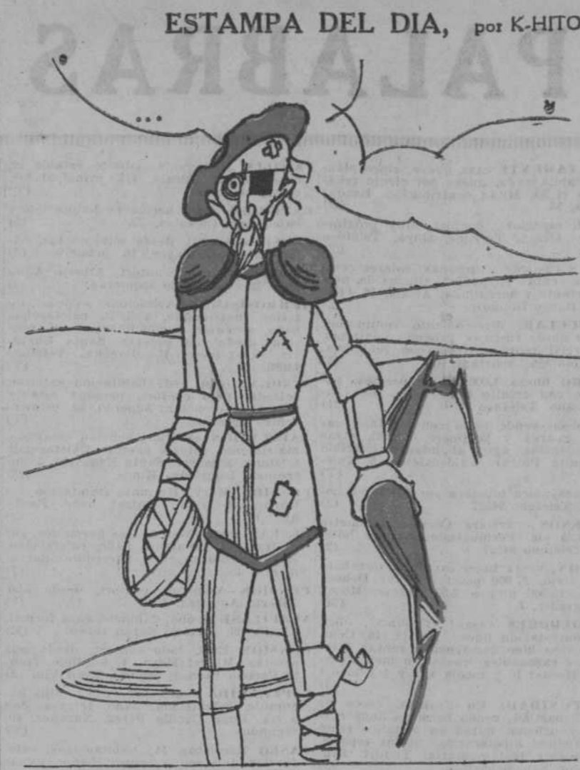
EL INGENIOSO HIDALGO