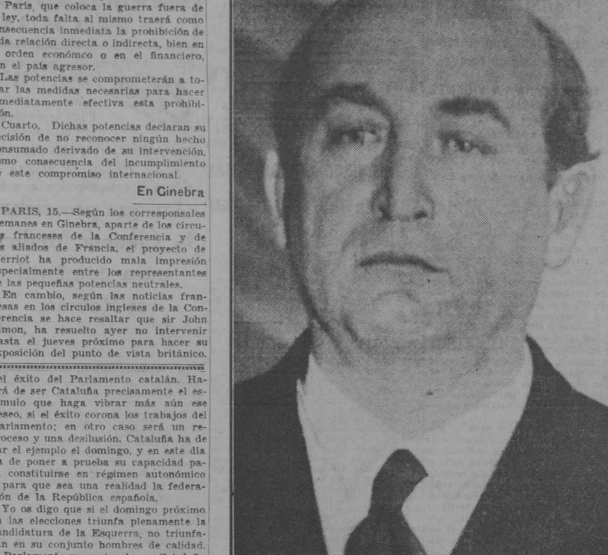
Forgas, jefe del Gobierno de Hungría, que ha visitado en estos días a Mussolini