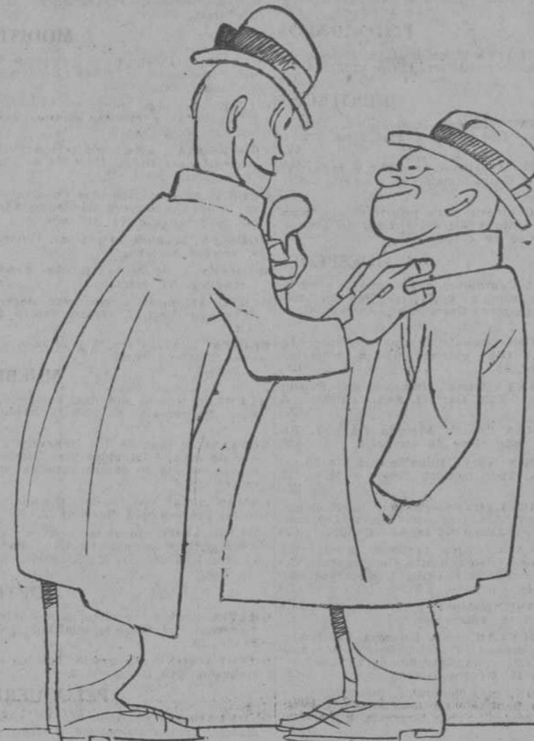
¿Usted vió aquel entusiasmo por la Esquerra? —Sí, recuerdo. —Bueno, pues ya "cambó" la decoración.