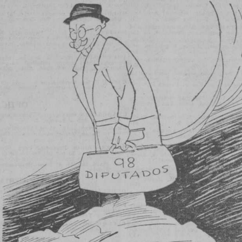
"Pero es más espantosa todavía la soledad de noventa y ocho en compañía".