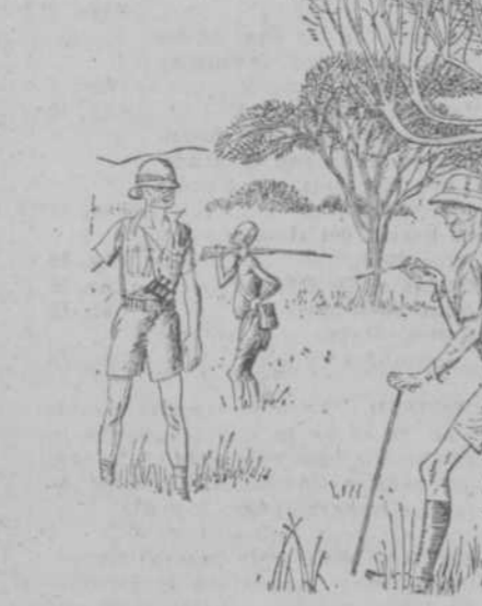
LA CAZA DEL TIGRE