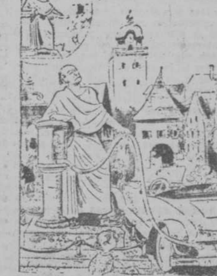
UTILIDAD DE LAS ESTATUAS

bierno español, que podía darse por cierto que España y República, son dos nombres diferentes de una misma entidad.»