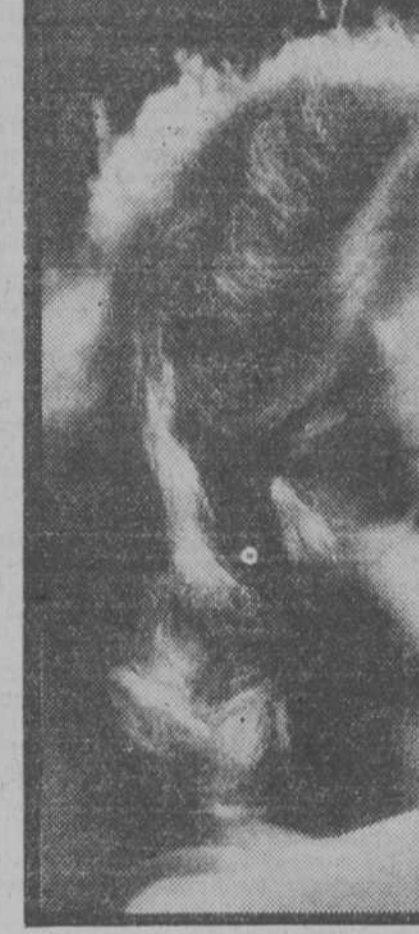
Una bella "posse" de Marlene Dietrich, la joven actriz que actualmente triunfa en "El expreso de Shanghai, que se exhibe en el Astoria

Para cuántas muchachitas que han visto transcurrir los más preciados años de su vida entre las paredes de un pensionado, será "Muchachas de uniforme" la obra sensacional, una visión fiel, cruda, inolvidable de un pasado que ha dejado en su alma un resaca de indefinible amargura! Cuántas verán en esta obra reproducidas emocionantes fases de la propia vida y se sentirán arrebatadas por un torbellino de recuerdos! La vida en el pensionado, con su férrea disciplina casi militar, con sus pautes desmedidos de todo adorno que pa-