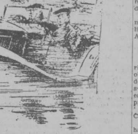
EL LADRON DE «AUTOS». — Empieza a llover. Este «auto» descubierto no nos sirve. Vamos a dejarlo y nos llevaremos uno de conducción interior.

Máxima calidad, precio ínfimo. Plaza de Santa Ana, número 1.