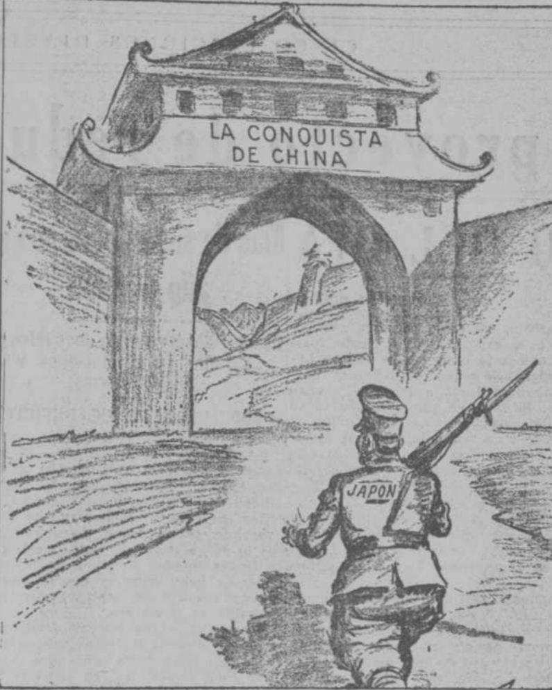
COMO ENTIENDE EL JAPON EL REGIMEN DE PUERTA ABIERTA